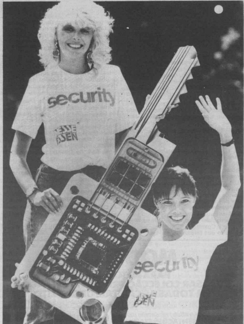
Maiores segurança oferece esta chave com um microchip integrado, aqui em dimensões exageradas para a foto. Ela conta com um código programado e não pode ser copiada. Com ela são abertas e fechadas fechaduras electrónicas.

Também as chaves ficam cada vez mais «inteligentes». Existem agora chaves com um microchip integrado, contando com um código programado que faz com que a fechadura electrónica seja segura contra o ladrão. Quem não quiser receber em casa visita indesejada, pode mandar montar na porta da entrada um «videoproteitor», de modo que o habitante pode ver quem chegou, sem ser visto.