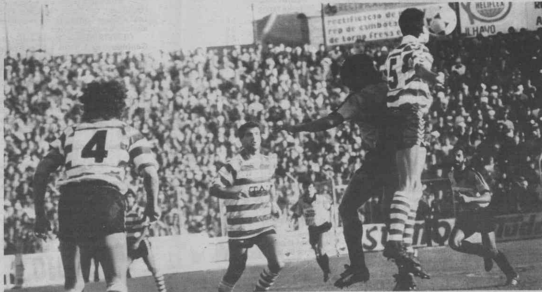
A defesa do Sporting esteve muitas vezes em dificuldade, conforme se prova nesta imagem.