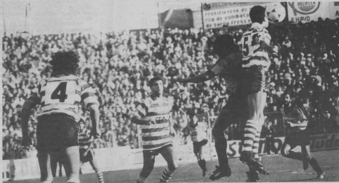
A defesa do Sporting esteve muitas vezes em dificuldade, conforme se prova nesta imagem.