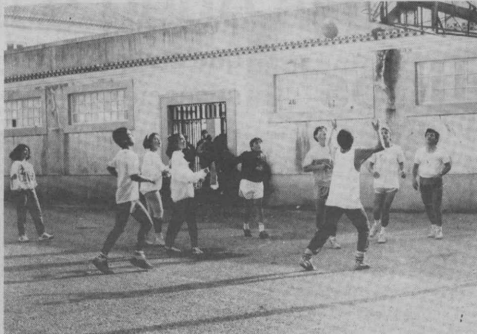
«O bom senso aponta para que não se tomem medidas precipitadas em educação» — consideram as Associações de Pais de Aveiro.

No entender das Associações de Pais de Aveiro, o Ministério da Educação deveria implementar dois caminhos convergentes para resolver o problema do acesso ao ensino superior: preparar uma alteração profunda, o mais consensual possível, no âmbito da reforma do sistema educativo e a ser aplicada aos alunos que se encontram no 9.º ano, por um lado; e ir melhorando o sistema em vigor aos poucos de modo a aproximar um modelo do outro. No entanto, «não foi isso que aconteceu e, em vez de se dar um passo em frente,