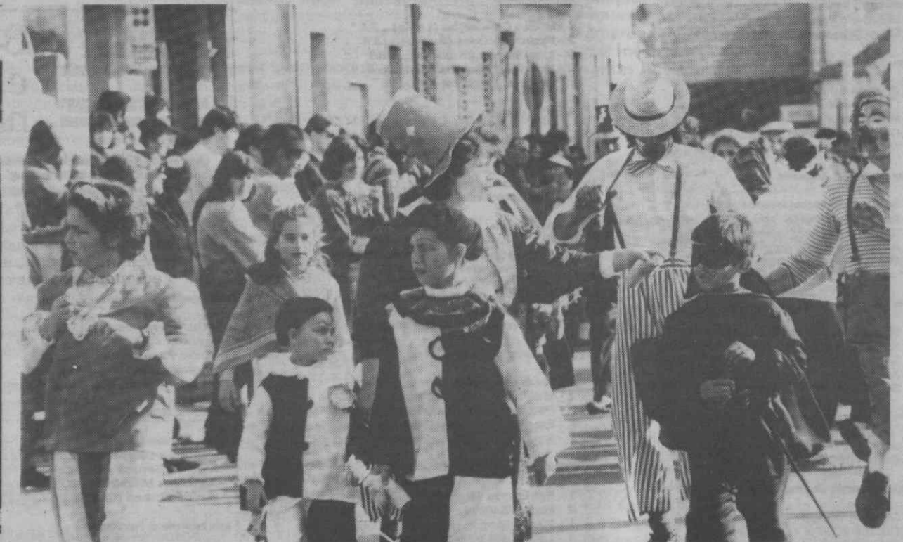
Grandes e pequenos, as tristezas atrás das costas... é a festa, é o Carnaval.