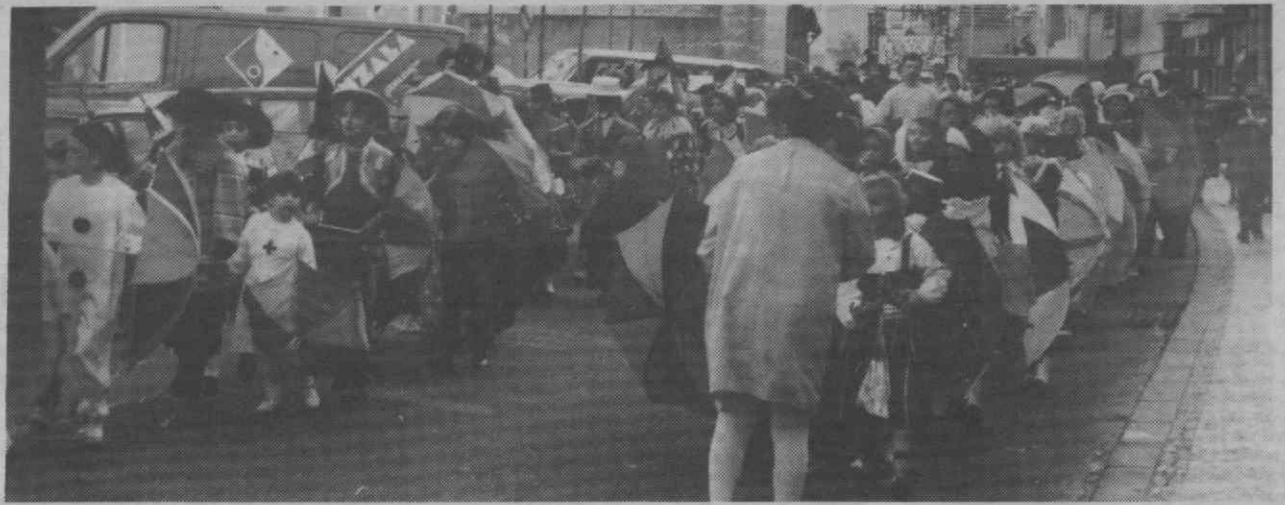
A alegria das crianças num dia em que ninguém leva a mal... é o Carnaval.

Foram as vareiras, os Zorros, os pescadores, os palhaços, os super-homens, os vaqueiros, os marqueses e os condes, os dráculas e os anti-dráculas que dominaram a cidade na tarde de Domingo Gordo.