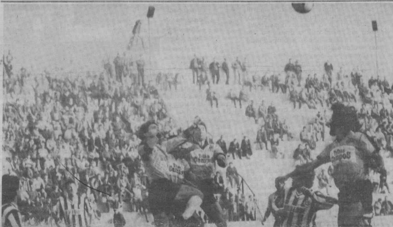
Espinho e Beira Mar disputaram animado derby regional e os lances emotivos e plenos de energia sucederam-se.

DESPORTO NO FIM-DE-SEMANA — Feirense reafirmou-se candidato