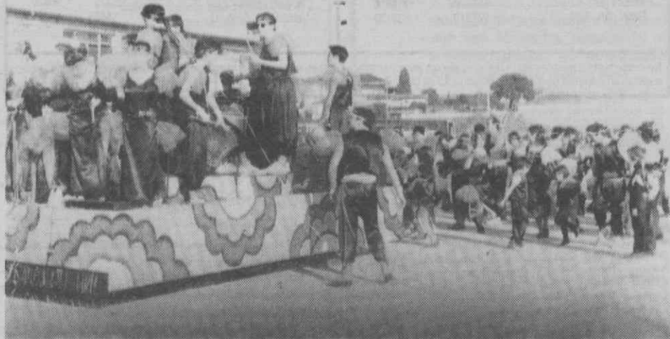
A alegria, reinação e irreverência foi a nota dominante no Carnaval luso-brasileiro, da Mealhada, como o atesta este grupo de foliões.

Com um curso multicolor e com o indispensável «cheirinho do Brasil» os grupos apeados foram os mais diversos: alguns vie-