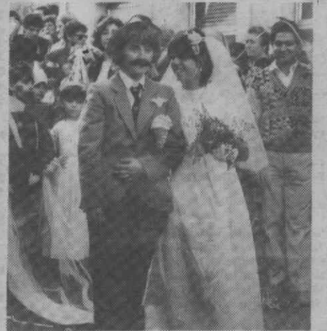
Nem no dia do casamento se perde uma festa de Carnaval...