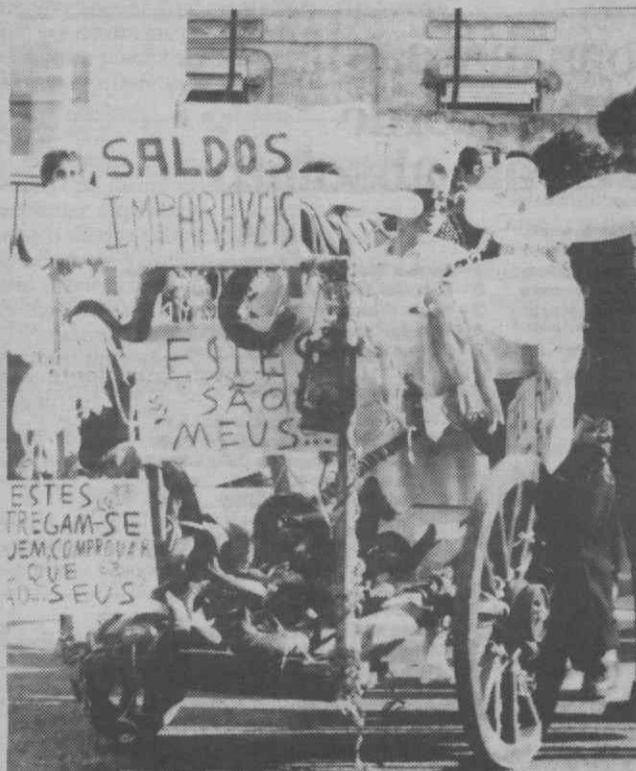
Em saldo, além do petróleo da Ria, os clientes que ninguém quer.