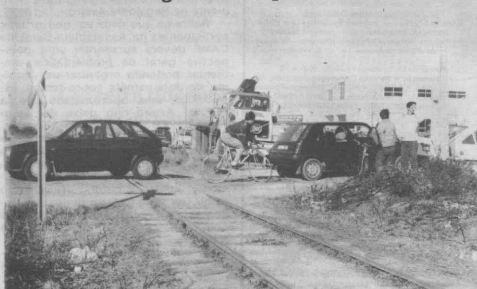
A passagem de nível na Rua das Cardadeiras, em Esgueira onde ocorreram já vários acidentes. A CP não quer saber disso!

— Ofícios e solicitações da Junta de Freguesia vão para o caixote do lixo