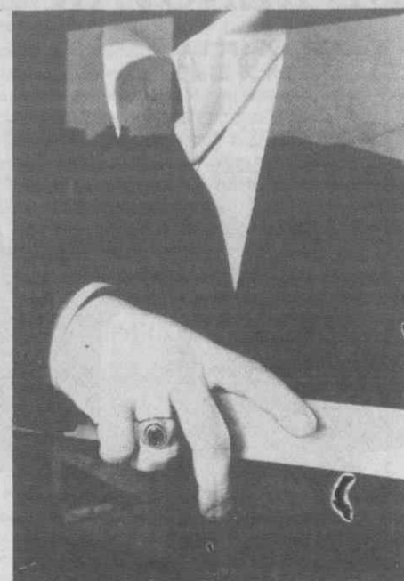
O norte-americano Ralph Gibson expõe no Centro de Arte de S. João da Madeira 40 fotografias.

Composto e Impresso na FIG — Fotocomposição e Industrias Gráficas, SARL — Estrada de Erras — Coimbra. Telefones 33312 e 35265. Telex 52154.