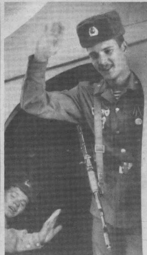
KABUL — Dois militares soviéticos acenam do interior do avião que os leva de regresso à União Soviética.

No Centro de Arte de S. João da Madeira RALPH GIBSON EXPÕE FOTOGRAFIA