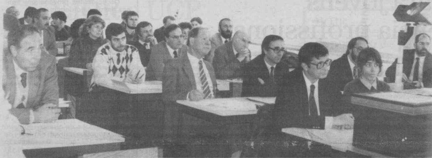
Aspecto dos participantes do curso que termina hoje no CIFOP da Universidade de Aveiro.

-DIÁRIO DE AVEIRO- AE Biblioteca Municipal Praça da República 3800 AVEIRO