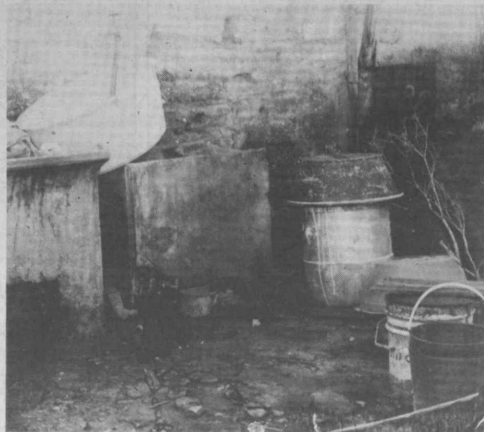
Tanques para lavar a roupa e, ao lado, o «quarto de banho», constituído por baldes onde são despejados os dejectos humanos.