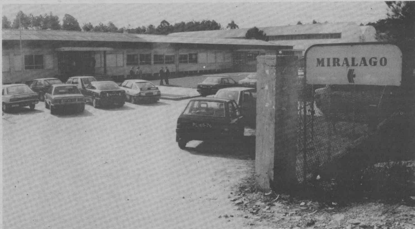
Um aspecto das instalações da Miralago, empresa que comemorou o seu 33.º aniversário.