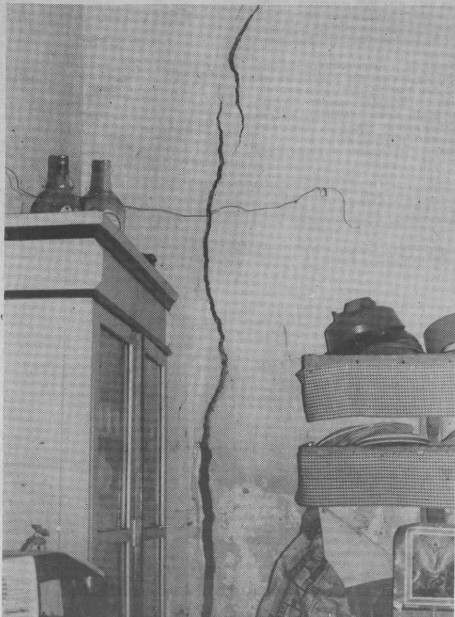
Uma brecha «enfeitada», de alto a baixo, uma das paredes da cozinha, cujo soalho é um «paraíso» de ratos.

Estes são, tão-só, dois casos existentes na Rua do Carril, entre muitos outros casos que ainda existem espalhados pelas ruas de Aveiro, de degradação e falta de condições habitacionais condignas.