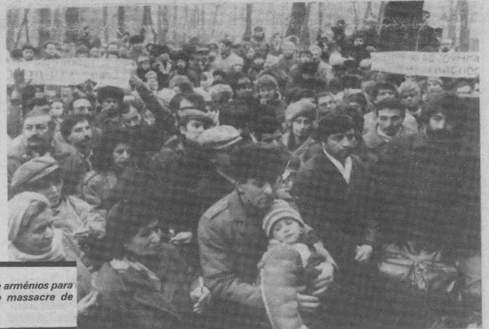
MOSCOVO — Manifestação de arménios para celebrarem o aniversário do massacre de Sumgait.