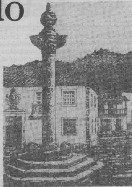
O pelouro de Arouca, monumento nacional desde 1933, que a Edilidade pretende recuperar.

Refira-se, por último, que em virtude do abandono a que tem sido votado, vai ser necessário executar novas peças em granito, no sentido de ser recuperada a sua forma original, cuja execução está em fase de concurso limitado.