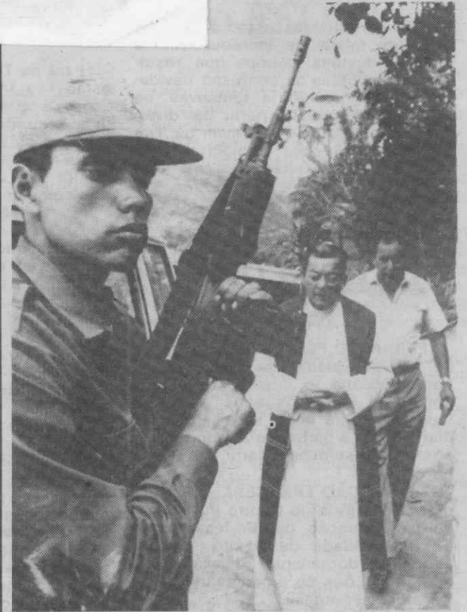
SASAIMA (Colômbia) — Um padre apresta-se para confortar uma pessoa ferida na sequência de uma batalha campal entre traficantes de droga que provocou a morte de 2 pessoas e 16 feridos.