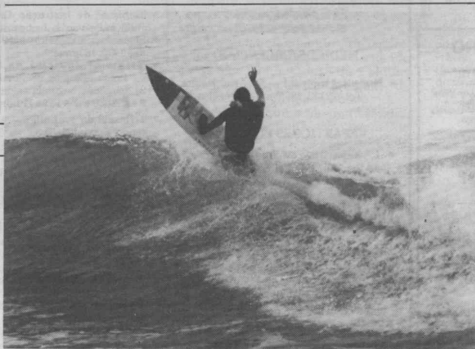
Surf: uma modalidade de rara beleza.