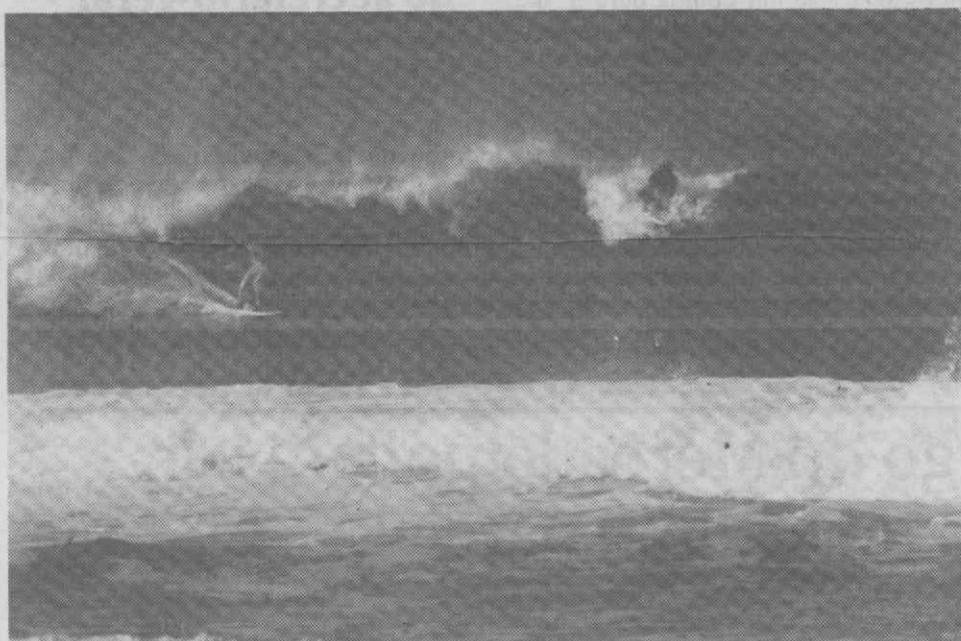
Em Setembro, belas imagens como esta, repetir-se-ão nas praias da Barra e Costa Nova.

mas de praticamente todo o mundo. Durante nove dias, a região estará debaixo do olhar atento dos «mass