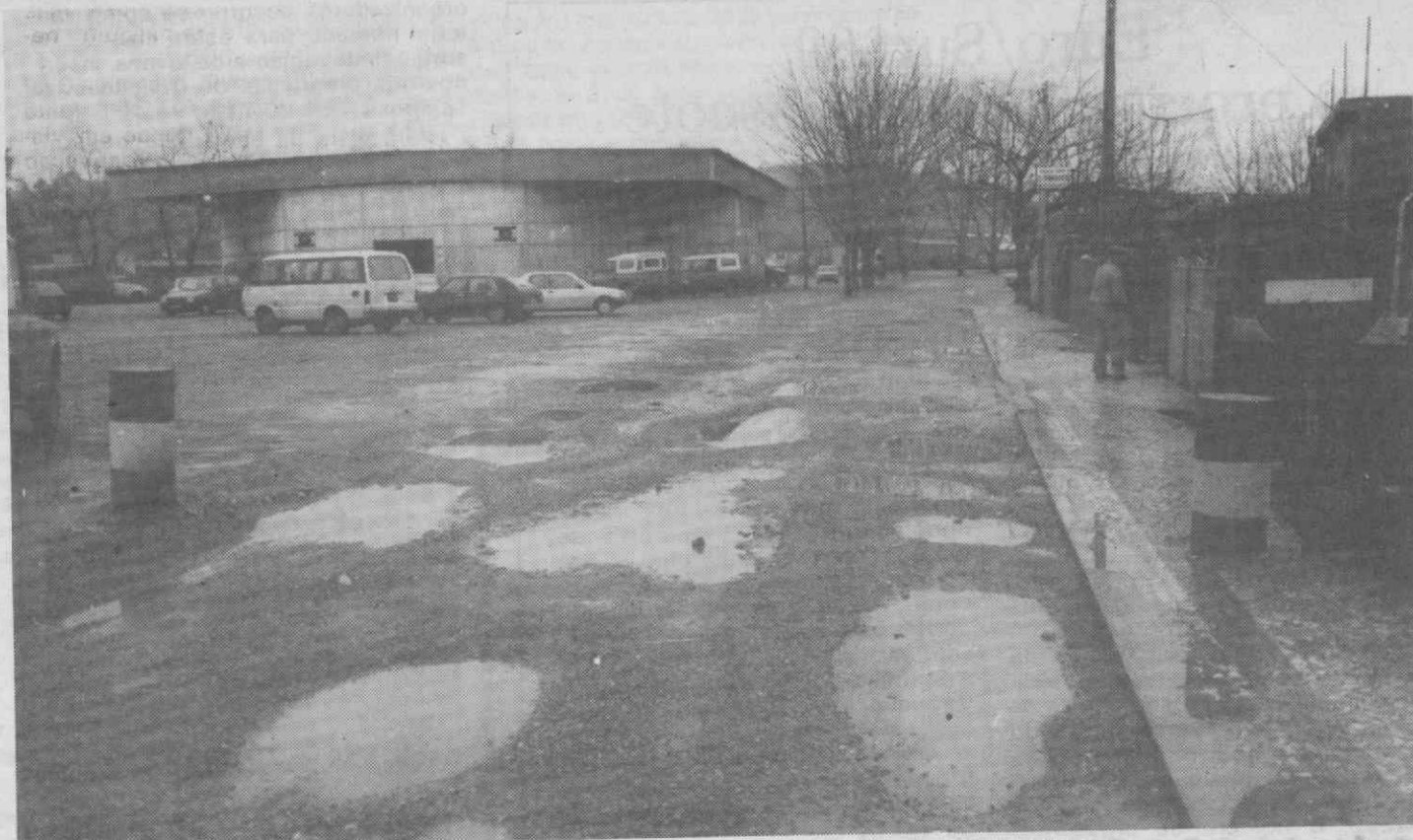
O tão necessário arranjo do Largo do Mercado poderá arrancar ainda esta semana.

Os serviços camarários, tentando minorar o problema, utilizaram areia e, depois, brita, para nivelar o pavimento. No entanto, ao contrário do pretendido, a situação piorou, com a agravante de ter impedido um eficiente escoamento das águas pluviais.