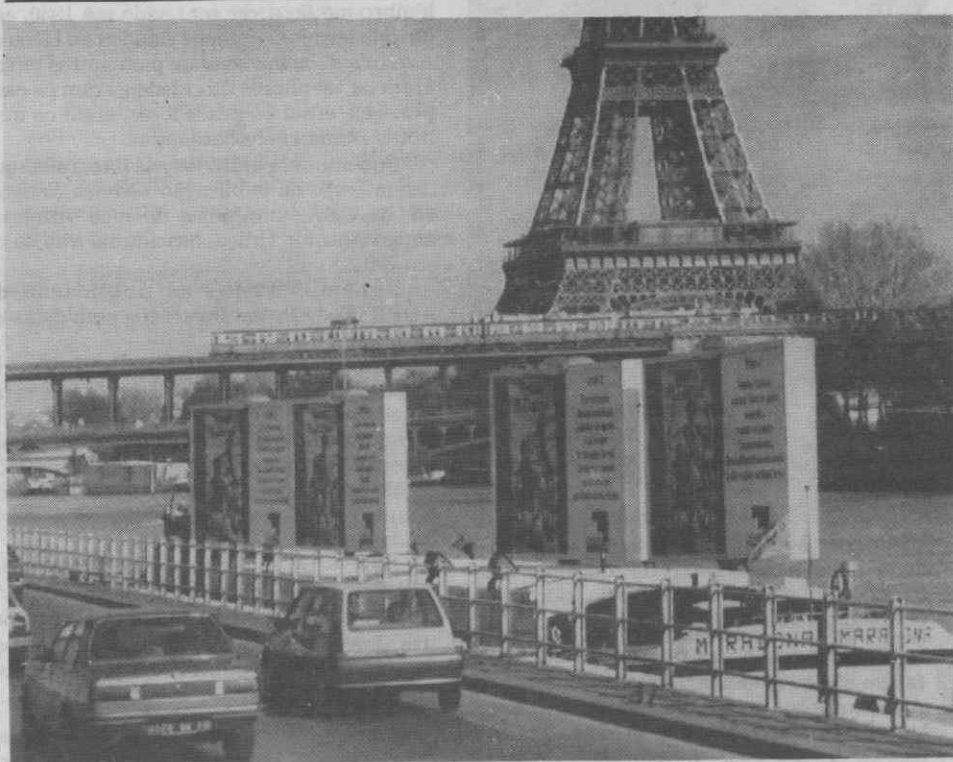
PARIS — Aspecto de vários placards, colocados em barcas ancoradas ao longo do Rio Sena, e que têm provocado protestos e acusações de deterioração do ambiente.