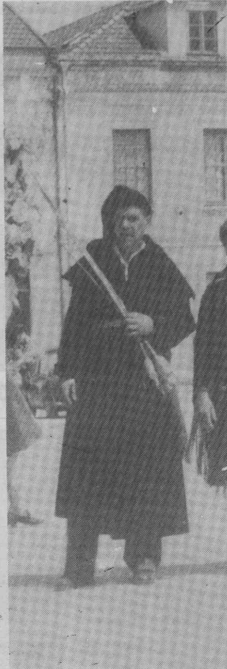
«Gabão de Aveiro» nasceu na região da Ria e daqui irradiou para todos os concelhos limítrofes e foi até ao Tejo, tendo sido visto também no Douro.

Comprovam-nos as referências que a ele fazem não só Almeida Garrett como também António Nobre no seu livro «Só»: numa longa poesia intitulada «Viagens na Minha Terra» e escrita em Paris no ano de 1892, descreve «uma jornada ao velho Douro» tendo por companheiros de viagem alguns homens de gabões.