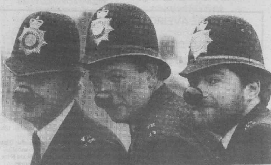
Milhões de britânicos, confirmando a tendência para a excentricidade que lhes é atribuída, usaram ontem «narizes vermelhos» de plástico para recolha de fundos com fins de caridade. Os narizes, mais vulgarmente vistos nos palhaços dos circos, custam 50 «pence» (cerca de 130 escudos) cada e encontravam-se à venda em lojas espalhadas por todo o Reino Unido. Os condutores que o desejavam podiam também adquirir um «nariz vermelho» para o seu carro, por uma libra (cerca de 260 escudos). Na foto, três polícias usando o espectacular «adereço».