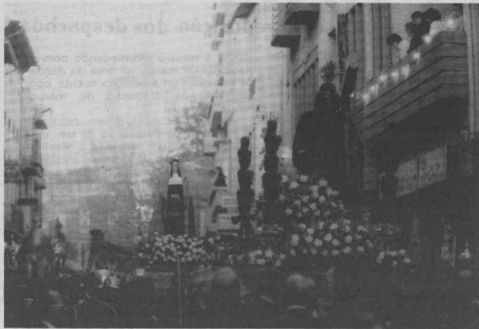
A procissão já depois do «encontro»...