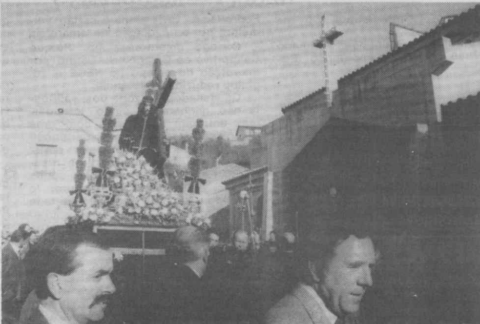
A imagem do Senhor dos Passos quando saía da Capela de Assequins.

As comemorações encerram com um jantar de confraternização, a realizar no salão de convívio do GICA, ao qual estarão presentes várias individualidades da região.