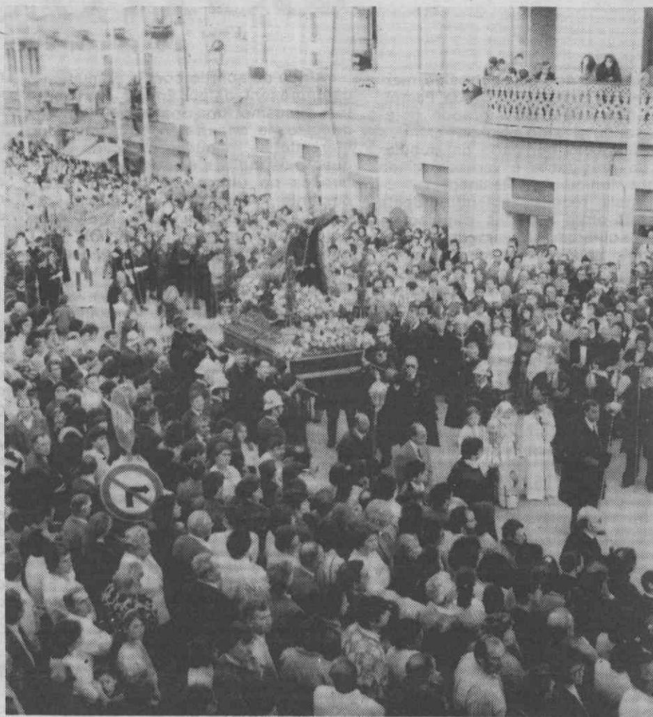
As ruas de Águeda foram pequenas...

verdadeiro mar de gente aguardava as procissões.