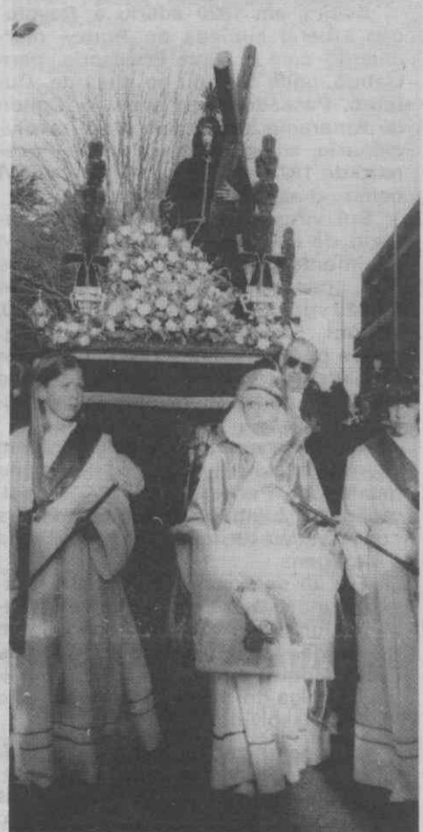
Águeda reviveu no passado fim-de-semana a celebração dos Passos, tradição que remonta ao século XVII.