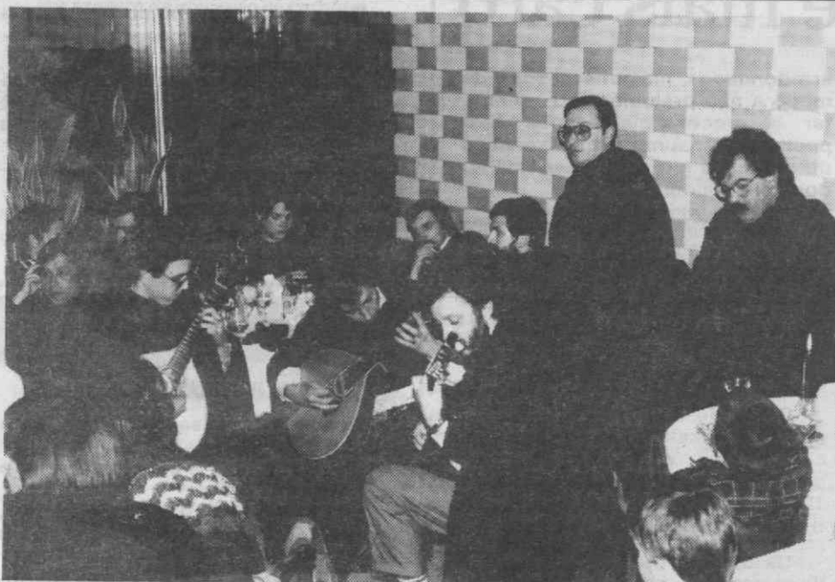
O fado de Coimbra marcou, uma vez mais, encontro na cidade de Aveiro. Não falhou e agradou!...

Interessada e participativa, que encheu por completo a Sala do Restaurante Centenário.