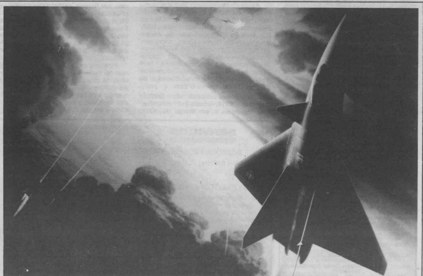
BURBANK, Califórnia — Depois de atingir o alvo, o piloto do caça F-22, à direita, lança-se numa subida quase na vertical, enquanto o seu companheiro de esquadrilha, à esquerda, dispara contra o inimigo, neste cenário de uma batalha futura. Ambas as aeronaves representam avançadas tecnologias da aviação de caça incorporadas no F-22, o candidato desta empresa para o fornecimento do novo caça táctico avançado da Força Aérea dos Estados Unidos. Possibilidade de atingir um alvo situado para além do alcance visual, elevada facilidade de manobra e capacidade para aniquilar o inimigo à primeira constituem algumas das características do F-22 que a Lockheed Aeronautical Systems Company está a construir em colaboração com as companhias Boeing Advanced Systems Company e General Dynamics-Fort Worth Division.