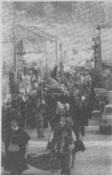
Um aspecto da procissão do Encontro.

Se eram muitas as pessoas que se encontravam ao longo das estradas de Assequins e de Paredes, na «baixa» citadina, nomeadamente na Praça Conde de Águeda e nas ruas Fernando Caldeira e Luis de Camões, um