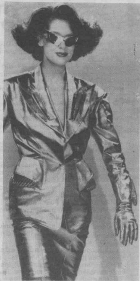
PARIS — Moda Outono/Inverno — apresentação de modelos do costureiro Christian Lacroix.