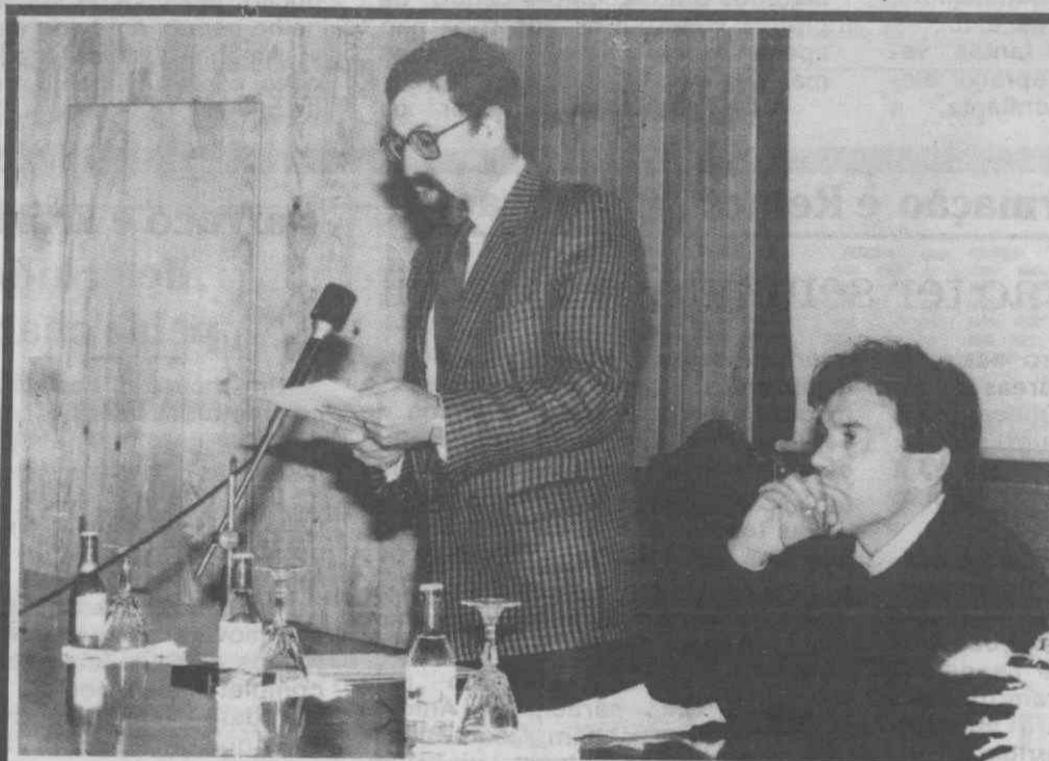
Numa iniciativa da ARS de Aveiro, técnicos do Grupo Coordenador do Projecto Vida estiveram em Aveiro, a fim de divulgar o referido Projecto e estudar formas de o implementar nesta zona.