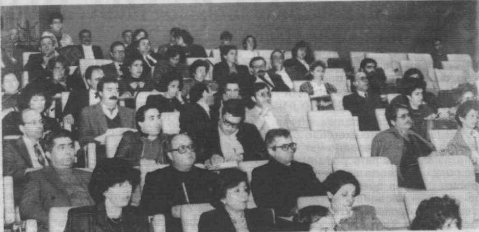
Na reunião de trabalho participaram diversas pessoas de algum modo ligadas à prevenção, tratamento e combate à toxicodependência.

blemas ligados ao uso/abuso de drogas, destinados aos profissionais da comunicação social.