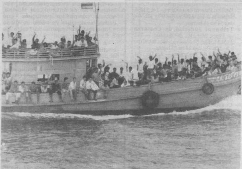
TRAT (Tailândia) — Diversas pessoas a bordo de um barco de pesca mostram a sua satisfação após terem terminado uma viagem de Phnom Penh.