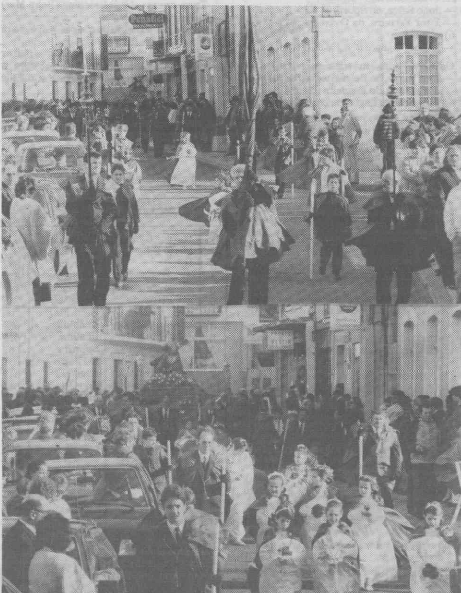
Grande número de fiéis integraram a procissão do Senhor dos Passos que, ao fim da tarde do passado domingo, percorreu as ruas da freguesia da Glória, em Aveiro. A procissão, organizada pela Confraria do Senhor Jesus dos Passos da freguesia da Glória, contou com o acompanhamento musical das bandas Amizade e Angejense.