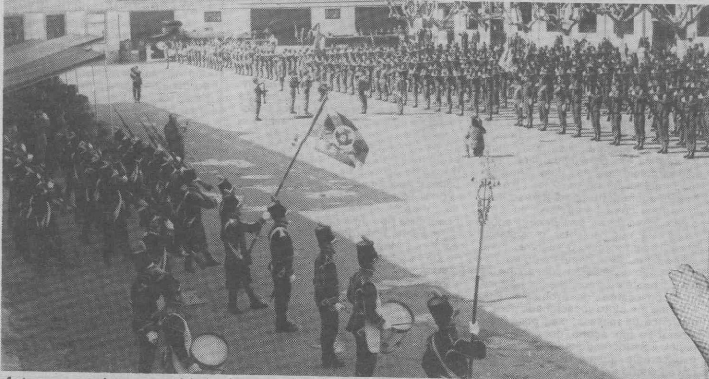
As tropas em parada prestam continência ao Estandarte Nacional.