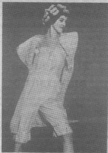
MUNIQUE — Moda — Um modelo vanguardista de roupa interior para avós.