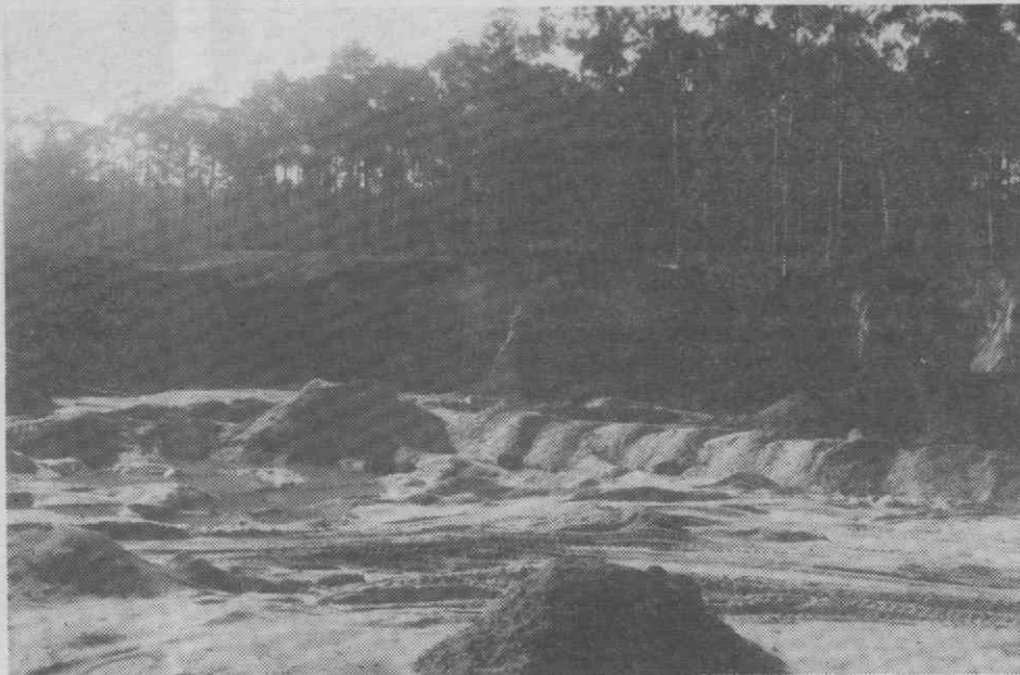
Um dos locais de maior extracção de areias.

A Nordeste — estrada Ílhavo-Salgueiro, desde o cruzamento com a estrada Vale de