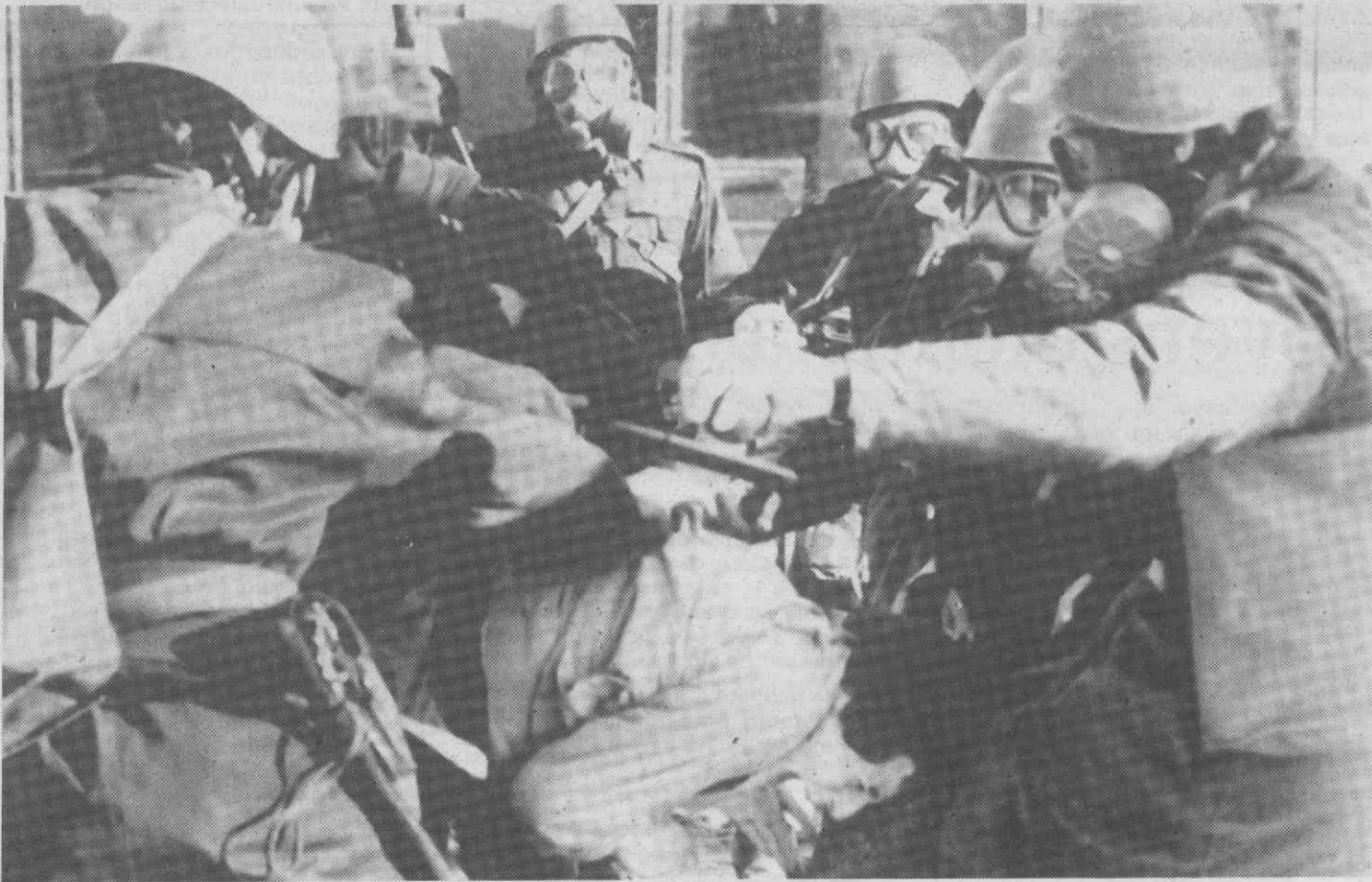
PRISTINA — Polícia de choque carrega sobre manifestantes albaneses.

Vinte e um mortos — dois polícias e 19 manifestantes — é o saldo oficial de dois dias de confrontos violentos registados na província autónoma jugoslava de Kosovo, anunciou ontem o Ministério Federal do Interior.