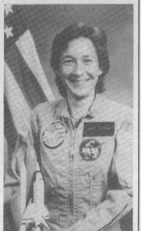
CENTRO ESPACIAL HOUSTON (Texas) — Mary Cleave, a primeira astronauta a participar num voo do vaivém após a explosão do «Challenger».