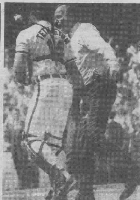
O Presidente norte-americano, George Bush, é, ao que parece, um grande entusiasta do baseball. Aqui o vemos, quando se aprestava para dar início oficial ao jogo Red Sox-Oriole, que marcou a abertura da época da Liga americana de Baseball.