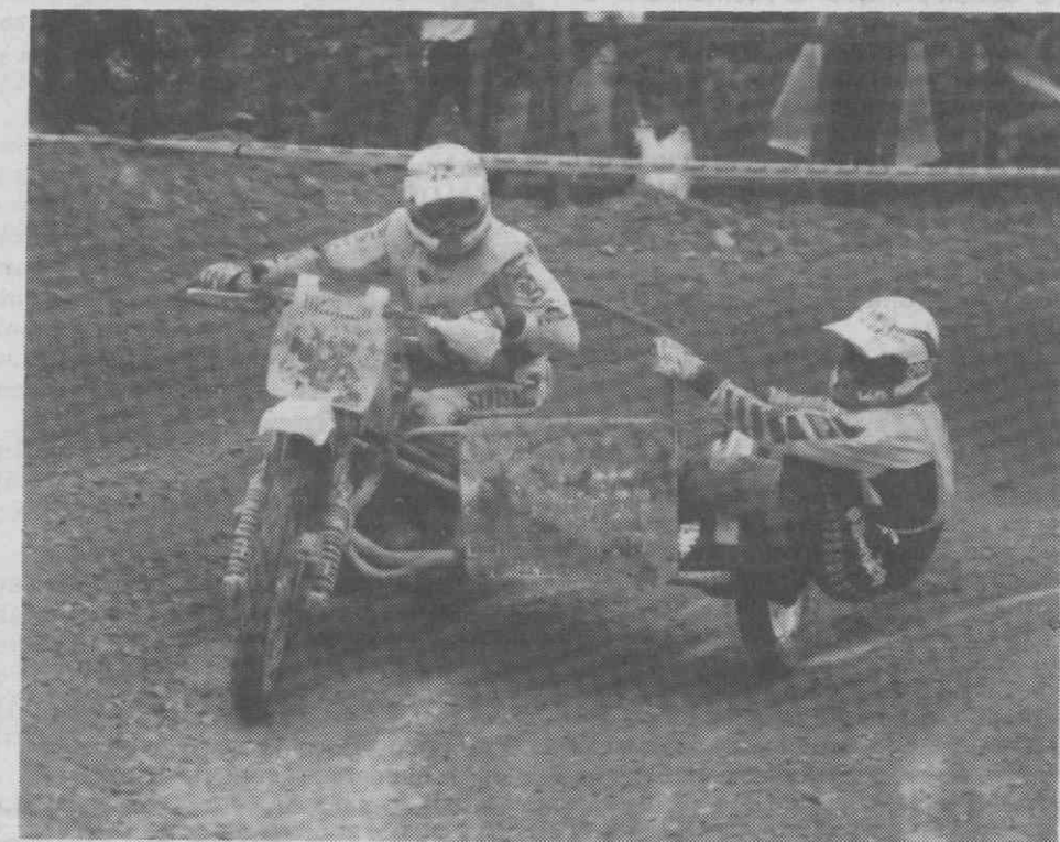
A espectacularidade do side-car cross vai regressar a Águeda.

A anteceder o encontro (14.30 horas), terá lugar uma largada de paraquedistas. De referir que, para que esta realização fosse possível, a Rádio