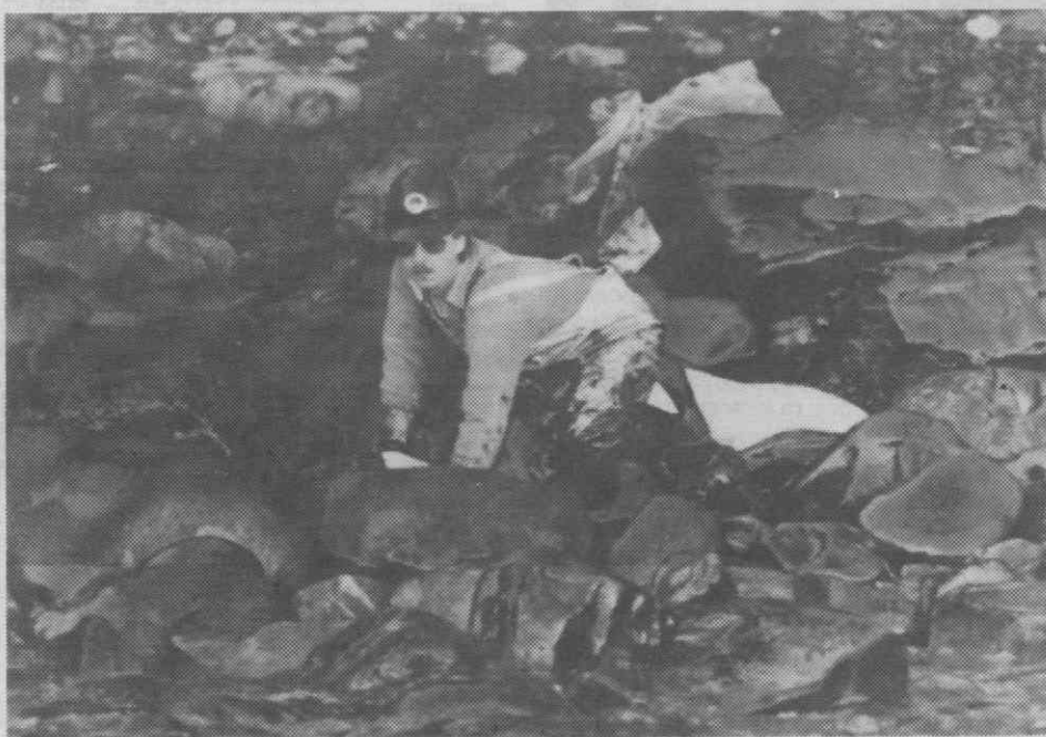
VALDEZ (Alasca) — Elementos das equipas de limpeza numa praia coberta de petróleo derramado pelo petroleiro da Exxon.

Os interessados podem obter mais informações e solicitar o Regulamento nos Serviços Regionais do Instituto da Juventude, em Aveiro, na Av. 25 de Abril, 24 - r/c; ou pelo telefone 28625