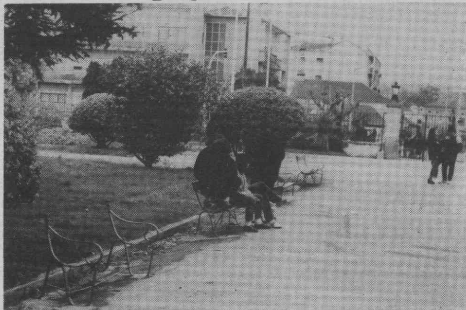
Na Escola Secundária José Estêvão, os bancos existentes não servem as necessidades. E isto porque uma boa percentagem se encontra no estado que a foto documenta. Porquê? De quem é a culpa? Por que não se arranjam? São perguntas que alunos — e alguns professores — gostariam de ver respondidas.