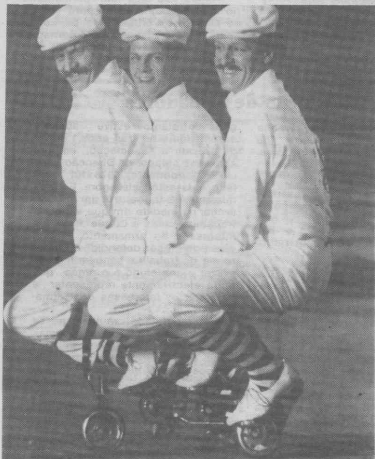
ZURIQUE — A mais pequena bicicleta de três lugares do mundo, suportando três pessoas.

O Tribunal Constitucional baseia a inconstitucionalidade na violação dos preceitos da Constituição sobre «portugueses no estrangeiro», «participação na vida pública» e «princípios gerais de direito eleitoral».