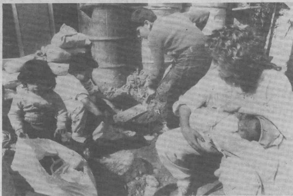
BEIRUTE — Crianças enchem sacos de areia para defesa do lar enquanto a mãe pega no irmão bebé. Combates entre milícias rivais já fizeram mais de 120 mortos e centenas de feridos.

No país de Diouf e de Wade, a revolução é impossível, o diálogo entrou no impasse. Seis milhões e meio de senegaleses esperam que alguém restitua a confiança à Nação e volte a pôr toda a gente a trabalhar.