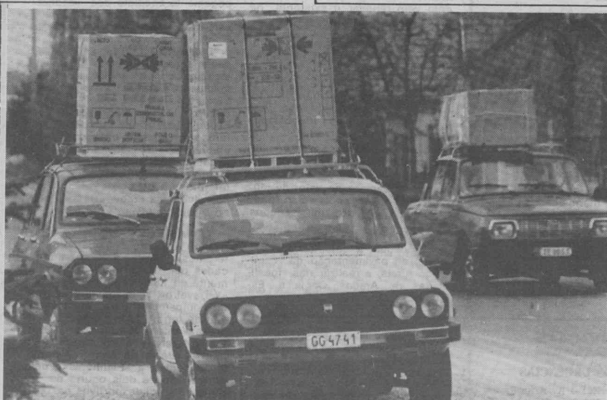
FRONTEIRA AUSTRO-HÚNGARA — Automóveis húngaros transportam caixa de electrodomésticos adquiridos na Áustria aproveitando os últimos dias antes da entrada em vigor de novas taxas de importação.