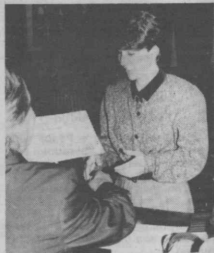
O curso vai permitir que 22 jovens encarem o futuro com maior confiança.