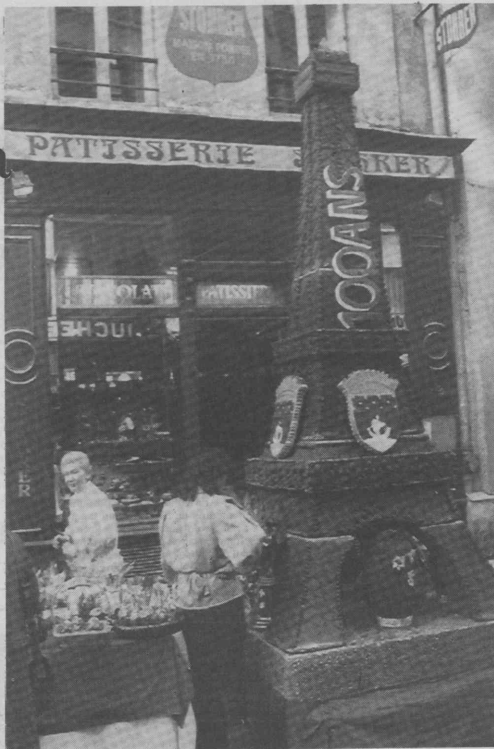
PARIS — Torre Eiffel com cinco metros feita em chocolate para comemorar a Páscoa e o centenário da Velha Senhora.

Um acordo foi enfim concluído em 1903 e o Exército francês começou desde logo a montar no último andar da Torre Eiffel, um centro de transmissões que imediatamente deu as suas provas: as ligações com o Leste