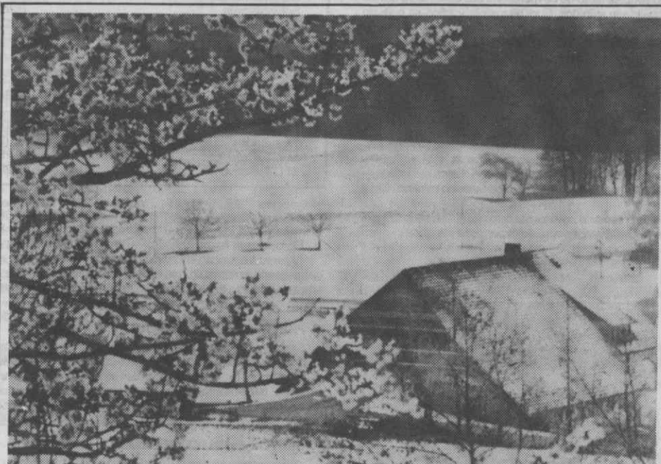
AS APARÊNCIAS ILUDEM — Embora não pareça é: a Floresta Negra; embora pareça não é uma amendoeira em flor mas sim uma árvore coberta de neve; embora não pareça a foto foi tirada num dia de Primavera!

O défice de arroz do Laos, que conta com 3.940.000 habitantes, está calculado em 176.500 toneladas.