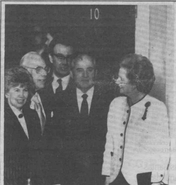
LONDRES — O casal Gorbachov posa para os repórteres ao lado do casal Thatcher à porta do n.º 10 de Downing Street.