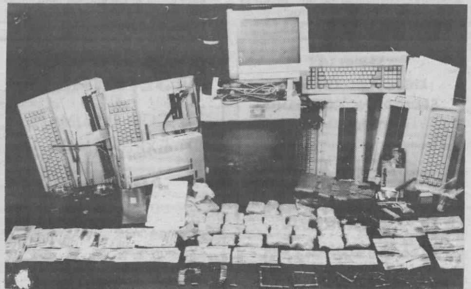
O material apreendido pela Judiciária (heroína, armas, dinheiro, etc.).

Os detidos foram apresentados ao juiz de Instrução Criminal, que validou e manteve a prisão.