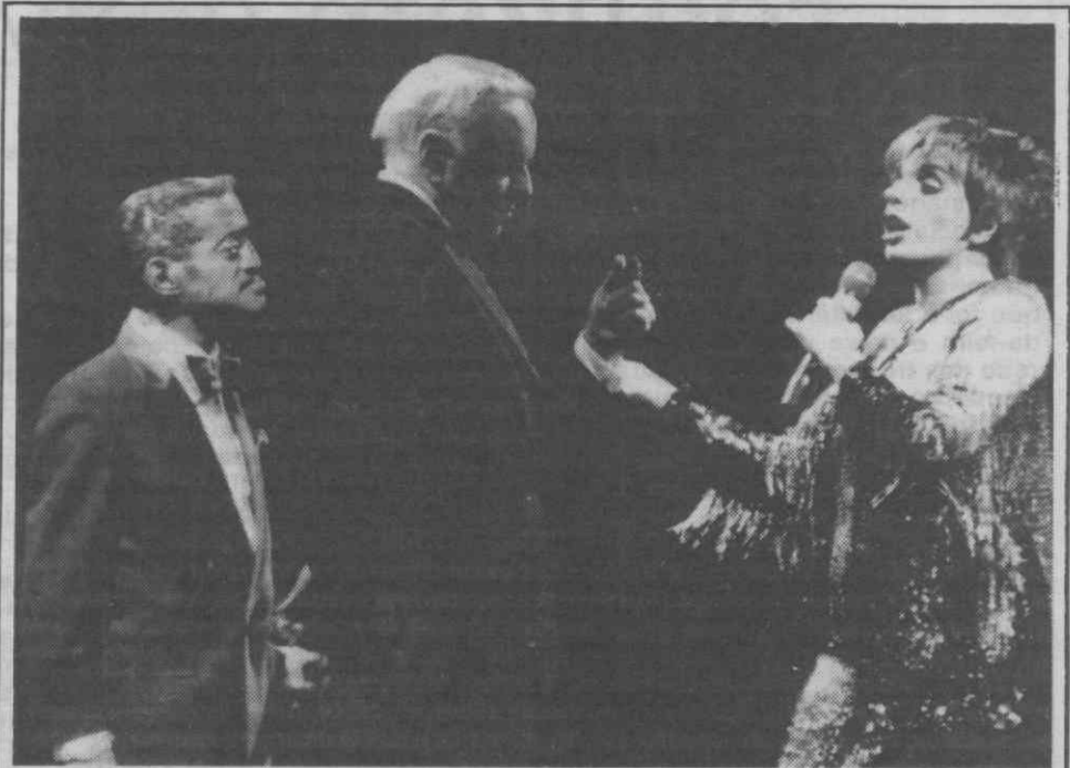
MILÃO — Sammy Davis Jr., Frank Sinatra e Liza Minnelli actuam durante um concerto conjunto na noite de quinta-feira em Milão.