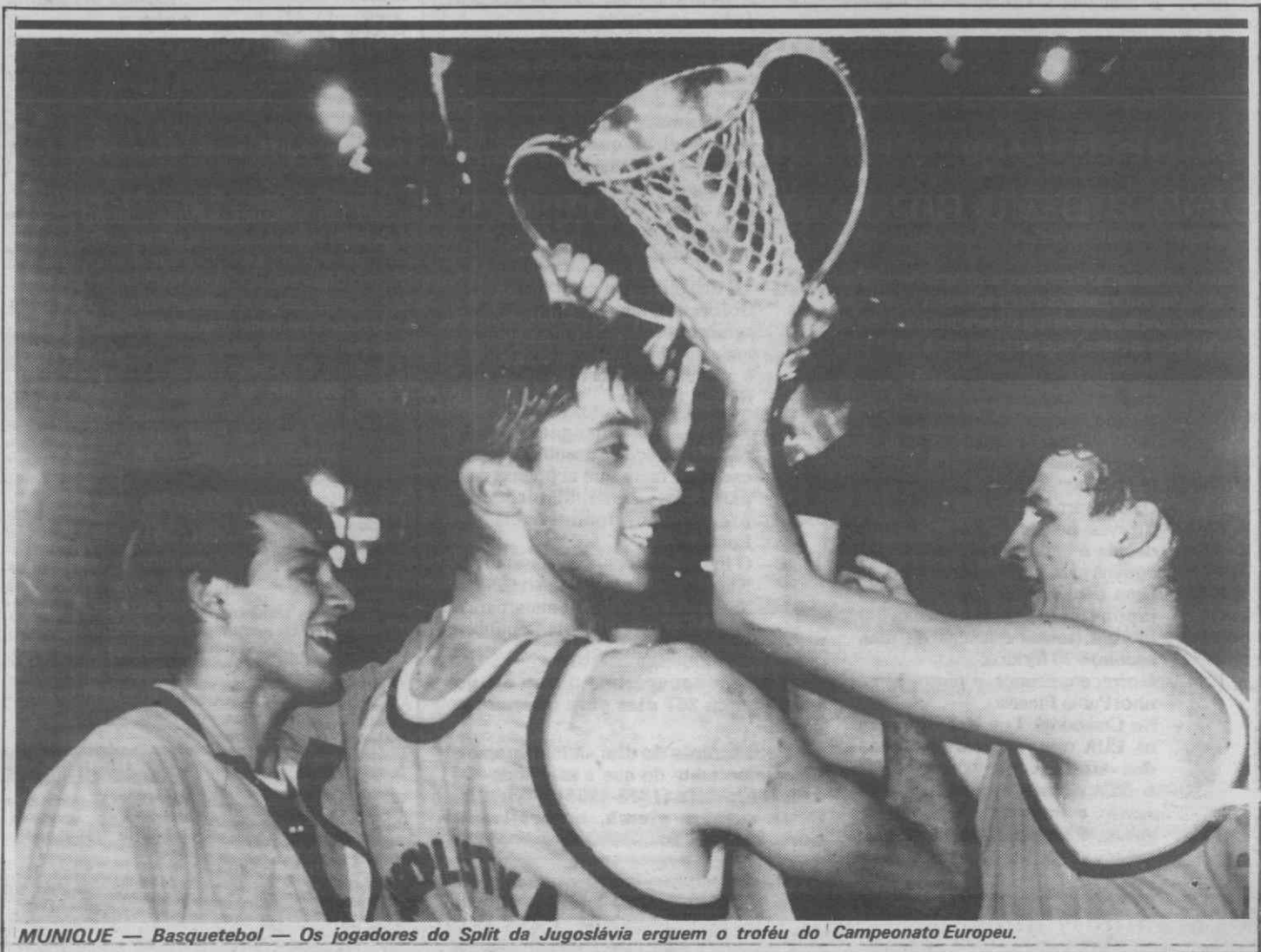
MUNIQUE — Basquetebol — Os jogadores do Split da Jugoslávia erguem o troféu do Campeonato Europeu.