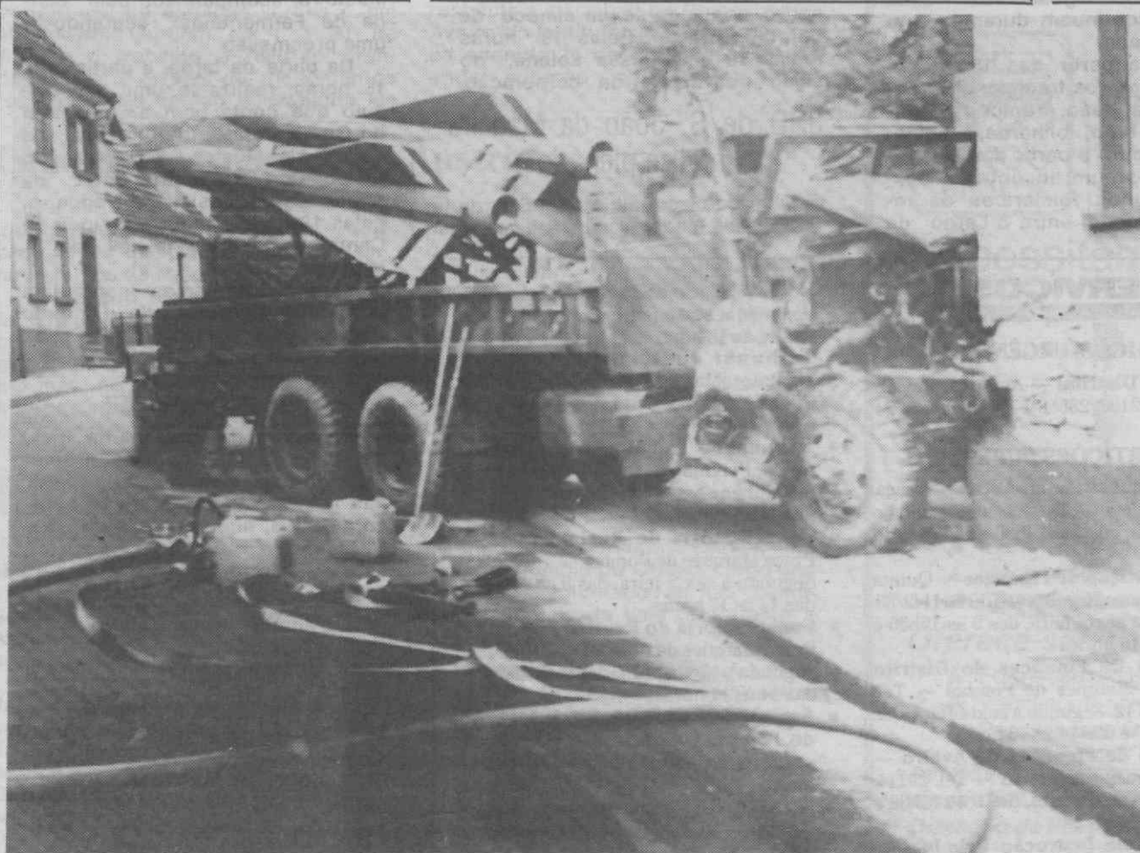
WEILERBACH (RFA) — Um camião militar norte-americano que transportava dois mísseis «Hawk», após ter-se despistado devido à falha nos travões.