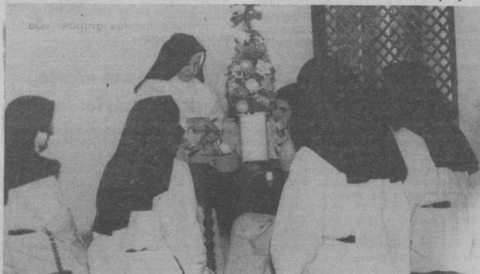
Com habilidade e mestria fazem-se flores para a Festa de St.ª Joana que rapidamente se aproxima.

do à disposição da Junta para a viagem pela Auto-Viação Aveirense, passará pela Batalha, Nazaré, Figueira da Foz, Mira e Aveiro, para terminar o seu percurso em Eixo. Este passeio (gratuito) que contou com uma forte adesão entre os mais velhos da freguesia, realiza-se no âmbito de um projecto da Junta de Freguesia que pretende, designadamente durante o período de Verão, desenvolver iniciativas desta natureza, contemplando, sobretudo, as praias.