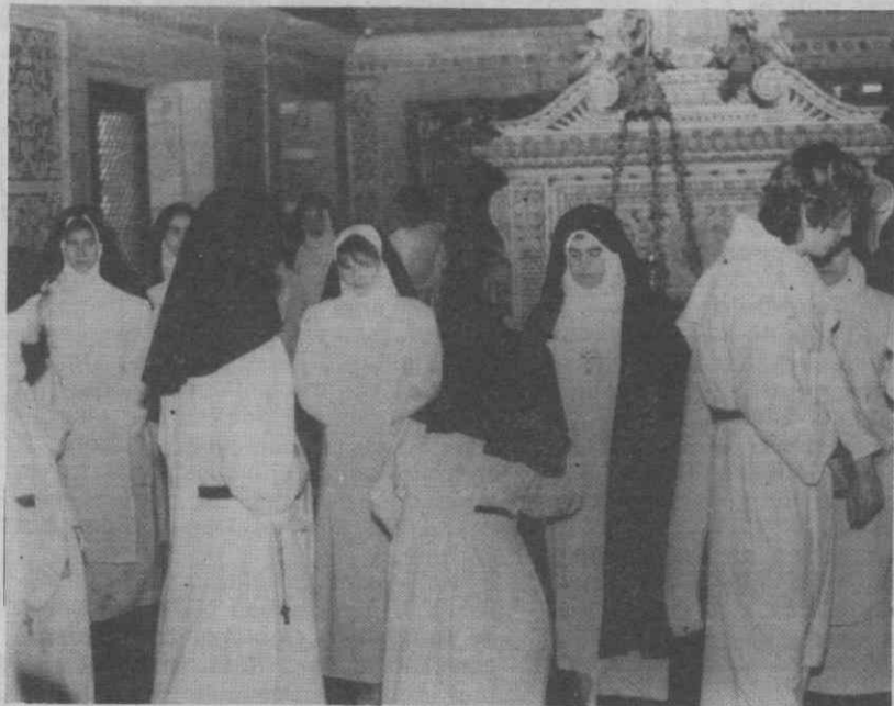
A visita ao túmulo da Princesa St.ª Joana foi a primeira etapa desta viagem no tempo até ao séc. XVIII.

Envergando vestes de peregrinos, o repórter e o fotógrafo, acompanharam os monges e as freiras nas suas actividades, sentiram o seu empenho