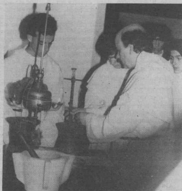
Um grupo laborioso dedica-se à preparação de medicamentos recriando um cenário habitual de 1780.

Imaginação transformou alunos da José Estevão em monges e freiras do século XVIII