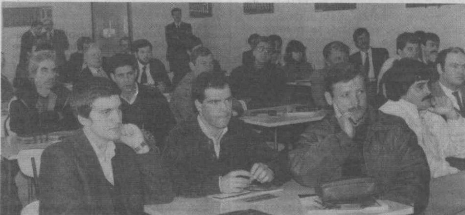
Um aspecto da assistência às I Jornadas Técnicas.