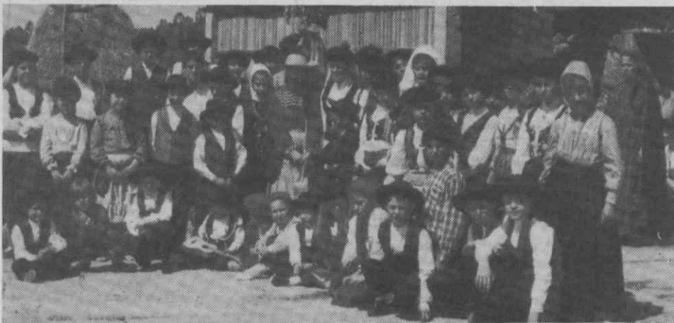
O Cancioneiro Infantil vai actuar no Canadá.

O Grupo Típico «O Cancioneiro Infantil de Águeda» poderá deslocar-se em breve ao Canadá, para representar Portugal no «Festival Folklorique des Enfants de Monde», tendo já sido convidado pela organização.