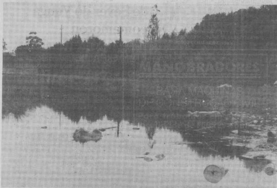
«Onde o sangue transforma a ria num nojento e pestilento lodaçal vermelho (cor que a foto a preto e branco atenua) que ultrapassa tudo aquilo que é possível imaginar em termos de degradação de património natural», falamos do Lago do Paraíso.

«Aveiro, janela aberta para a Europa, já sofre as arguras do «laissez faire» governamental, em relação à poluição industrial, agora é triste que seja o Estado a uncabeçar a degradação ambiental, colocando em sério risco a Saúde dos aveirenses, gente profundamente empenhada no progresso e no desenvolvimento do país, que teima em viver de costas voltadas para a Europa, onde se afirma que também pertencemos», conclui a Federação Distrital de Aveiro do Partido Socialista.