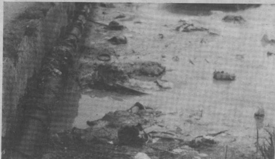
O desmazelo e a incúria é tão grande, que as zonas fronteiriças ao Matadouro se enchem, em dia de matança, de um líquido sanguinolento e repugnante, que escorre das suas instalações.

O problema ganha maior relevo com o aproximar da estação estival. Razão por si só justificativa de um alerta lançado pelo PS, à população, para que tome precaução no que concerne há propagação de doenças. Paralelamente, este órgão político