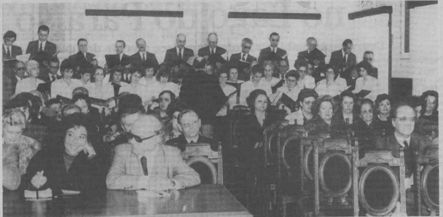
O Coral de Vera Cruz, durante a sua actuação.

A propósito deste intercâmbio, que se prevê contemple acções com jovens, entre as universidades e trocas de natureza comercial, Girão Pereira referiu contactos com a alcaide de Ciudad Rodrigo para a realização