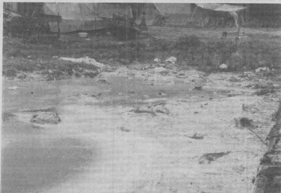
Lago do Paraíso: onde a miséria e a «morte» vivem lado a lado.