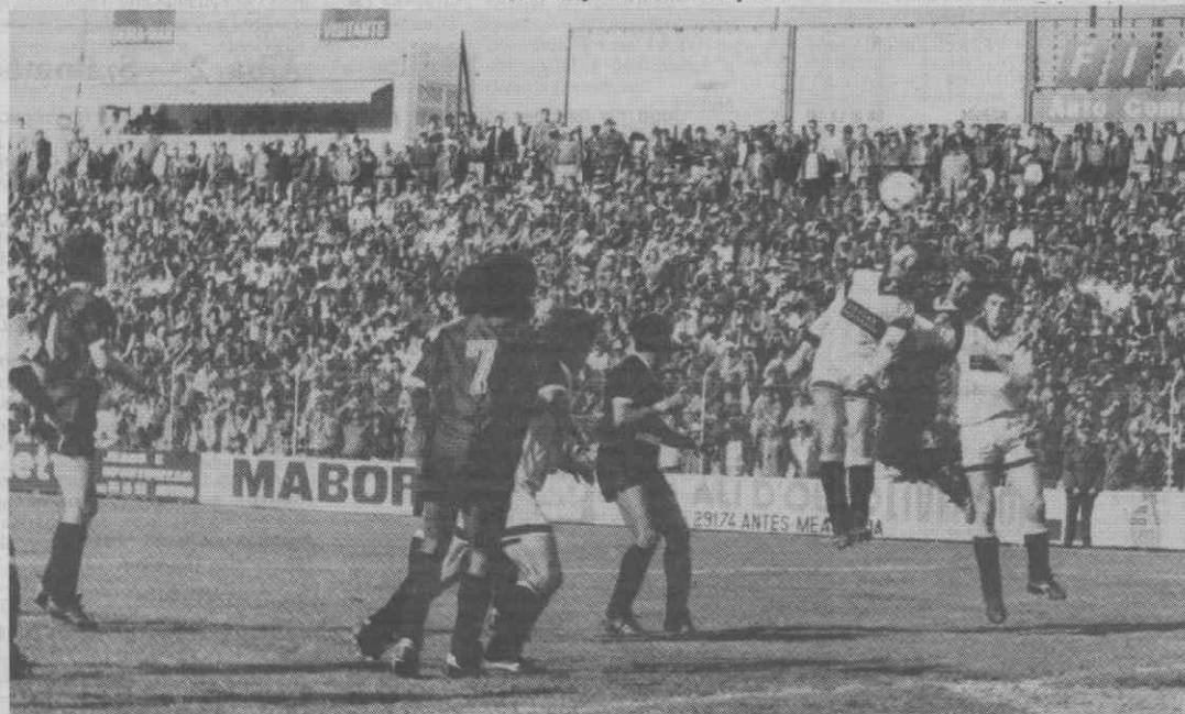
Aveirenses «todos» no ataque, mas a defesa fafense deu poucas hipóteses.

golo, numa altura em que o Beira Mar atacava mais e notava-se já um certo cansaço dos visitantes, aliás muito mal disfarçado.