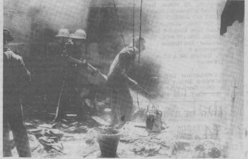
Os Bombeiros entram em fase de rescaldo cerca das 14 horas.