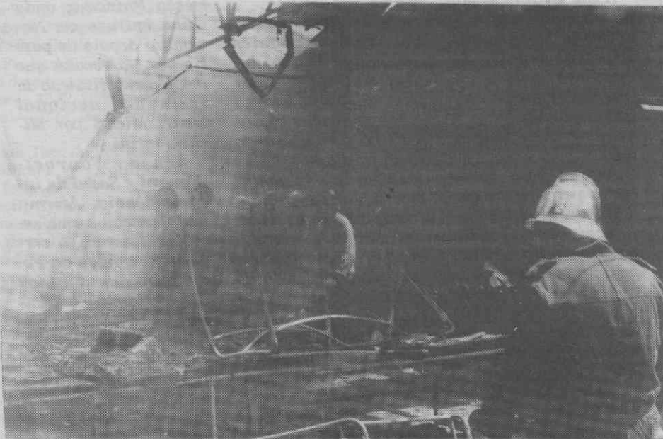
Os materiais altamente inflamáveis contribuíram para a rápida propagação das chamas.

As causas que estiveram na origem do sinistro não estão, ainda, totalmente esclarecidas.