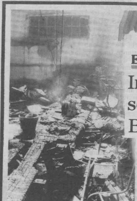
O cenário de destruição que as chamas provocaram.