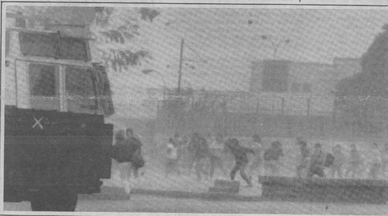
SANTIAGO — Manifestantes chilenos atiram pedras a um canhão de água durante a comemoração da execução de líderes esquerdistas sem julgamento em 1973.