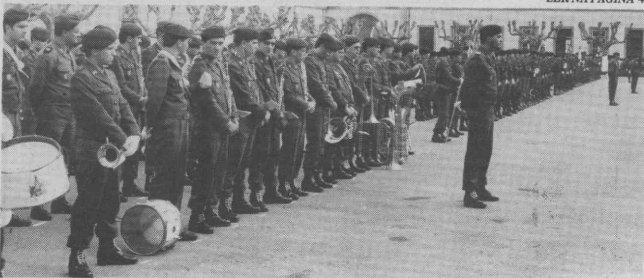
Dois companhias de instrução com mais de 300 soldados recrutas, aguardam agora colocação num outro quartel.

Concurso entre os leitores do Diário de Aveiro — Uma máquina de lavar no valor de 90 contos.