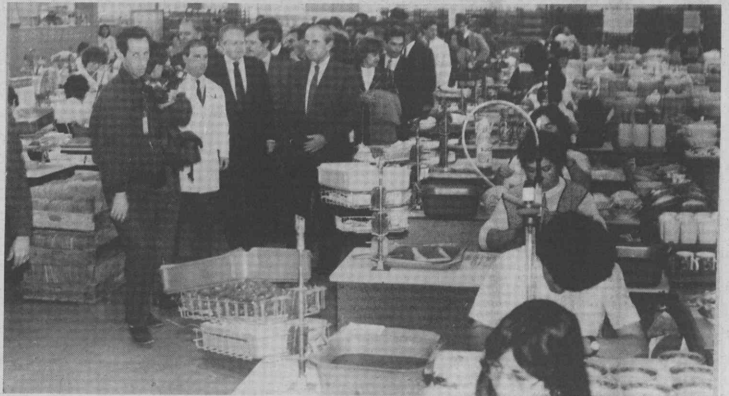
Aspecto geral da visita às instalações fabris.

como objectivos de desenvolvimento o privilegiar da qualidade, a criação, a liderança nos diversos aspectos de mercado, orientar a produção para as preferências do consumidor, melhorar o conhecimento do consumidor e privilegiar o lucro razoável a longo prazo, sobre o lucro oportunista a curto prazo.