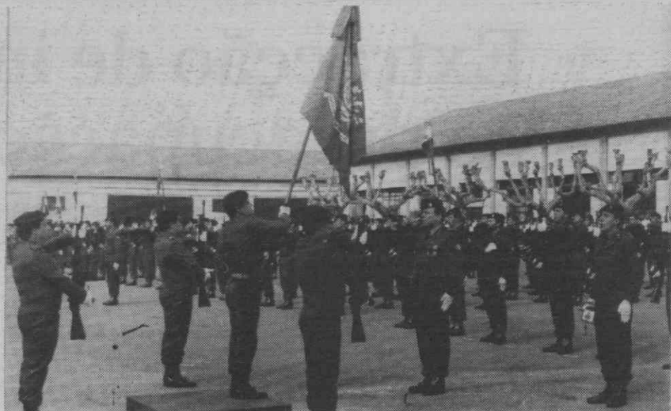
Apresentação do Estandarte Nacional foi um ponto alto da cerimónia.

Uma vez apresentado o «símbolo da Pátria», o Estandarte Nacional, e