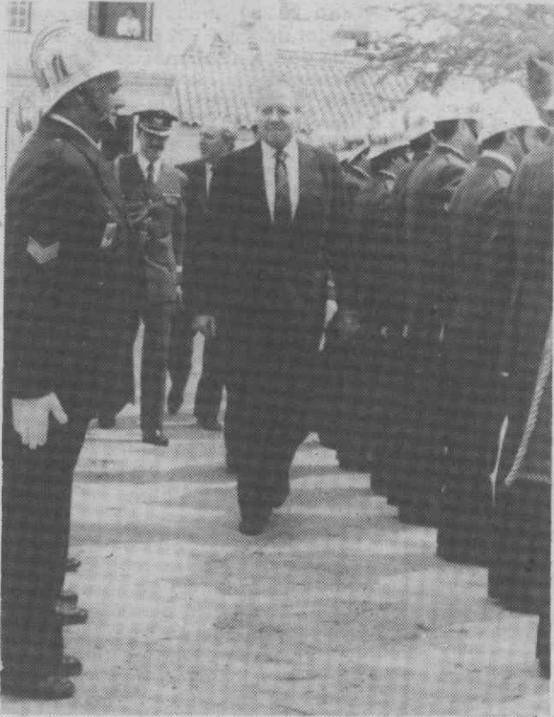
Mário Soares à sua chegada à Vista Alegre.