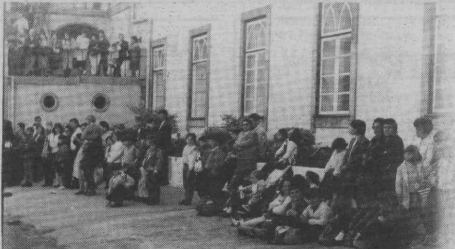
Dois classes com alunos das Escolas Primárias de Esmoriz e de Santa Joana (Aveiro) vieram «aprender» o que é o Juramento de Bandeira. Esta foi uma assistência inédita no BIA.