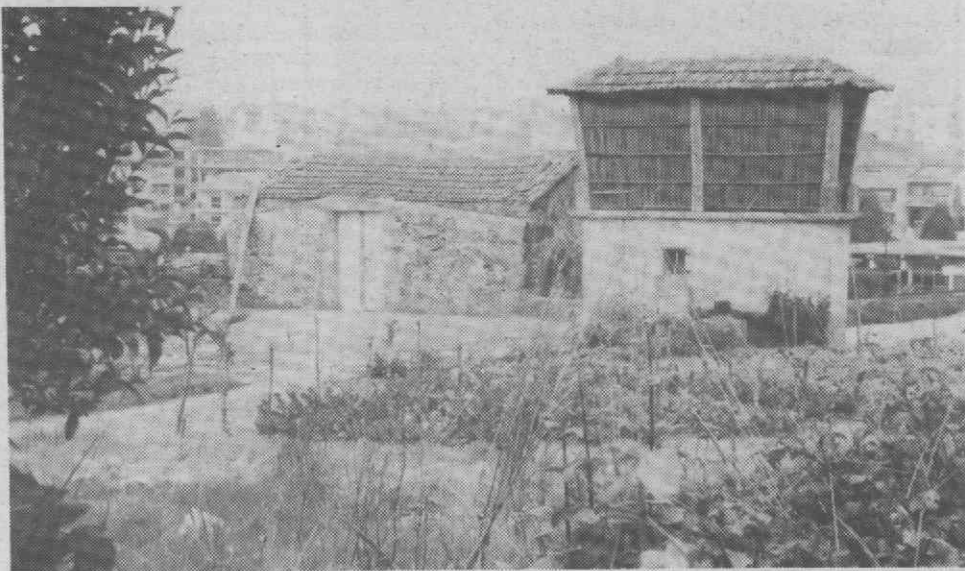
O típico «Espigueiro» que ainda se vai vendo aqui e além...

A noção concreta do tempo pressupõe a correcta noção do acontecimento, quer durante a ocorrência quer durante o que antecede, prevenindo ou imaginando a ocorrência. A postecipação por seu lado, ao prever ou imaginar o futuro, tendo em conta as implicações futuras do que acontece face ao conhecimento ora desconhecido, compete exclusivamente à imaginação. Essa imaginação só evolui sob a influência do conhecimento.