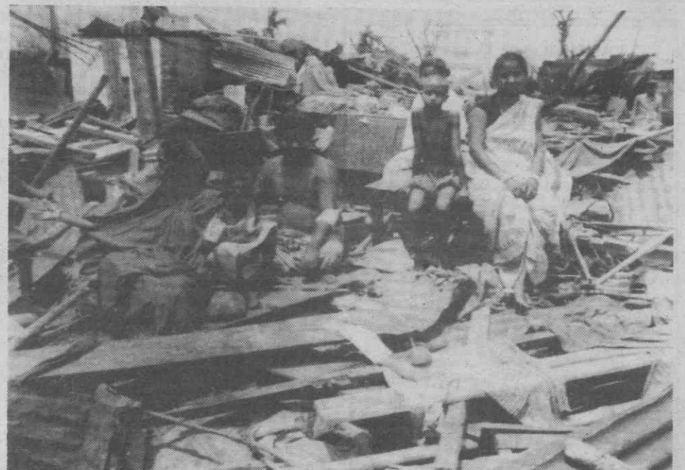
MANIKGANJ (Bangladesh) — Um homem, mulheres e crianças no meio dos destroços de uma das várias casas destruídas por um tornado. LER NA ÚLTIMA PÁGINA

Os distúrbios nas duas nações vizinhas na África Ocidental foram suscitados por um tiroteio fronteiriço sobre direitos de pastagens em 9 de Abril, mas foram alimentados pela tensão económica e racial subjacente.