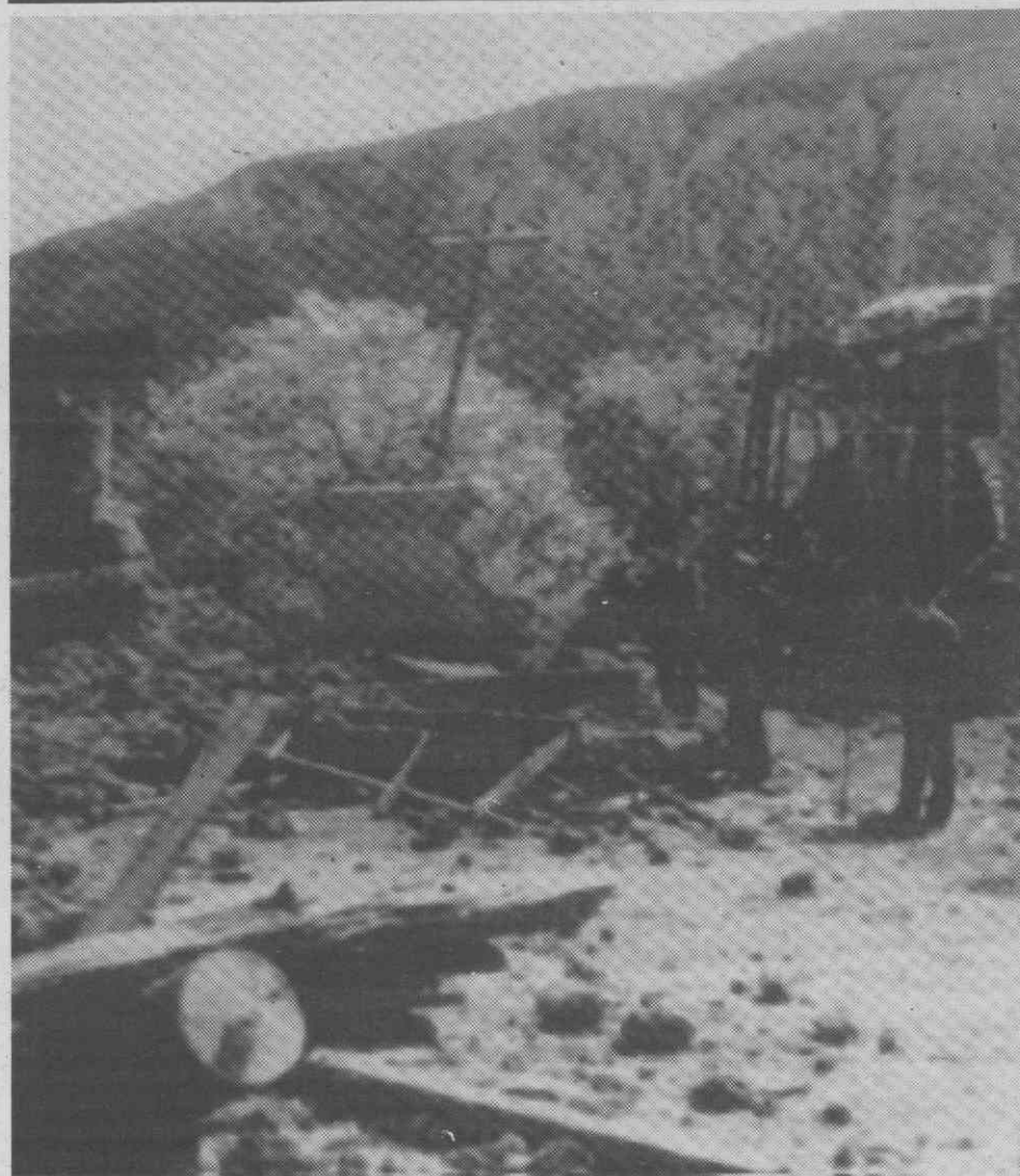
SICHUAN (China) — Destroços das casas provocados por um sismo que atingiu 6,7 graus na Escala de Richter.

A polícia e funcionários do Governo têm recusado comentar as notícias que afirmam que os extorsionários receberam aquele montante no início do ano e que agora exigem mais um milhão de libras (cerca de 265.000 contos).