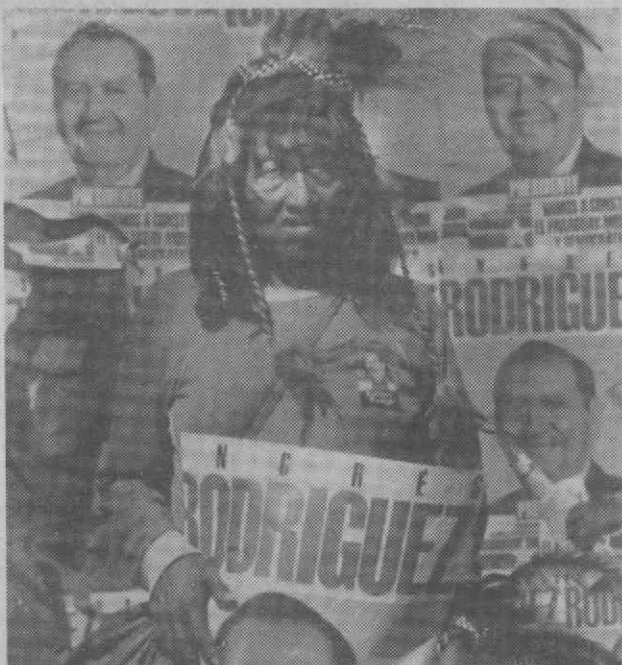
ASSUNÇÃO — Um índio «Maca» exhibe um cartaz eleitoral do Presidente Andres Rodriguez.