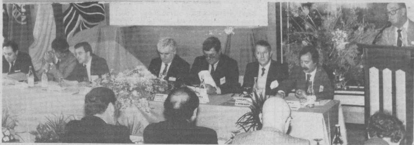
Defender o sector da pesca longínqua da concorrência desleal de países terceiros, em especial dos países de Leste, foi uma das razões que justificou a reunião de espanhóis e portugueses à mesma mesa. O processo promete continuar, numa próxima reunião, em Vigo.