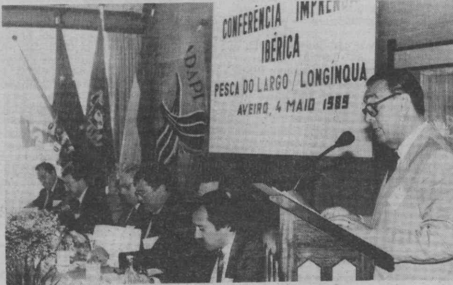
Uma vez ultrapassado o período de adaptação à Comunidade, urge agora tomar uma política séria no sector da pesca longinqua. Algo está mal. A praticarem um preço de primeira venda igual ao de 1986 e com uma frota pesqueira considerada a quarta no mundo, os armadores espanhóis e portugueses apelam à propagação da solidariedade social entre países comunitários. «Não temos culpa, nem podemos sofrer pelo facto dos outros países comunitários não terem grandes interesses na pesca longinqua». Portugal e Espanha têm-no.

Apesar de a Comunidade Europeia representar a quarta potência mundial pesqueira, a sua produção nunca foi suficiente para cobrir as necessidades do mercado interno. «A agravar esta situação é de referir «o abandono de acordos de pesca bilaterais, fundamentais para o sector, uma vez que não foram renovados por falta de vontade e de iniciativa suficiente pe-