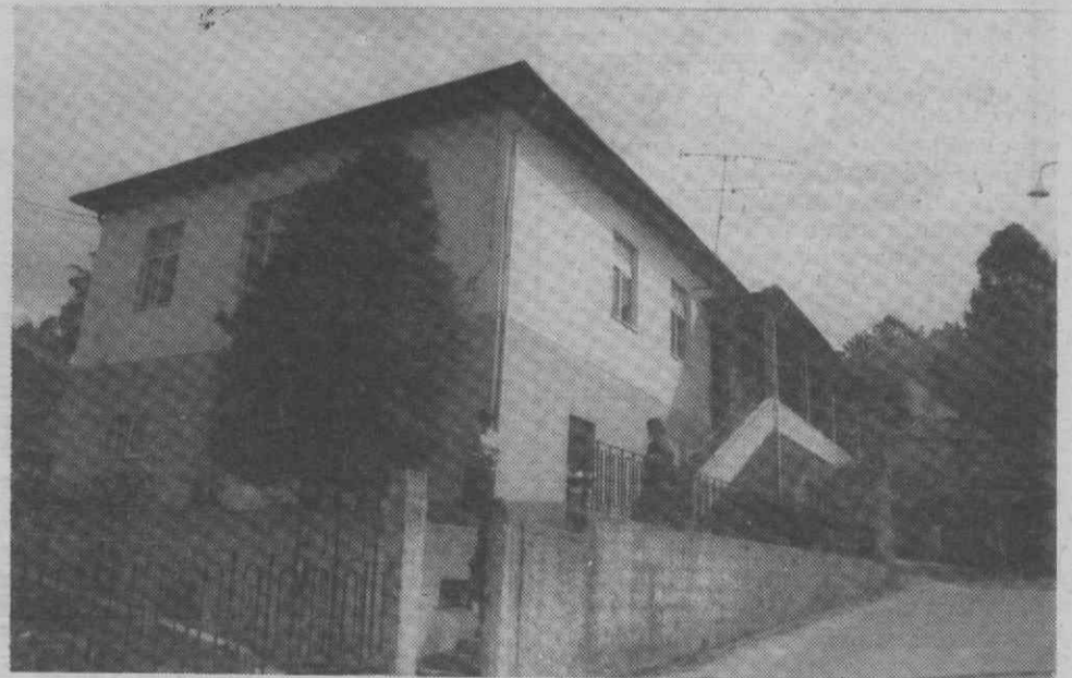
As instalações da CERCIAG: um mundo de carências que urge colmatar...

Nove modelos femininos, todos provenientes da região de Agueda, mostraram moda Primavera/Verão, desde os fatos de banho até aos vestidos de noite, passando pela «lingerie». Apesar da sua condição de amadores (à excepção de um -, os modelos souberam dar realce às propostas para o ano em curso da moda Primavera/Verão, tendo proporcionado um bom espectáculo aos presentes, que foram agraciados, ainda, com uma sessão de fados de Coimbra.