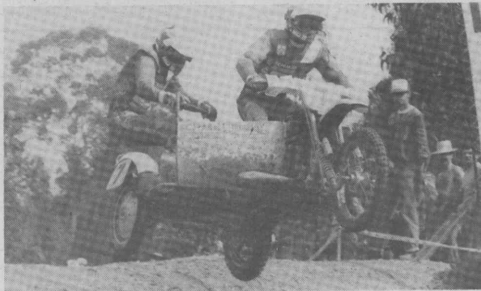
A dupla alemã Garhammer/Haas: um andamento espectacular... até à desistência.