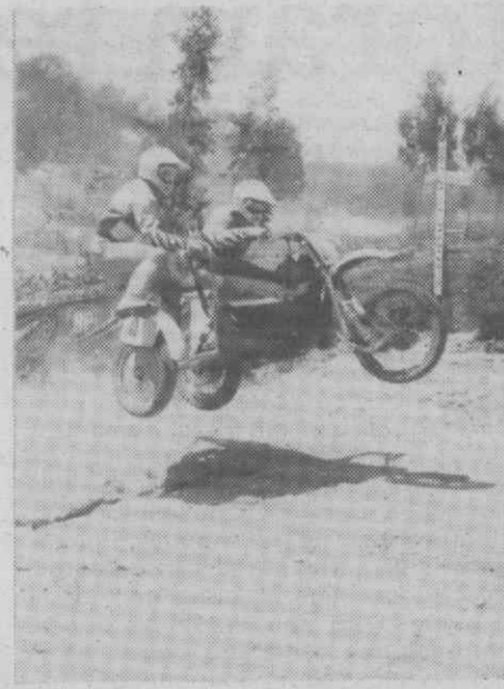
Os dinamarqueses Nielsen e Bitsch: segundos classificados.

Este Grande Prémio de Portugal foi para o GICA, um dos momentos altos das comemorações da passagem do seu 80.º aniversário.