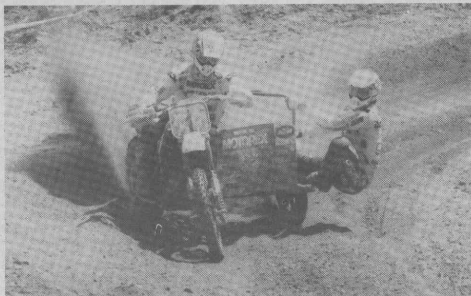
Os irmãos Huesser mostraram em Águeda as razões do título mundial conquistado em 1988.