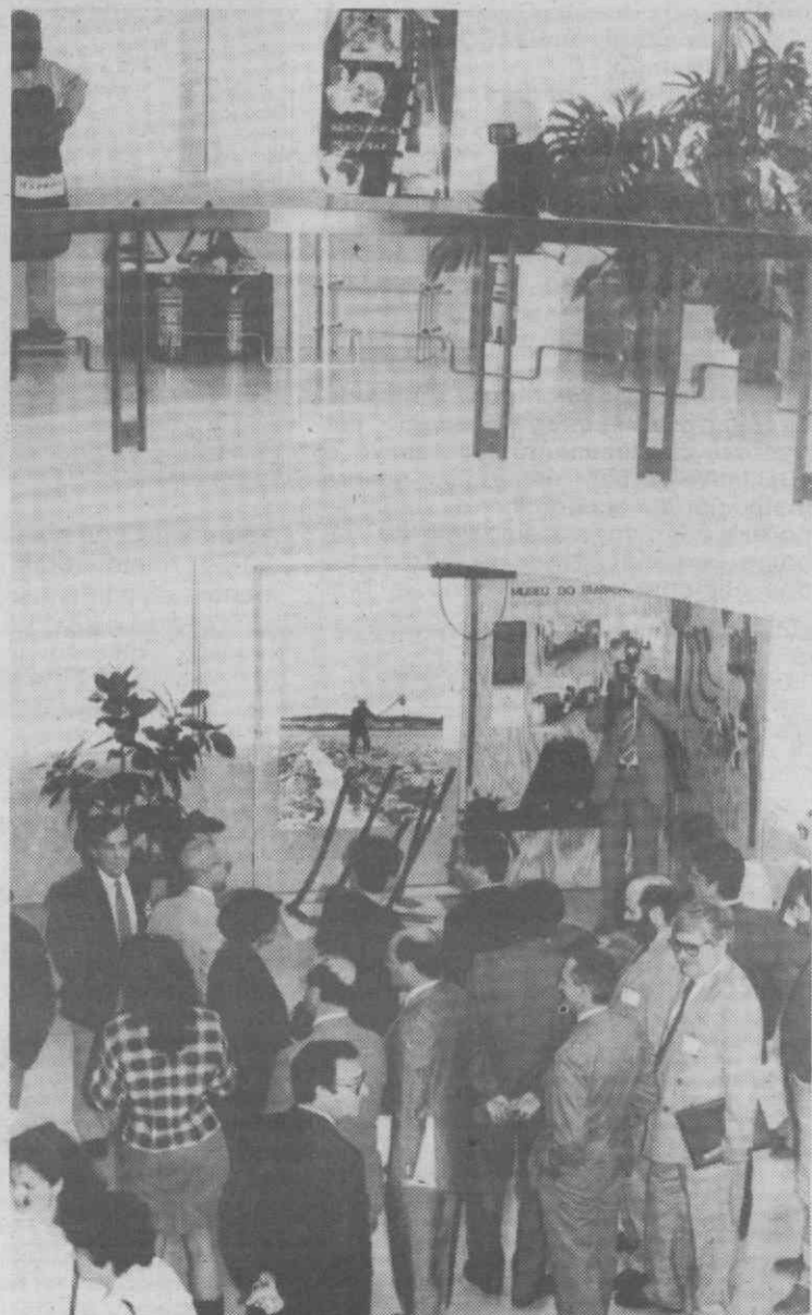
Um aspecto da chegada das entidades presentes ao encontro.