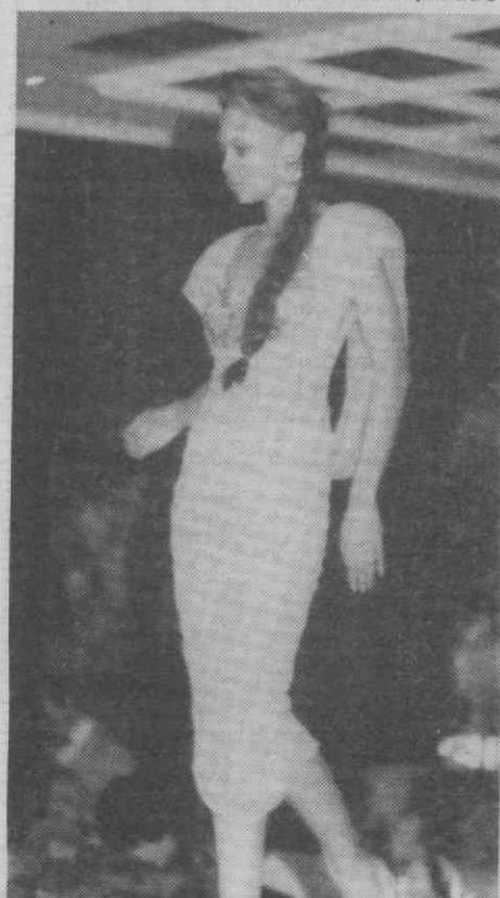
Um espectáculo de moda animou o jantar de apoio à CERCIAG.