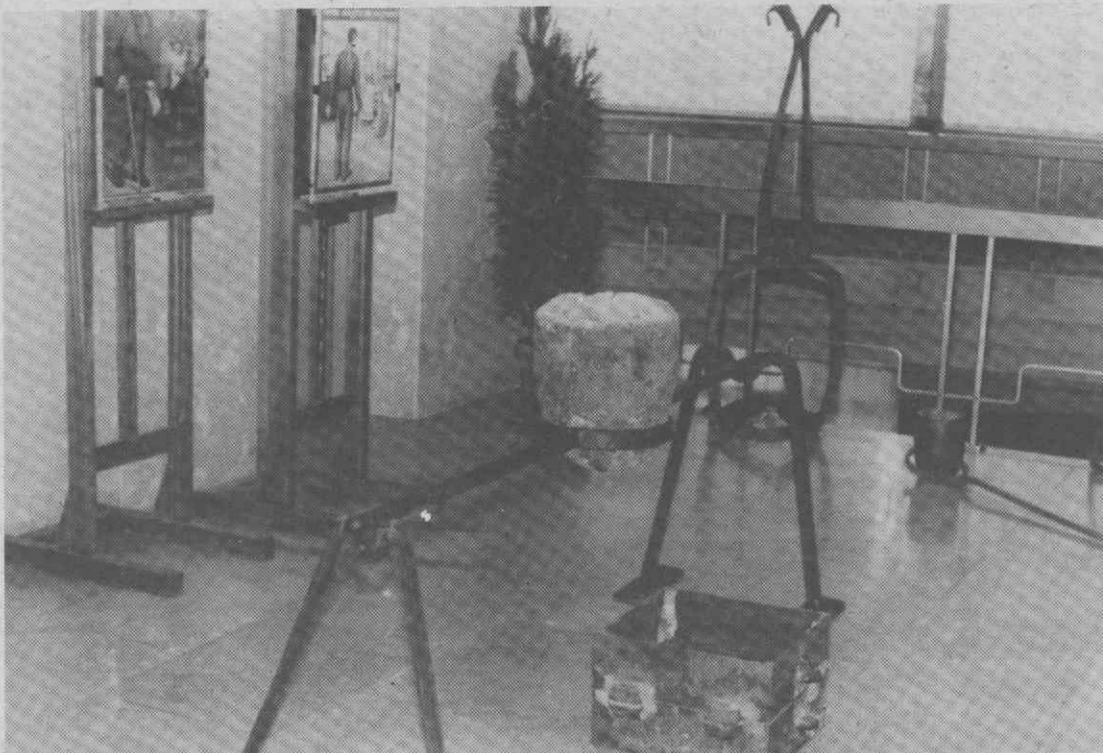
O trabalho e seus utensílios é tema da exposição que decorre em paralelo com o Encontro.