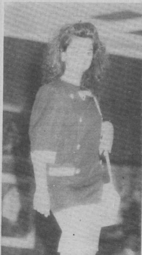
Um momento da passagem de modelos.