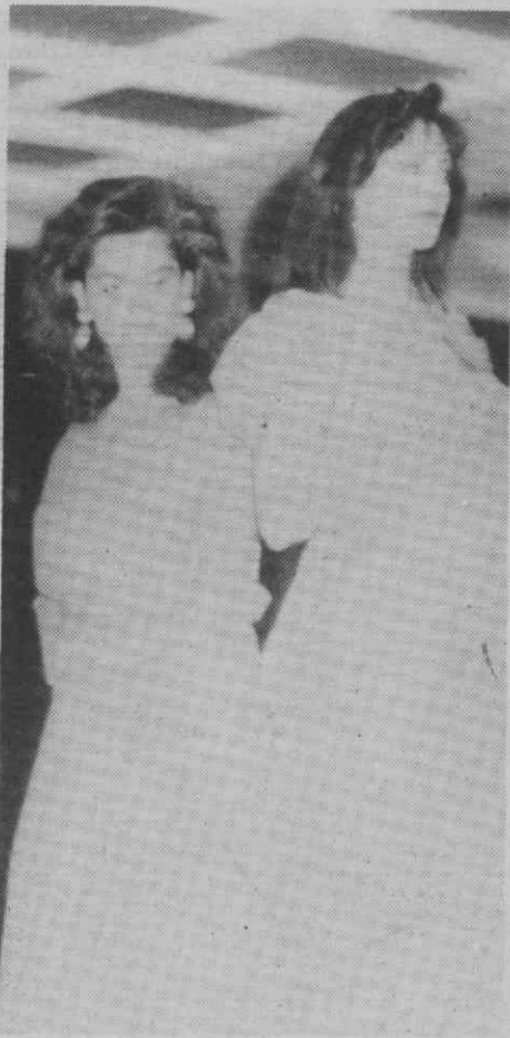
Um aspecto da passagem de modelos.

O presidente da Câmara de Anadia considerou que o projecto de desenvolvimento da CERCIAG «passa, também, pelo concelho de Anadia». «A CERCIAG é uma obra importante, constitui, sem dúvida, um bom moti-