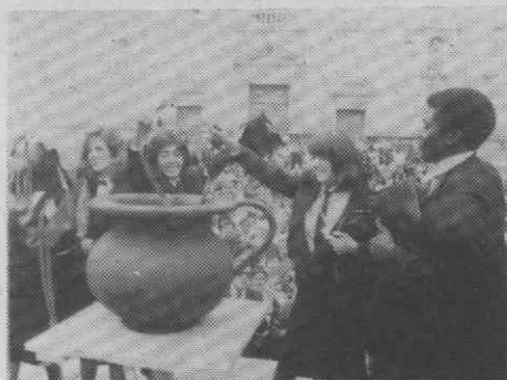
A «Queima das Fitas», num penico gigante. Momento que antecede o Cortejo e é apreciado pelos familiares dos estudantes.

Dos estudantes de Ciências e Tecnologia e de Letras saíram as piadas porventura mais incisivas acerca do insucesso escolar. Num carro ironizava-se que a «velocidade máxima é de duas cadeiras por ano» e noutro observava-se: «Foi uma sorte termos entrado, o problema vai ser sair».