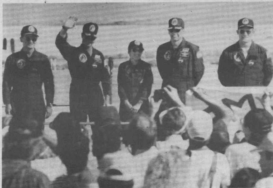
BASE AÉREA EDWARDS — A tripulação do vaivém «Atlantis» à chegada.

tária através do Sistema Solar a uma velocidade superior a 40.000 km por hora, até chegar a Vénus, dentro de 15 meses.