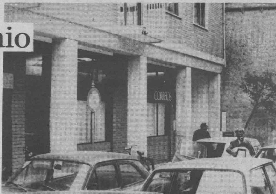
Um aspecto exterior das remodeladas instalações da Estação dos CTT de Esgueira.

Aquele responsável dos CTT salientou a obras em curso na Estação Central de Aveiro, e revelou ainda que «graças a um bom entendimento com a Câmara Municipal, é já possível determinar a obtenção de uma área disponível na zona da Forca, e que está já aberto concurso para o complexo administrativo onde passará a ficar a sede do Departamento Postal.