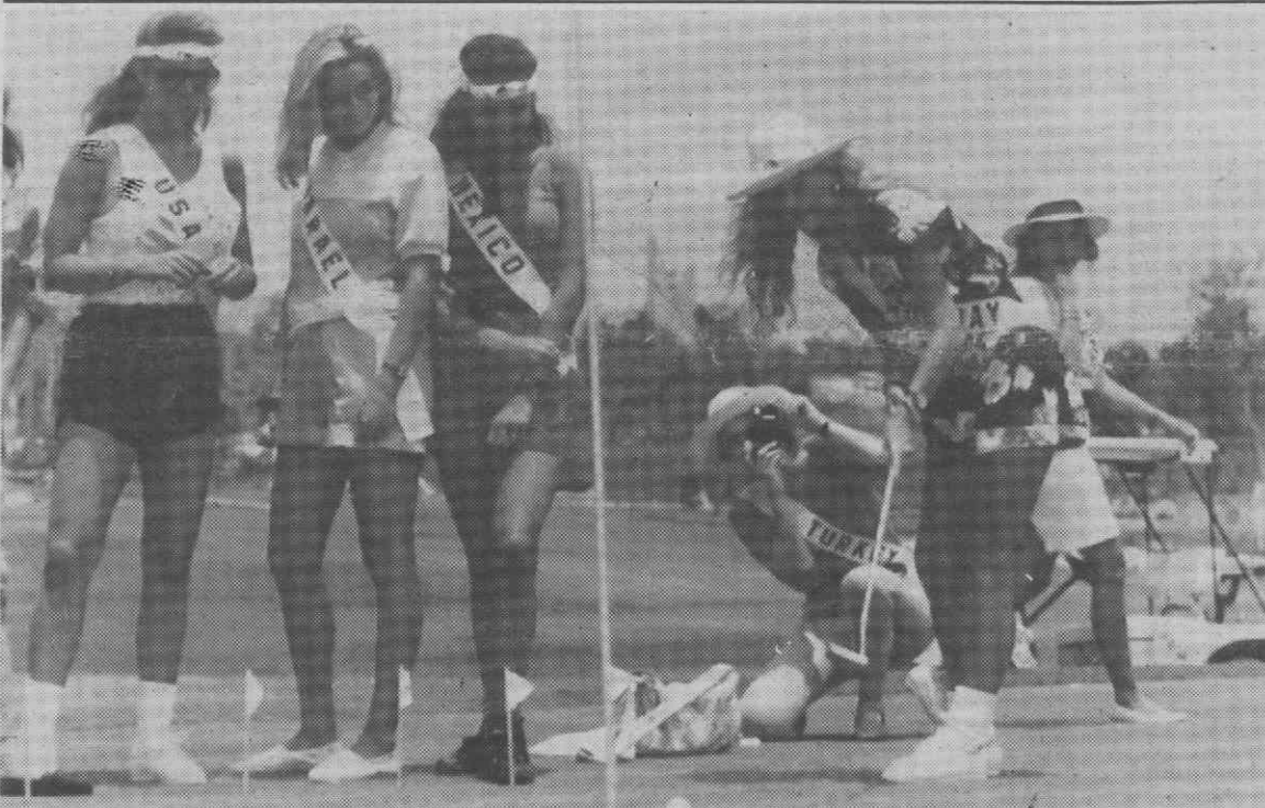
CANCUN — As Misses EUA, Israel e México assistem a uma jogada de golf da Miss Noruega enquanto a Miss Turquia fotografa o cenário.