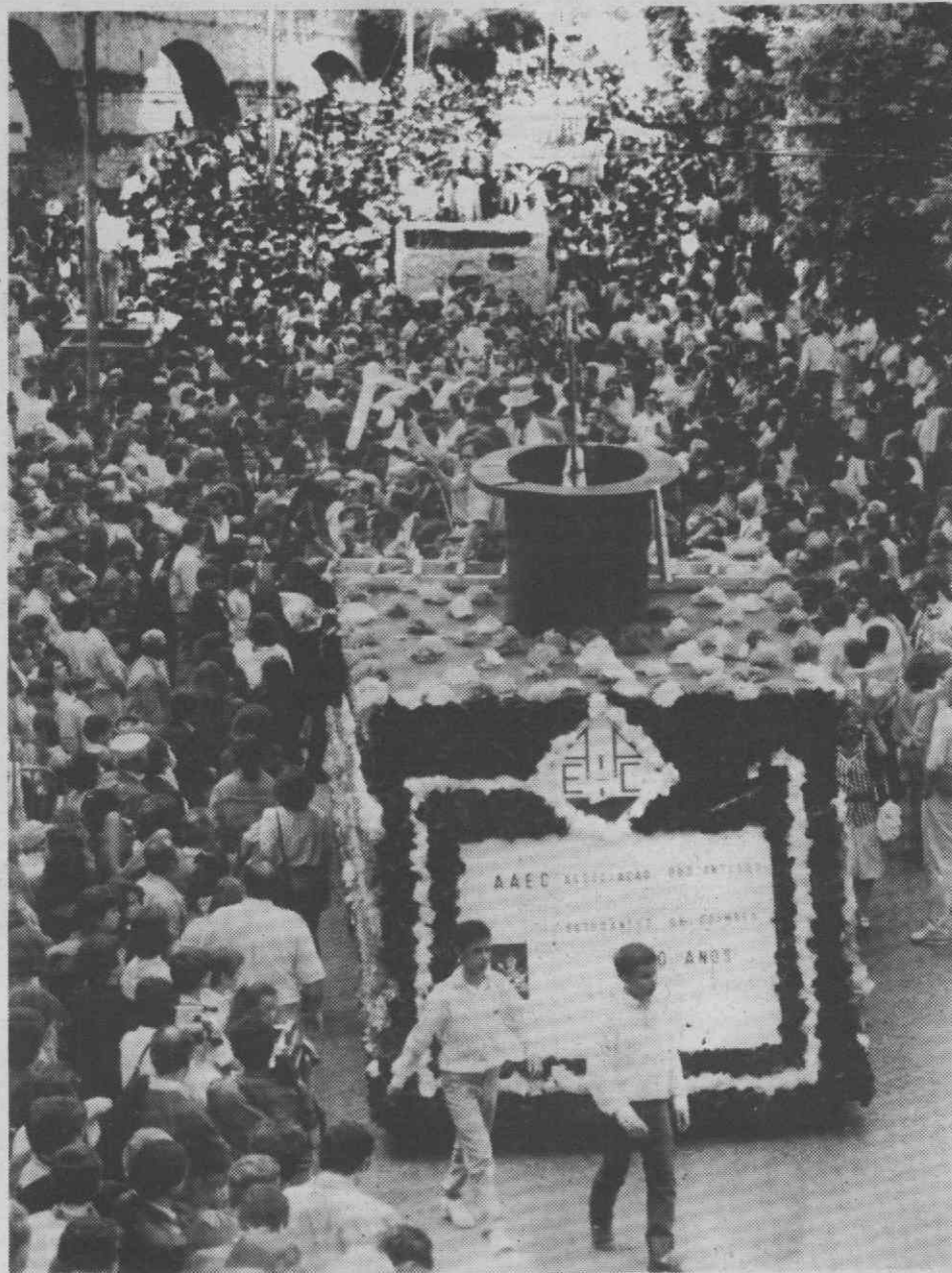
Mais de meia centena de carros alegóricos desceram da Universidade à Baixa de Coimbra. Cumpriu-se o tradicional abraço da Academia à cidade.