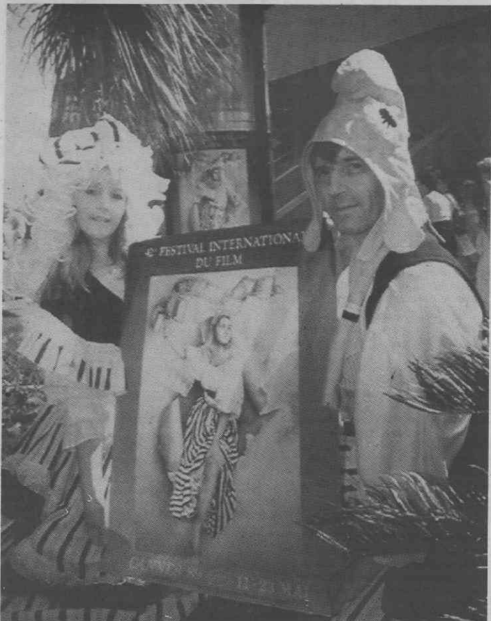
CANNES — Um casal em trajes tradicionais do tempo da Revolução Francesa apresenta o novo cartaz do Festival de Cinema de Cannes.