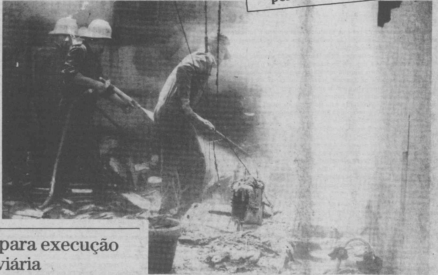
Nos primeiros 4 meses de 1989: bombeiros de Águeda realizaram 2.108 serviços.

Os bombeiros de Águeda acorreram a 28 incêndios florestais, 8 incêndios industriais, 8 incêndios urbanos, 158 acidentes de viação, 31 acidentes de trabalho e a 450 acidentes diversos.