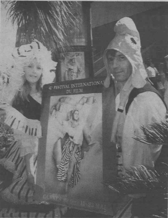
CANNES — Um casal em trajes tradicionais do tempo da Revolução Francesa apresenta o novo cartaz do Festival de Cinema de Cannes.