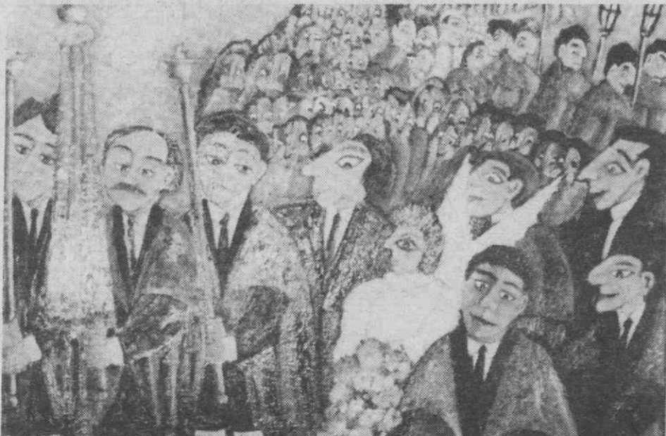
As noivas são sempre especiais, aqui mais ainda. O artista homenageou-as, ou talvez não? Descubra com uma visita à exposição, patente no Salão Cultural da Câmara, até 21 de Maio.

O resultado pode ser apreciado no Salão Cultural da Câmara Municipal de Aveiro, até ao próximo dia 21. Ai estão expostas algumas dezenas de trabalhos, quadros na sua maioria nas mais variadas técnicas de pintura. Assim, podemos observar trabalhos a carvão, grafitt, sanguínea, pastel, tinta da china, aguarela, guache, óleo e acrílico. Quanto à tapeçaria, o curso englobou a aprendizagem da técnica dos arraiolos, entre outras.