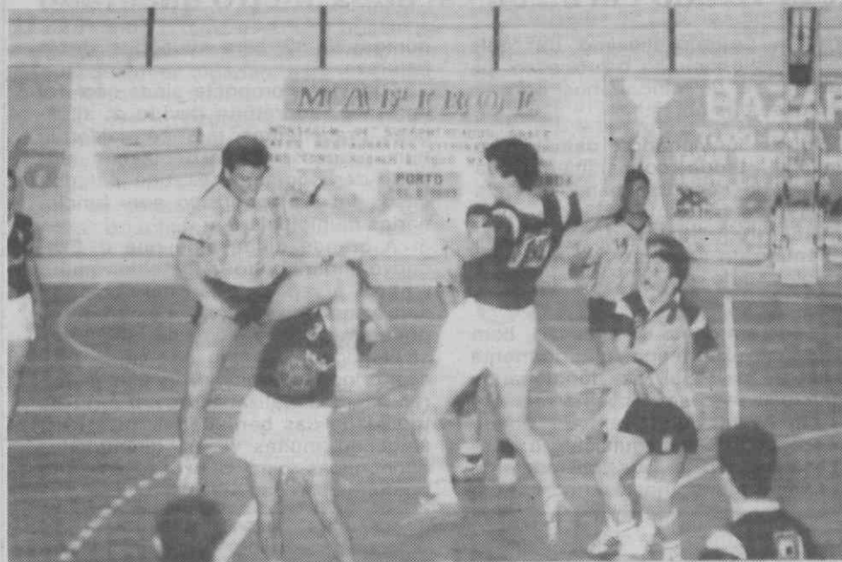
Uma fase do encontro entre a Académica de Águeda e a Sanjoanense.