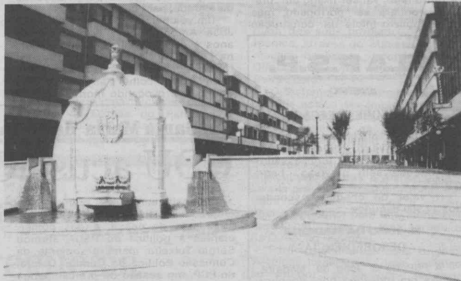
Águeda: cidade há quatro anos...

Classificação final: 1. FC Porto; 2. Infesta FC; 3. AD Sanjoanense; 4. AA Águeda.