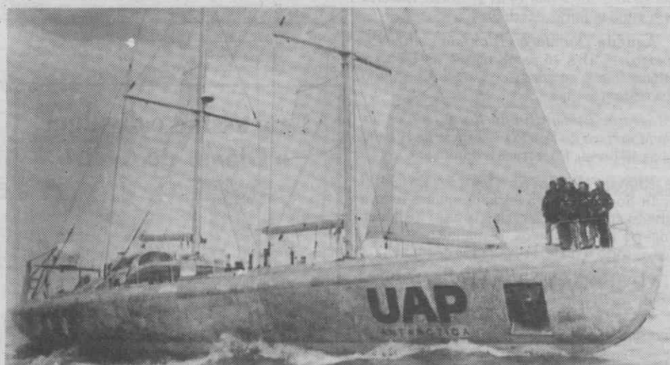
LE HAVRE (FRANÇA) — O veleiro «Uap-Antártica» no momento da partida para a sua viagem de circunnavegação do Pólo Sul.

Faltam apenas distribuir 26 frequências para 23 localidades.