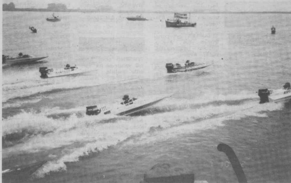
Com o apoio da «Navotel» motonáutica em Vila Real de Santo António.