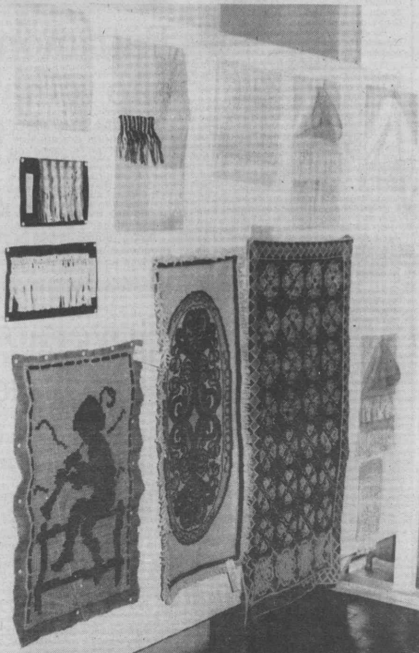
A arte da tapeçaria não ficou menosprezada. Houve espaço para lhe dedicar algumas obras. Isto porque a tapeçaria também é arte.