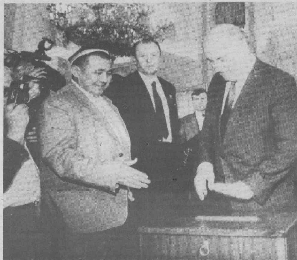
MOSCOVO — Mikhail Gorbachev deposita o seu voto na urna para a eleição do Presidente soviético.

O líder do Kremlin, Mikhail Gorbachev, foi reeleito pelo Congresso Presidente da União Soviética.