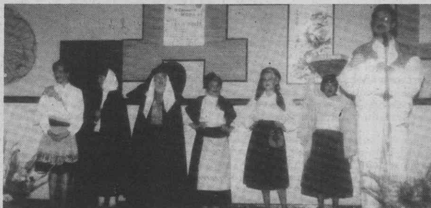
As seis concorrentes em trajes regionais, no início do concurso.

Realiza-se hoje a segunda eliminatória do Concurso Moda 89 - Miss Traje de Noite, que se realiza na Discoteca Fenix, na Praia do Furadouro.