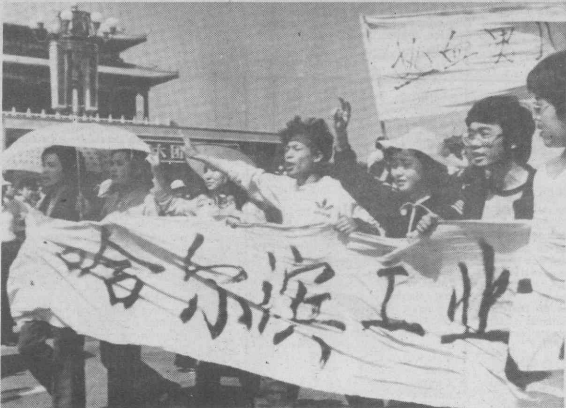
PEQUIM — Manifestações na Praça Tiananmem, exigindo a demissão de Li Peng.