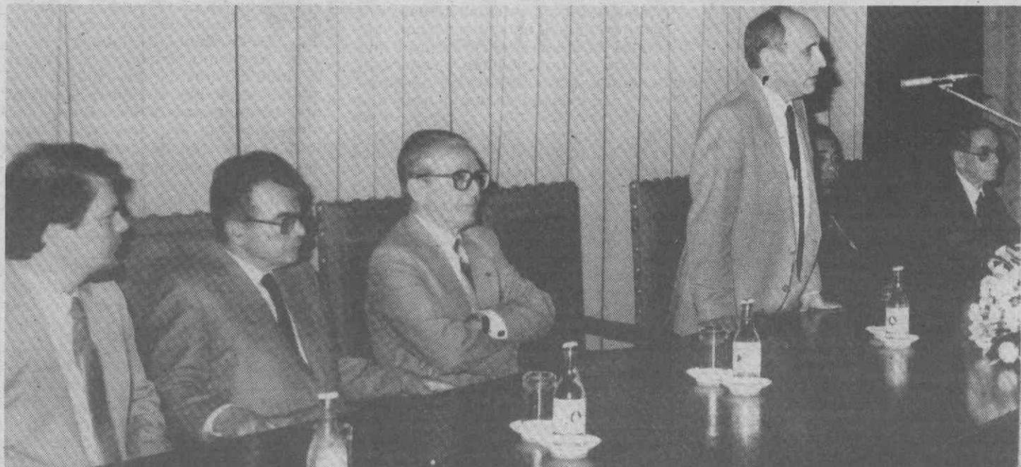
No uso da palavra, o Reitor da Universidade de Aveiro realçou o papel dos funcionários e da I Comissão Instaladora que «dedicam o seu trabalho a construir a Universidade».

A sessão de entrega decorreu no Dia Aberto da Universidade inserido no programa da Semana Estudantil, promovida pela Associação de Estudantes.