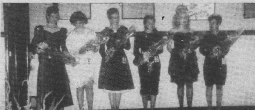
As concorrentes a este II Concurso Moda-89, nos seus trajes de noite, com que se apresentaram a concurso.

Na primeira eliminatória deste II Concurso Moda 89 - Miss Traje de Noite, apenas apareceram seis concorrentes, das nove que inicialmente se encontravam inscritas, pelo que foi muito mais simples para o Júri fazer a selecção, embora as seis concorrentes merecessem todas a sua atenção.