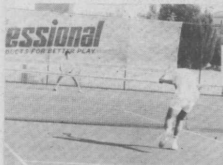
As Escolas do CTA movimentam actualmente 120 jovens tenistas.

As novas instalações sociais do CTA (balneários, casas de banho, secretaria e sala de convívio) vão proporcionar aos sócios e utentes do clube, melhores condições para a