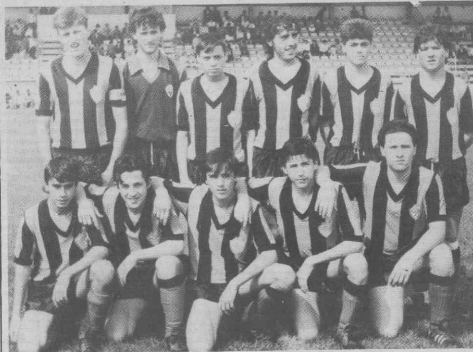
Equipa do Lamas: Lamas apresentou um conjunto aguerrido e lutador.

O trabalho de Amadeu Pinto não foi isento de erros, não tendo contudo influência no resultado. Os auxiliares do juiz da partida não estiveram bem.