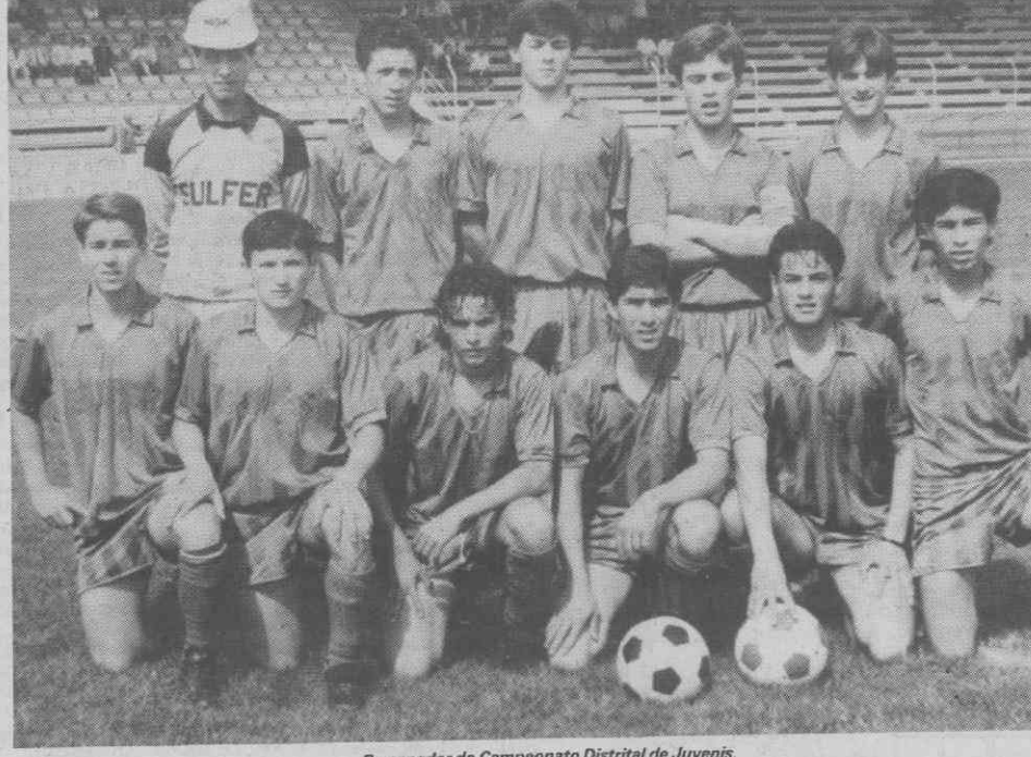
O vencedor do Campeonato Distrital de Juvenis.