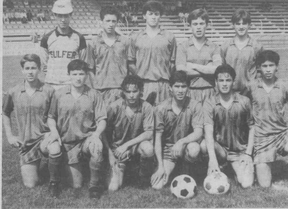
O vencedor do Campeonato Distrital de Juvenis.