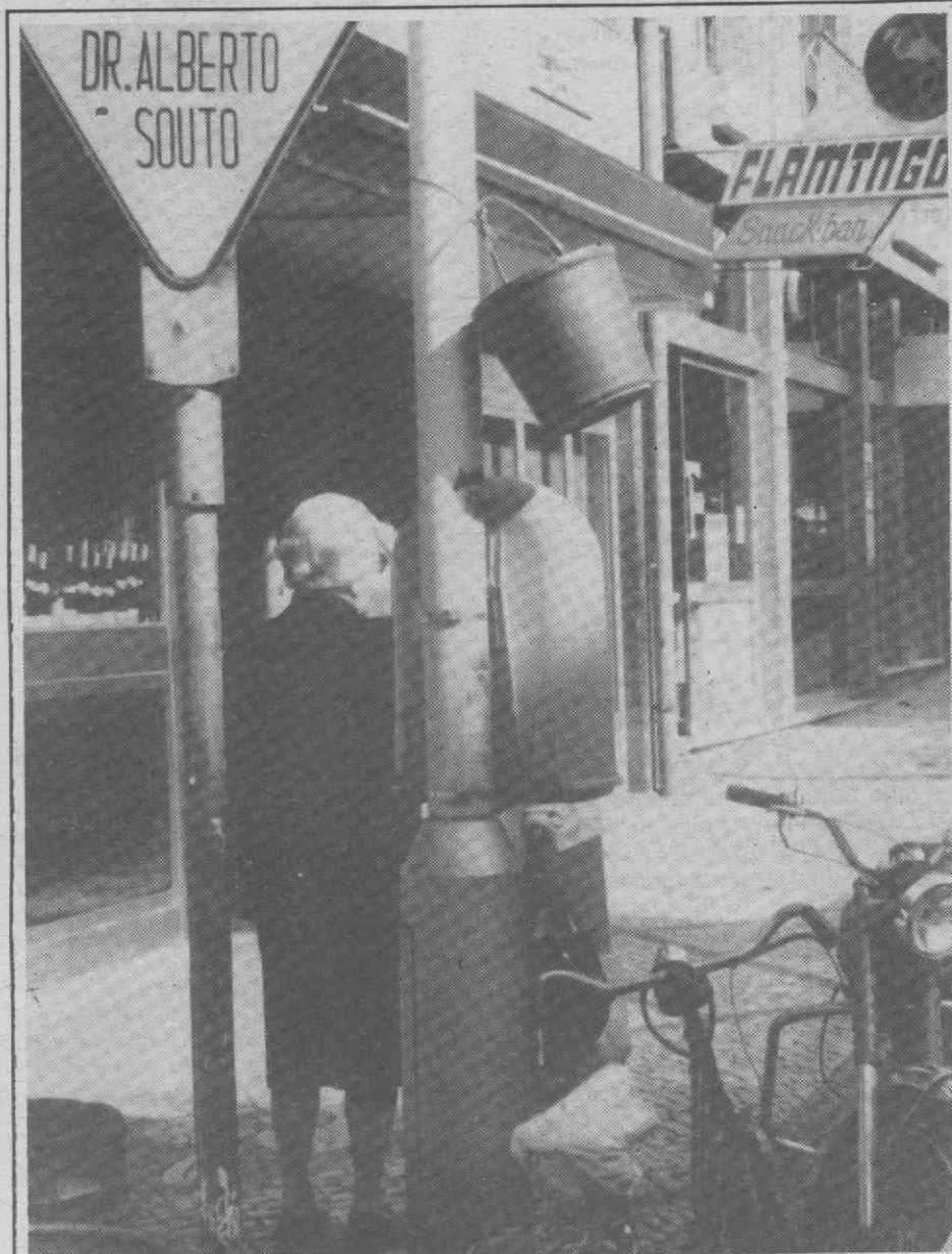
Já não está, mas esteve amarrado ao poste — o balde de plástico. Esteve lá durante quatro dias (deixou de ser visto no passado sábado) e ninguém reclamou. Que coisa! — um balde de plástico amarrado com uma corda ao poste de um candeeiro. Será que alguém de estatura elevada amarrou o balde e o deixou esquecido? Era apenas um reservatório de água? Assistimos a mais uma performance de rua, pelos vistos duradoura, na nossa cidade? Para uns é um arripio ao institucionalizado, para outros é piada, os outros... nem viram. De qualquer forma é arrogante pela intromissão no meio já de si pouco harmonioso. As tantas até que nem fica mal. Uma última informação: a obra não estava assinada. Porque será que as pessoas fazem destas coisas? Entregou-se a quem fosse lá buscá-lo...

O candidato continua a campanha eleitoral no Porto.