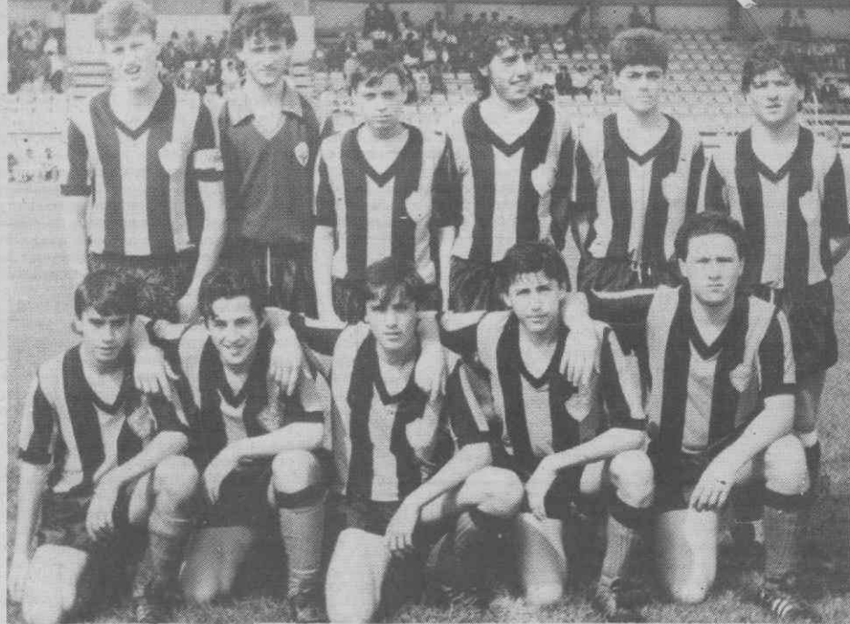
Equipa do Lamas: Lamas apresentou um conjunto aguerrido e lutador.

O trabalho de Amadeu Pinto não foi isento de erros, não tendo contudo influência no resultado. Os auxiliares do juiz da partida não estiveram bem.