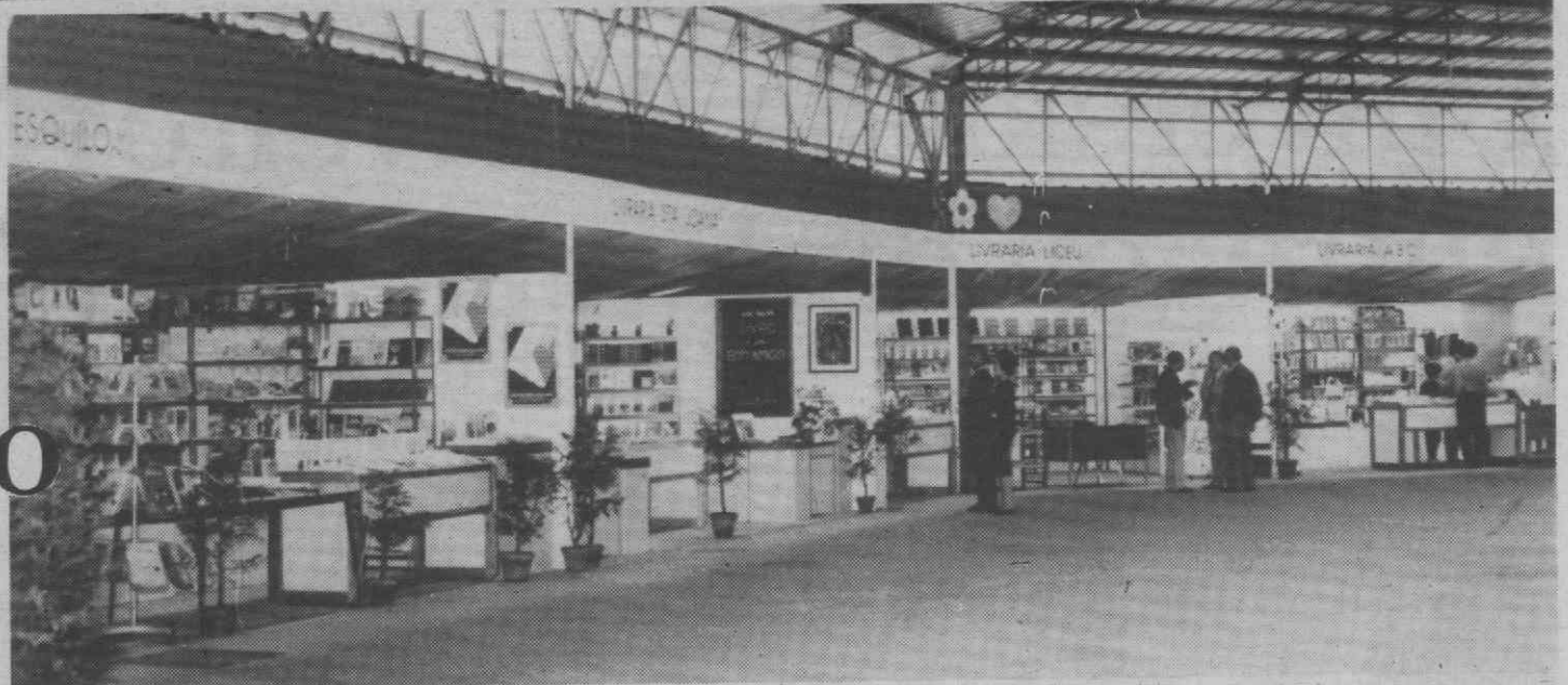
Aspecto geral da Feira do Livro em Aveiro.

A comissão organizadora, à semelhança de anos anteriores, elaborou um programa de animação contribuindo, dessa forma, para um melhor acolhimento do público no pavilhão e uma visita mais demorada. É uma prova do empenho da comissão no êxito da feira.