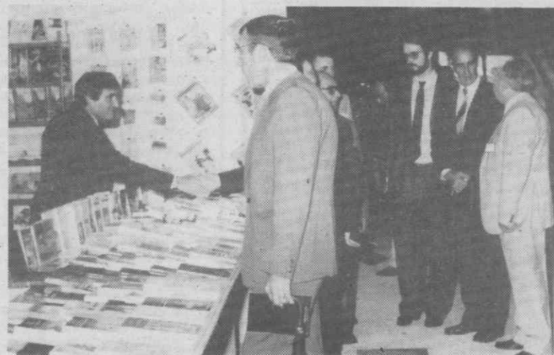
Visita das autoridades locais à Feira do Livro no dia da sua inauguração.