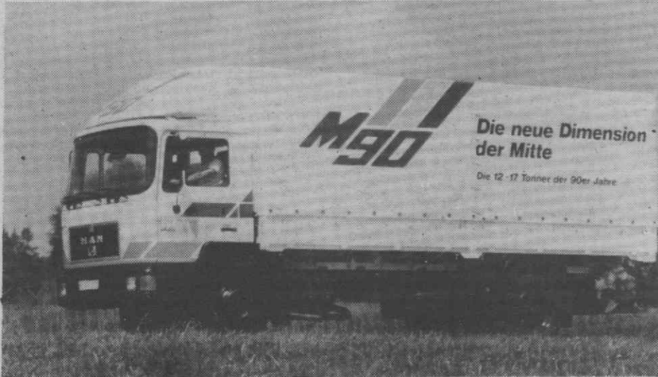
M90, o último dos modelos da nova geração MAN.

A «MAN», por intermédio do seu importador em Portugal, «Salvador Caetano», procedeu na passada semana, nos arredores do Porto, à apresentação da nova gama «Média M90», iniciativa que se enquadra no âmbito do «Auto Show'89».