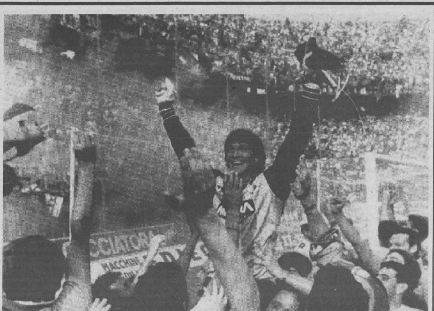
MILÃO — FUTEBOL — O guarda-redes do Milão é levado em ombros por fãs, após a vitória da sua equipa sobre o Nápoles.

Finalmente, o quinto prémio terá um valor individual de 106 escudos, prémio este que resulta da distribuição de 871.394 matrizes.