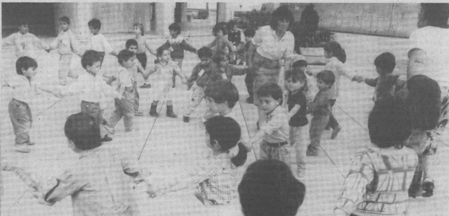
A Praça do Município foi o palco escolhido pelas Pré-Primárias do concelho e pela Casa da Criança para realizar diversas actividades.