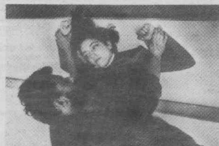
Um aspecto de uma das cenas de «A Fera», de Charles Marowitz.

Apos a estreia, o espectáculo permanece em cena até ao próximo dia 13, excepto nos dias 6 e 7.