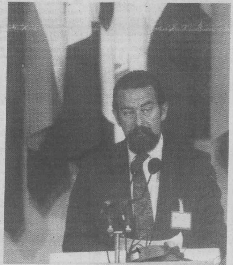
PARIS — O ministro português dos Negócios Estrangeiros, João de Deus Pinheiro, discursa no Fórum dos Direitos Humanos da Conferência de Segurança e Cooperação Europeia.