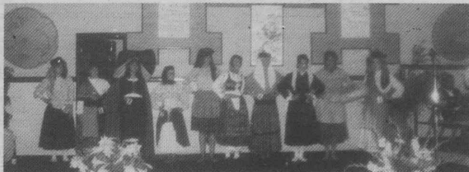
As dez concorrentes nos seus trajes regionais, antes da prova decisiva.