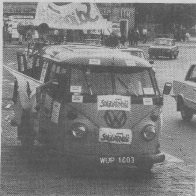
VARSOVIA — Carro de propaganda eleitoral do Solidariedade.

Nesta reunião foi debatida a reforma do sistema do Ensino Básico e Secundário que vai ser implementada em fase experimental a partir de Setembro, em cerca de 70 escolas do país.