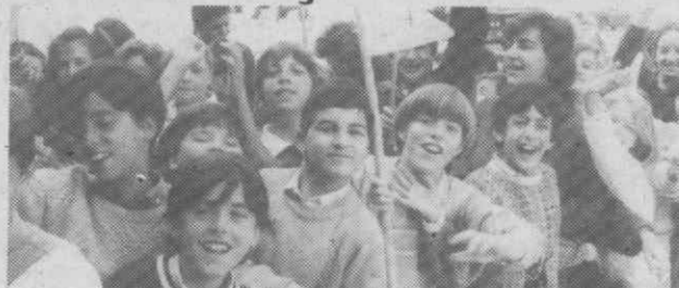
Mais de mil crianças, depois de percorrerem as ruas de Águeda, encheram o Pavilhão Gimno desportivo do GICA. Na foto, um grupo de alunos do Ciclo Preparatório aguarda a sua vez para entrarem no recinto.