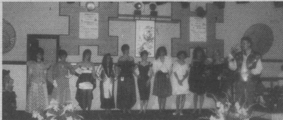
Já com os trajes de noite, as concorrentes preparam-se para ouvir as decisões do júri.