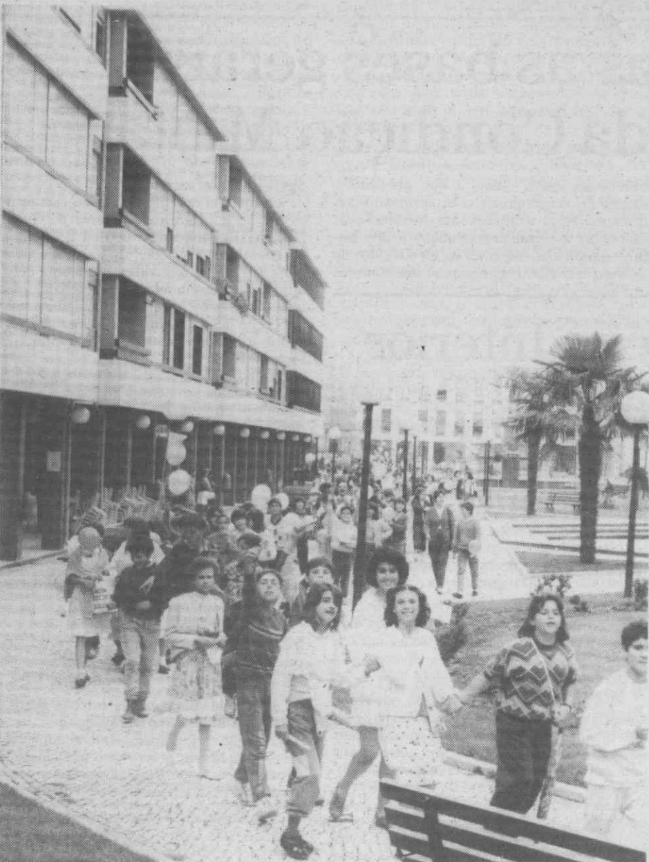
Águeda foi invadida por milhares de crianças.

«Umás lindas, outras feias, De caracóis ou tranças Os homens de amanhã Somos nós, as Crianças.