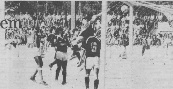
Uma jogada de ataque que deu o primeiro e único golfo ao Avanca.

Texto: Jacinto Martins