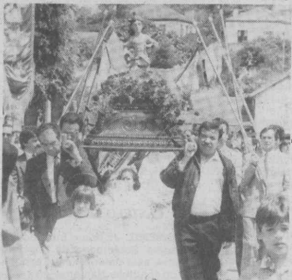
Um aspecto da procissão que se seguiu à missa campal realizada na Praça do Município.