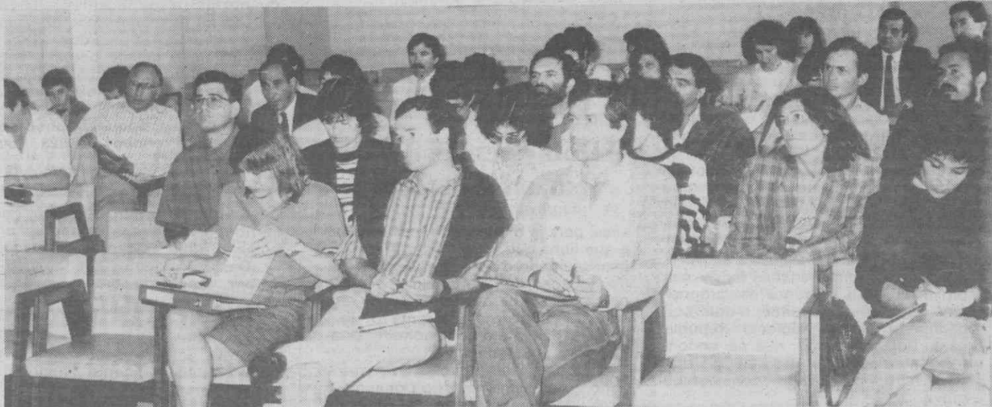
Algumas dezenas de professores de Educação Física discutiram o projecto de Decreto-Lei sobre Desporto Escolar, elaborado por uma comissão especializada.

O projecto de Decreto-Lei apenas poderá entrar em vigor no próximo ano lectivo, na medida em que está pendente da aprovação do Ministro da Educação e respectiva publicação do Diário da República. Todavia, e segundo palavras proferidas por Gouveia Lopes, dentro de dias deverá ser publicado no Diário do Governo um