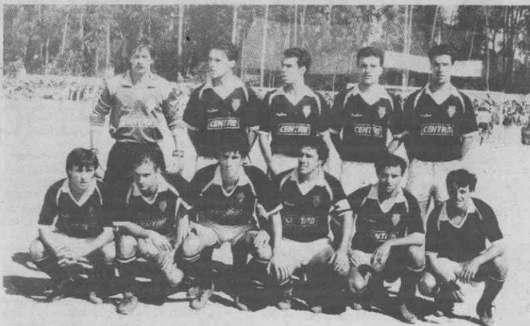
A equipa da Sanjoanense que subiu à III Divisão Nacional.

«Não influiu no resultado, embora pense que nós ficamos prejudicados no critério da amostragem dos cartões. Mas, quero frizar que não foi pelo árbitro que nós perdemos. Alguém nos apunhalou antes de forma que eu não posso deixar de lamentar.