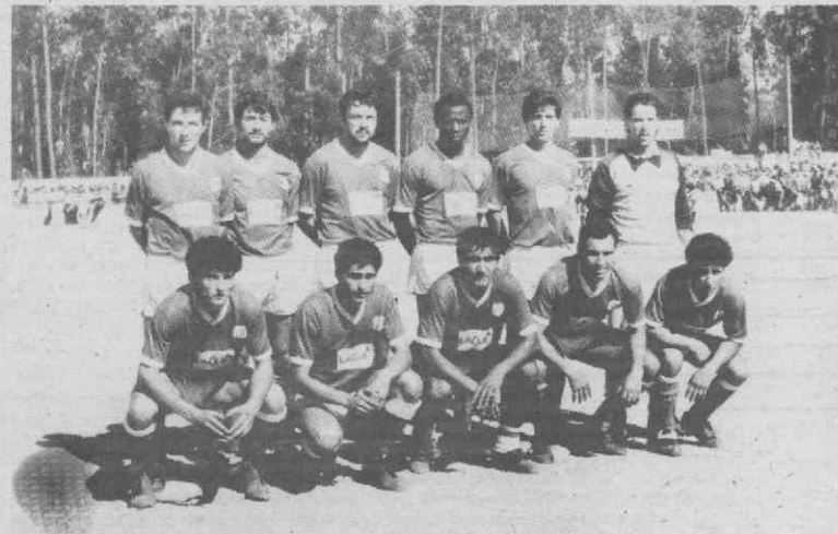
A equipa do Avanca, os vencidos do campeonato, que veio disputar a Taça, gorados que foram os esforços da subida, resultantes da falta de informação da Associação de Futebol.