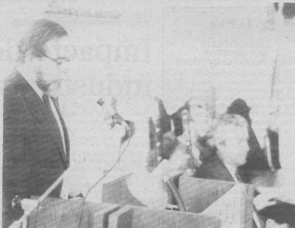
Manuel Alegre, no uso da palavra durante a sessão cultural.