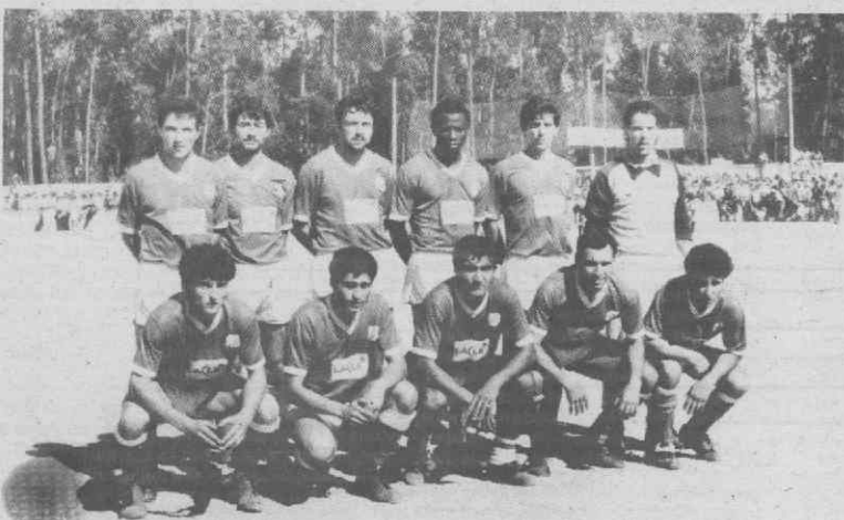
A equipa da Avanca, os vencidos do campeonato, que veio disputar a Taça, gorados que foram os esforços da subida, resultantes da falta de informação da Associação de Futebol.