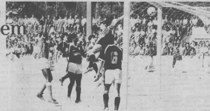
Uma jogada de ataque que deu o primeiro e único gol a Avanca.

Texto: Jacinto Martins