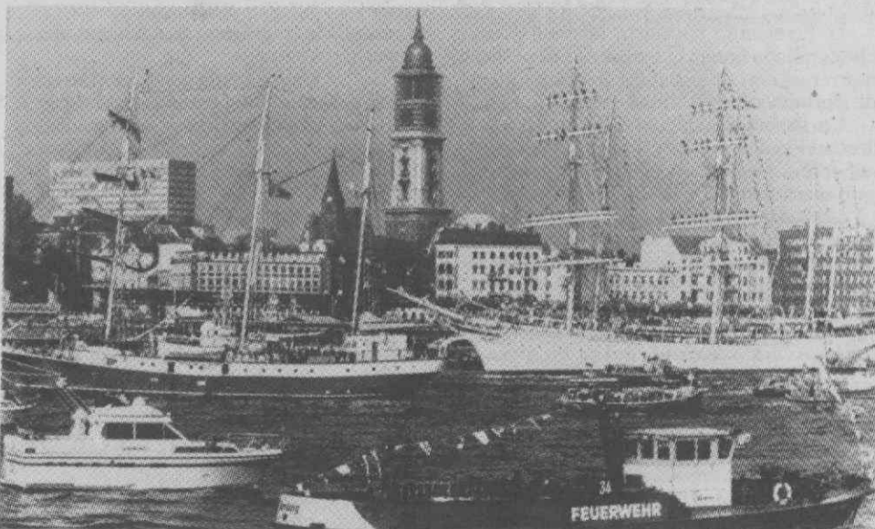
Muito movimento em terra e na água. Uma das atracções foi a caravela norueguesa «Statsraad Lehmkuhl». Ao fundo: o símbolo da cidade de Hamburgo, a torre da Igreja de São Miguel.

Cerca de dois milhões de visitantes encheram as margens do Rio Elba e os cais do Porto de Hamburgo, para comemorar os 800 anos desta «porta da Alemanha para o mundo». Foi a maior festa jamais realizada na Cidade Livre e Hanseática. Cerca de 400 embarcações, chegadas de quase toda a Europa, homenagearam com sua vinda o mais importante porto da Alemanha, entre elas o veleiro norueguês «Statsraad Lehmkuhl», a maior caravela do mundo; o navio fluvial de rodas «Dresden» e o quebra-gelo «Stettin» da Alemanha Oriental, assim como o veleiro de três mastros bremense «Alexander von Humboldt».