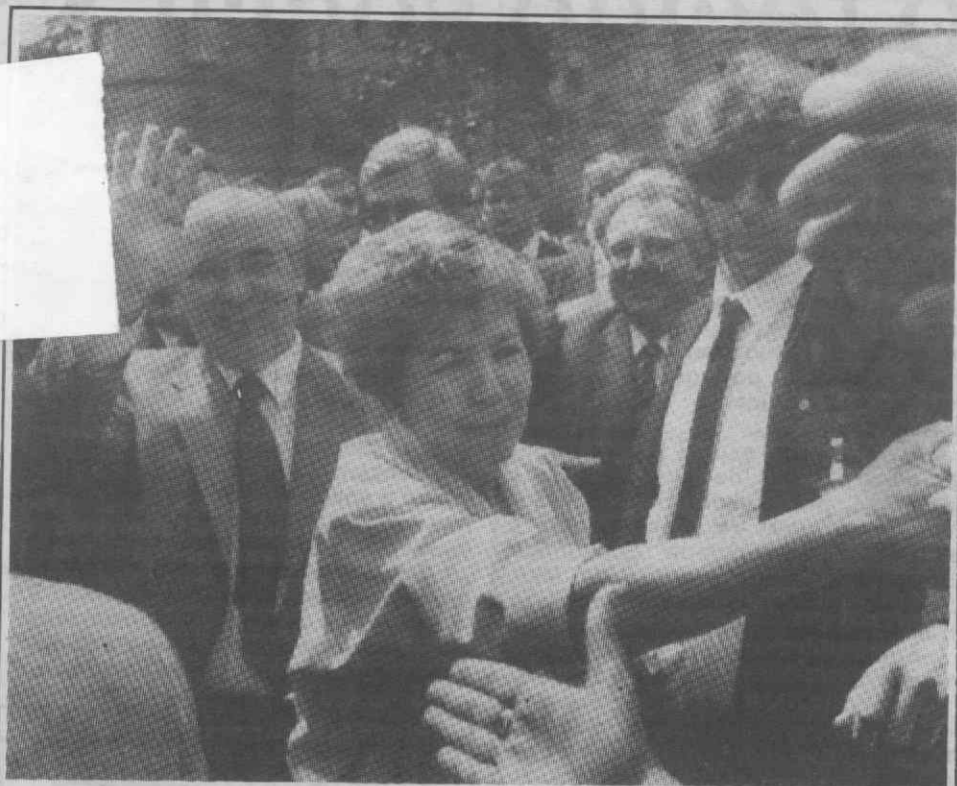
ESTUGARDA — O casal Gorbachev é calorosamente recebido pela população de Estugarda.

«DIÁRIO DE AVEIRO» AE Biblioteca Municipal Praça da República 3800 AVEIRO