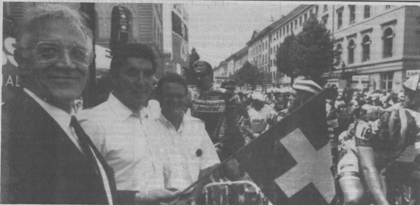
Estamos em época de corridas velocípédicas. Depois da «Vuelta», e do «Giro», é agora a vez da Volta à Suíça. A partida para a edição deste ano (na foto) foi dada pelo «mayor» de Berma e pelo campiãoissimo Eddy Merckx.