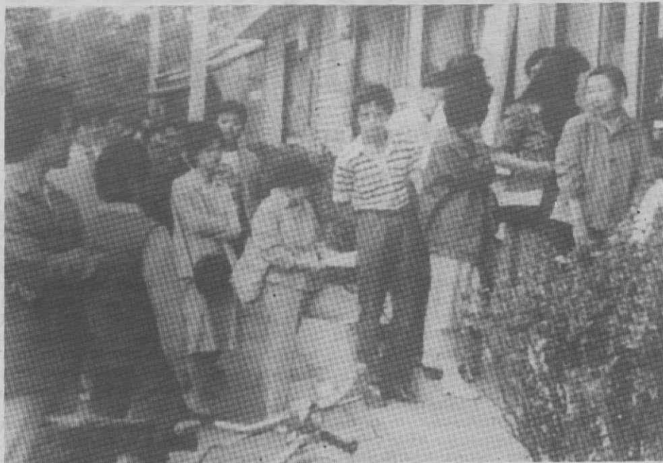
PEQUIM — Chineses fazem bicha em frente ao Banco da China para levantarem os seus depósitos em moeda estrangeira.

Os quatro principais armazéns de Pequim anunciaram perdas no total de 10 milhões de yuan (4 milhões de contos), isto só devido aos quatro dias de encerramento nos primeiros dias de Junho.