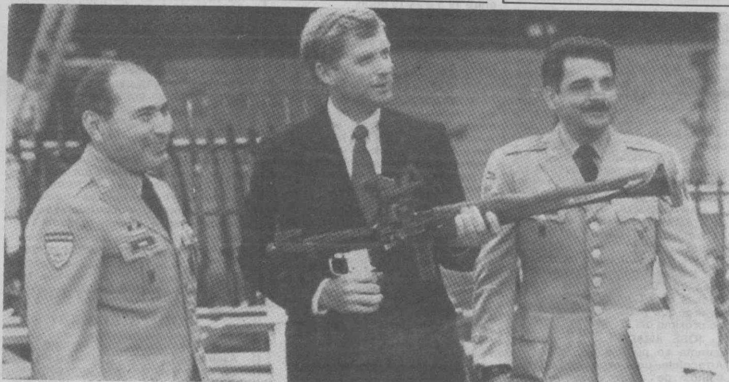
SÃO SALVADOR — O vice-Presidente dos Estados Unidos, Dan Quayle, empunha uma arma de fabrico soviético (uma RPG-7), confiscada recentemente pelo Exército salvadorenho à guerrilha.