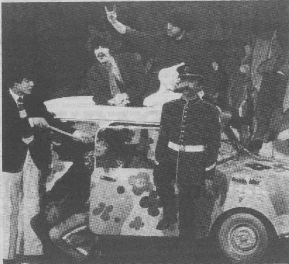
A evocação dos «Beatles» no espectáculo do Casino Estoril.