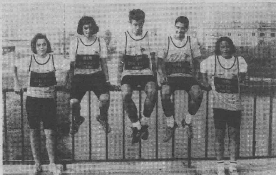
A equipa de atletismo do Beira Mar.

— Seleccção de Aveiro conta com a presença de três atletas do Beira Mar