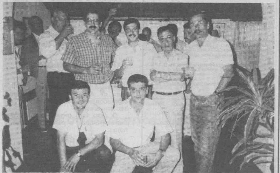
O grupo dos «foliões do aviãozinho» antes do jantar, na fase dos aperitivos...