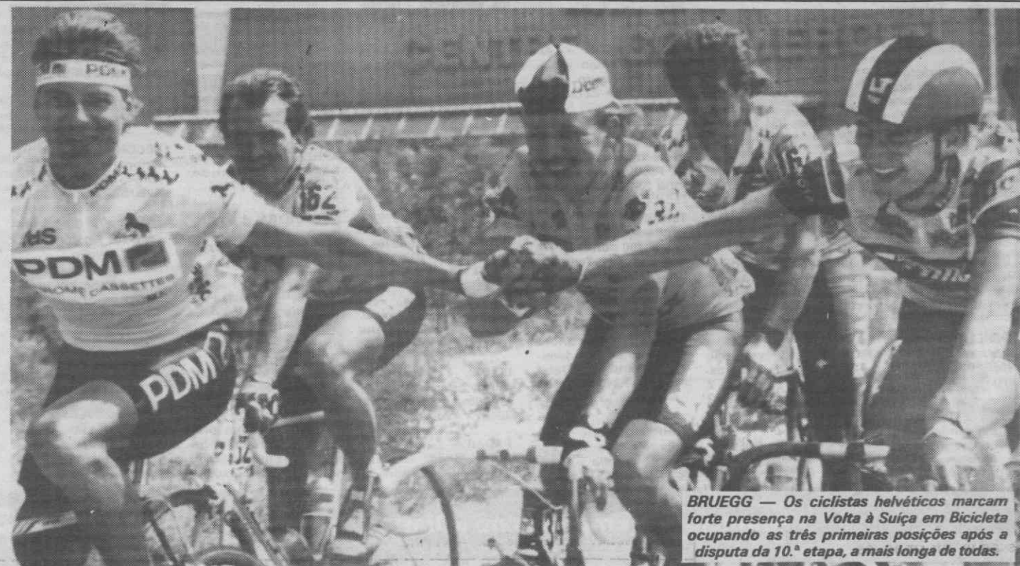
BRUEGG — Os ciclistas helvéticos marcam forte presença na Volta à Suíça em Bicicleta ocupando as três primeiras posições após a disputa da 10.ª etapa, a mais longa de todas.