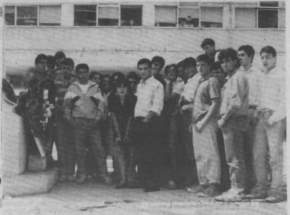
«Estudantes portugueses solidários com os chineses», foi a palavra de ordem.

Os estudantes do distrito de Aveiro manifestaram-se na tarde de ontem frente à Câmara Municipal de Aveiro, demonstrando a sua solidariedade para com os estudantes chineses.