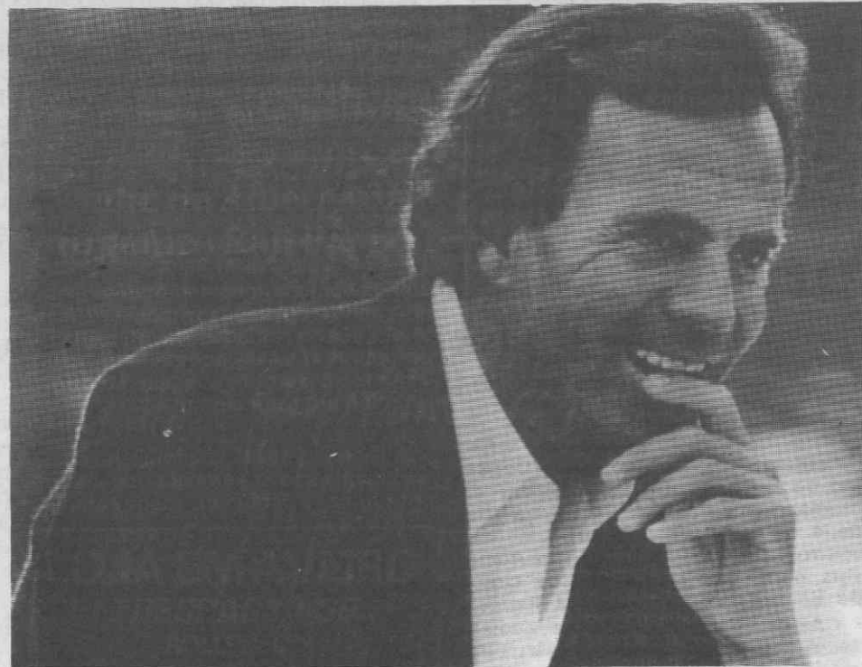
Júlio Iglésias — uma carreira de êxitos sucessivos.

Entretanto, no próximo dia 26 (segunda-feira), através do canal 1 da RTP, às 13h30, será exibido um programa de Júlio Iglésias, intitulado «Júlio Iglésias — Especial Raices» onde participa também a célebre actriz Brooke Shields.