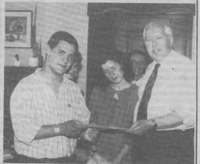
Ficou a cargo do governador civil, a entrega da moção na Embaixada chinesa.