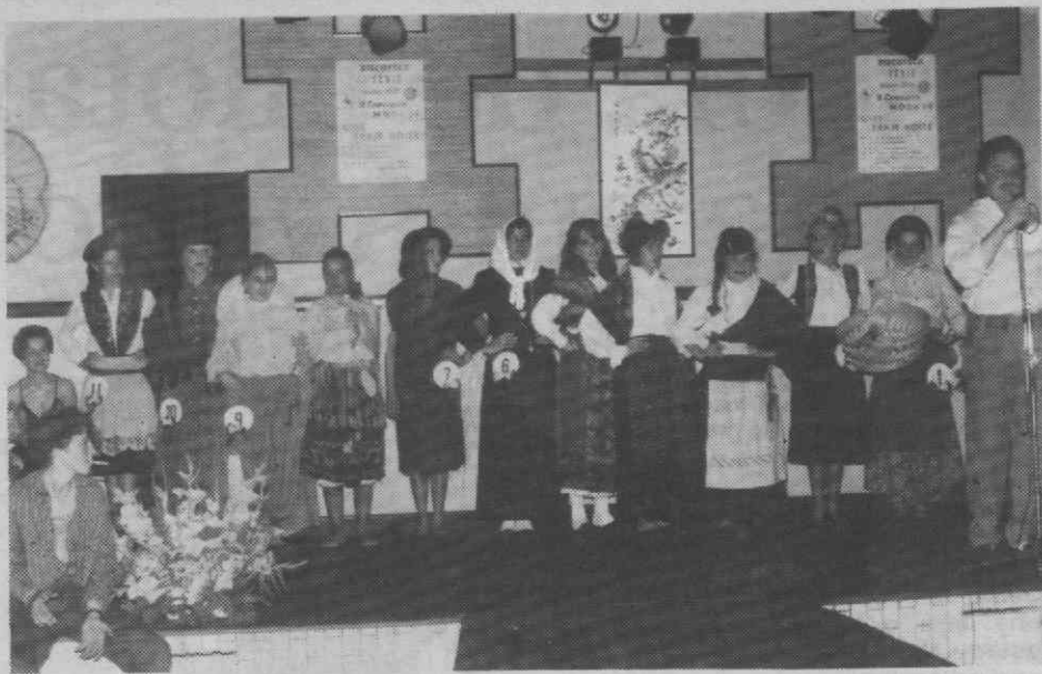
As candidatas em trajes regionais, antes do desfile classificativo.