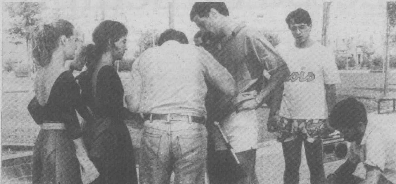
A equipa de filmagem com duas bailarinas visionando as imagens recentemente colhidas.

A realização de um filme, em vídeo, sobre Aveiro, que a Câmara Municipal resolveu mandar fazer, encontra-se em andamento, devendo este estar terminado lá para os fins do mês de Setembro.