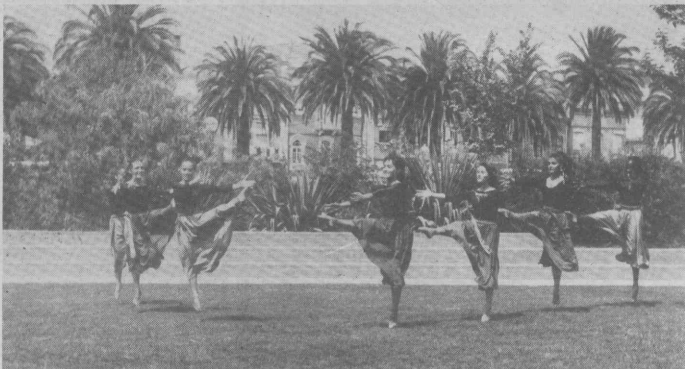
Projecto Dança de Aveiro executando o número seleccionado para este filme.