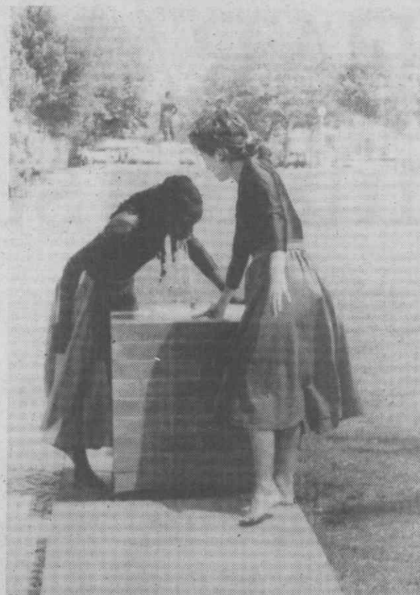
O calor escaldante que se fazia sentir na tarde tórrida de sexta-feira passada obrigou as bailarinas a refrescarem-se.

A equipa técnica que se encontra à frente da concepção do vídeo é composta pelo realizador Carlos Pelicas, auxiliado por José Casimiro, Assistente de Imagem estando a Imagem a cargo de Mário Marnoto.