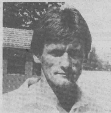
Sousa esteve ausente perante o Penafiel, prevendo-se que a sua estreia aconteça amanhã contra o Braga.

oportunidade de observar os seus pupilos, enquanto espera por alguns reforços. Sousa ainda não jogou (o seu contrato com o Porto apenas expirou ontem), Bozinoski idem. Quanto a Mário Jorge, só ontem chegou a Aveiro.