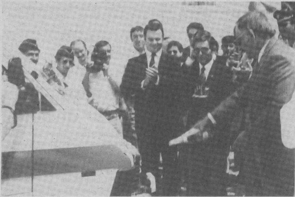
A bênção dos novos carros.

corporações presentes, encontrando-se elementos de todas as Bombas da região, procedeu-se à imposição de medalhas a elementos do Corpo Activo, terminando a cerimónia com um lanche oferecido aos convidados.