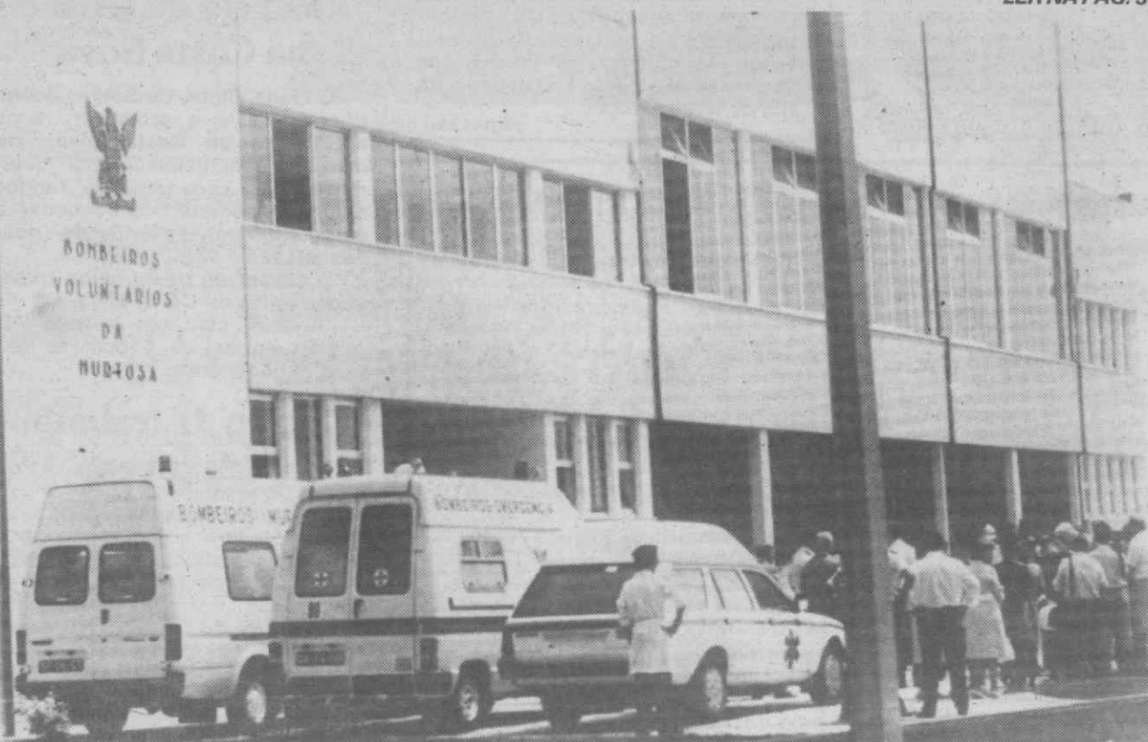
A fachada do novo quartel, vendo-se em primeiro plano os novos carros dos Bombeiros da Murtosa.