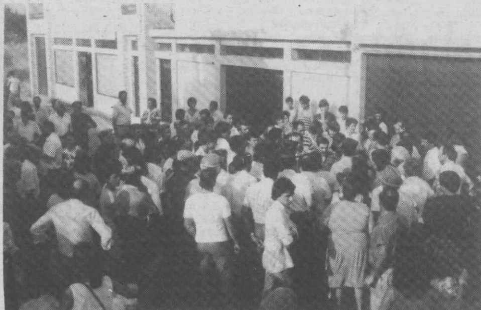
O caso de Barqueiros, parece estar a dar os seus frutos, aqui bem perto de nós. Mas a população de Sangalhos não está sozinha, a apoiá-la estão os concelhos de Mealhada, Oliveira do Bairro e Anadia.

— Encontro com governador civil pode evitar formas de luta mais drásticas