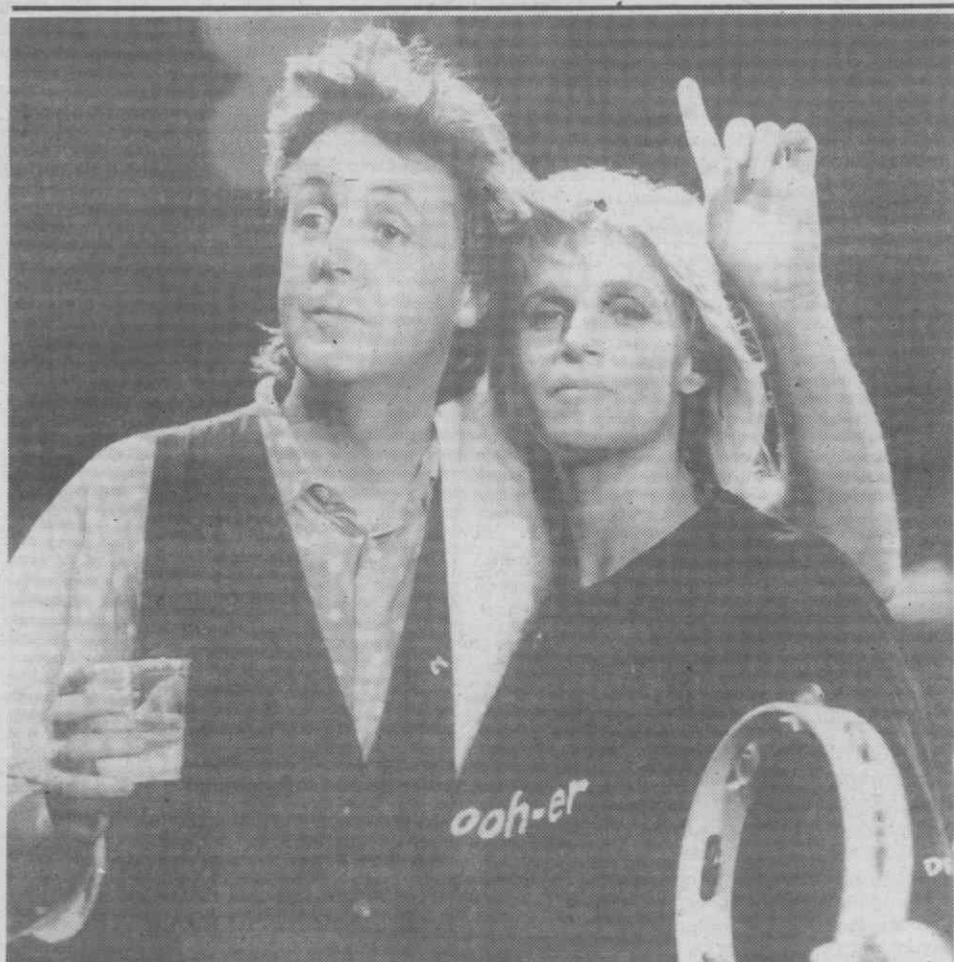
LONDRES — O ex-Beatle Paul McCartney e sua mulher, Linda, durante uma conferência de imprensa no Playhouse Theatre, anunciam os seus planos para uma viagem artística de volta ao mundo. A partida será a 26 de Setembro em Oslo e continuará pelo resto da Europa até Fevereiro de 90.

Este avião é utilizado com toda a segurança pela maior parte das grandes linhas aéreas há vários anos, sublinhou a IFAPA.