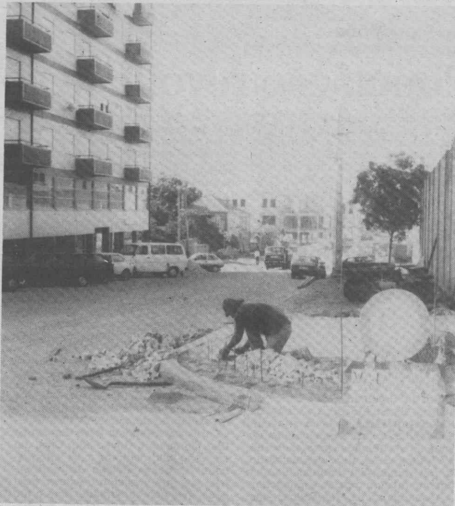
Um aspecto da Rua Gustavo Pimenta.

A abertura do pontão, já alargado, sobre a linha férrea se, por um lado, vem permitir a concretização dos estudos urbanísticos efectuados para a zona, por outro, põe cobro a uma situação de grande risco para os