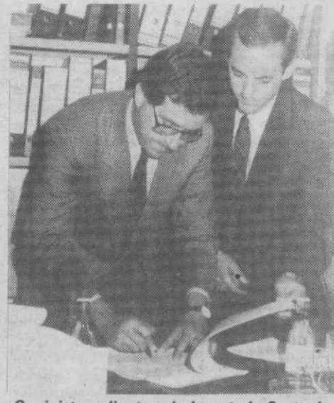
O ministro adjunto e da Juventude, Couto dos Santos, na assinatura do protocolo com as associações de Estudantes da Universidade de Aveiro e do ISCA, para equipamento do Gabinete de Saídas Profissionais.

Neste momento, o GASP/UA/ISCA funciona nas instalações da Associação de Estudantes da Universidade de Aveiro e propõe-se a médio longo prazo, desenvolver as necessárias