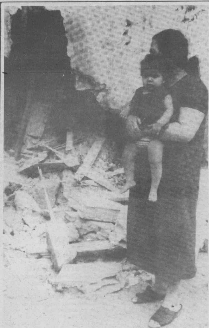
BEIRUTE — Mulheres junto das suas casas destruídas pelos intensos bombardeamentos entre forças sírias e forças cristãs.