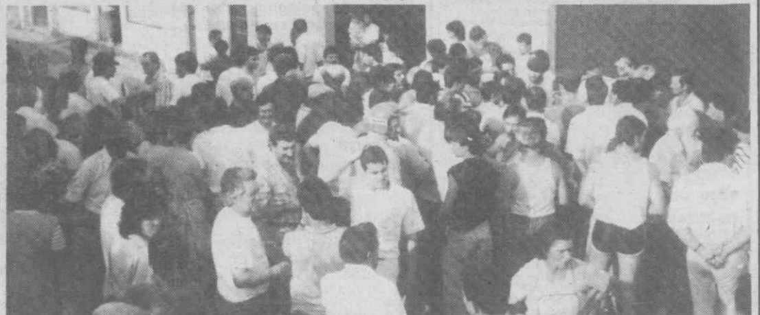
A hora escolhida para a concentração e a «intimidação por parte da GNR, junto da população», não evitou que cerca de 300 pessoas se juntassem e conseguissem levar por diante a sua intenção — o corte da estrada. Contudo a GNR de Sangalhos afirmou-nos o contrário, que no local apenas estiveram cinco elementos, para o controlo do trânsito e nada mais. Uma versão diferente da dada pela população.

Encontro com o governador civil pode evitar formas de luta mais drásticas