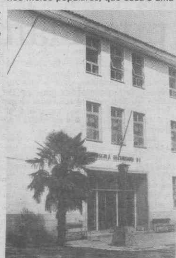
Dos 285 alunos que fizeram a Prova Geral de Acesso ao Ensino Superior, na Escola Secundária Homem Cristo, apenas 15 pediram revisão de prova.