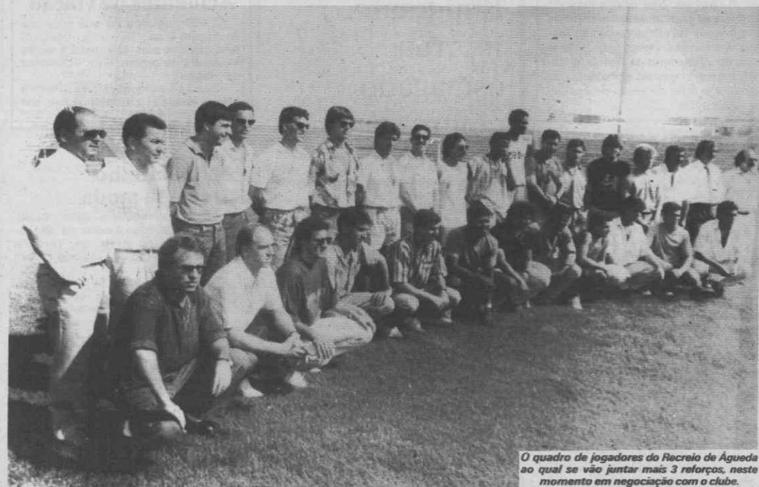
O quadro de jogadores do Recreio de Águeda ao qual se vão juntar mais 3 reforços, neste momento em negociação com o clube.

As palavras finais deste acto da apresentação formal dos “galos de Botaréu” pertenceram ao treinador José Rachão e, em bom rigor, toda a gente se aguardava com expectativa crescente.