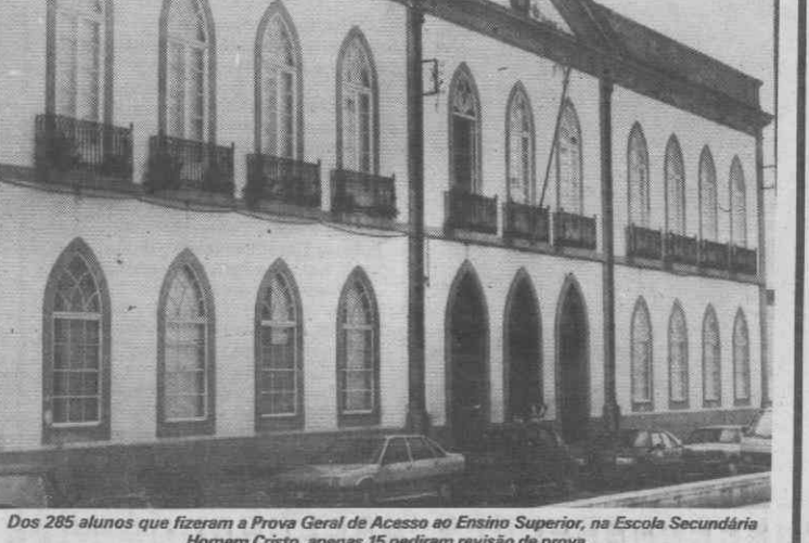
Dos 285 alunos que fizeram a Prova Geral de Acesso ao Ensino Superior, na Escola Secundária Homem Cristo, apenas 15 pediram revisão de prova.

A discoteca tem outras passagens de moda previstas para este mês e no mês de Setembro. Pela PSP ESPINHO. A PSP de Espinho deteve um indivíduo, residente no Porto, por ter furtado, a um revisor da CP, uma carteira com artigos diversos e vários bilhetes de comboio.