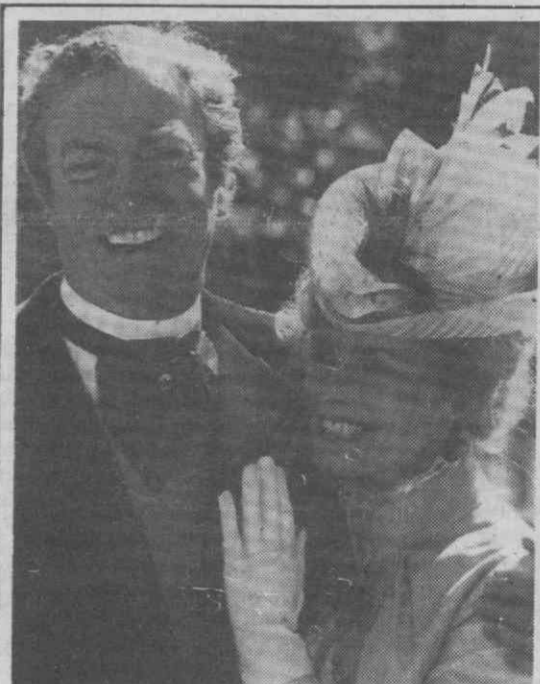
LONDRES — O actor Michael Caine e a actriz Cheryl Ladd durante as filmagens do filme «Dr. Jekyll e Mr. Hyde».