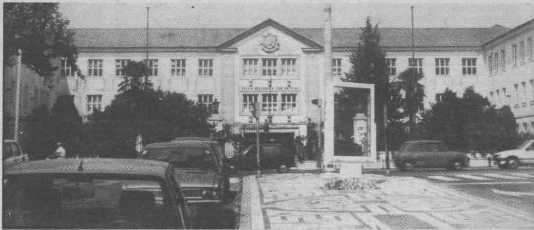
Aqui, na José Estêvão, o número de alunos a efectuar a prova de acesso ao Ensino Superior foi maior. Dos 479, apenas 26 se mostraram insatisfeitos, na prática, com a classificação obtida.

Na Escola Secundária José Estêvão a disparidade, nos resultados dos recursos, subressaiu de sobremaneira, em relação às outras duas escolas secundárias da cidade de Aveiro. Foi nessa escola que 26 alunos pediram recurso de nota. Apenas dois alunos obtiveram um aumento 2 e de 3%, um outro manteve a mesma nota e os outros 24 desceram a classificação anteriormente obtida. Descida esta que oscilou entre os 2 e os 22%. É claro que a surpresa foi grande para os ditos alunos.