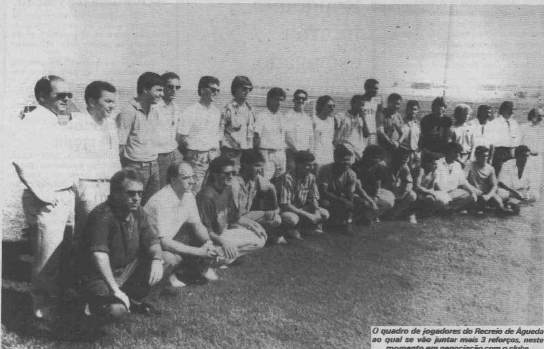
O quadro de jogadores do Recreio de Águeda ao qual se vão juntar mais 3 reforços, neste momento em negociação com o clube.