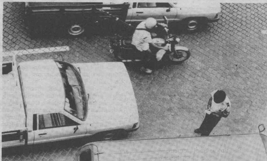
Se há casos de urgência, também é certo que existem pessoas bastante apressadas. Hoje em dia tem de pensar três vezes antes de largar o seu automóvel. As multas de estacionamento sofreram um agravamento de 150%.

esquecido, para os condutores que conduzirem com uma taxa de álcool no sangue igual ou superior a 1,20 gramas/litro, prevê-se uma multa de 200 contos e penas de prisão até um ano.