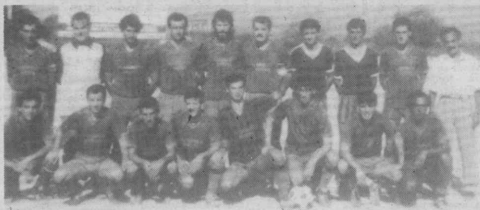
O plantel do Murtoense 89/90.