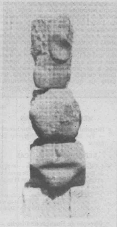
Doze escultores, toneladas de pedra, macetas e cinzéis, algumas máquinas, e muita imaginação: os principais ingredientes do Atelier ao ar livre que se encontra em Aveiro e que permite ao público ver nascer a escultura.