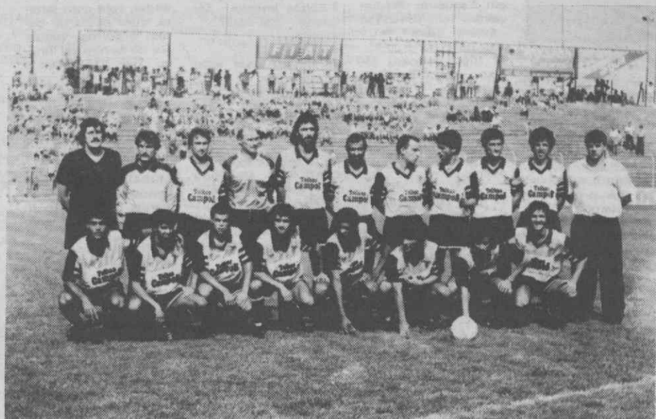
O Beira Mar vai tentar em Portimão, entrar na nova época com o pé direito.