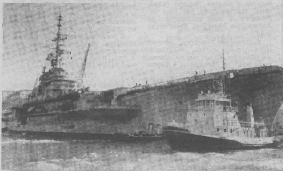
TOULON (FRANÇA) — O porta-aviões francês, Foch, ancorado na Base Naval de Toulon antes de partir para o Líbano, onde a situação se continua a degradar.