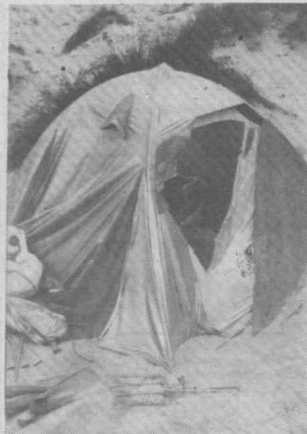
Os assassinos rasgaram a tenda com uma faca para atacarem o Marcus e a Fatima.

A Polícia Judiciária prossegue as investigações com vista à detecção e prisão dos criminosos.