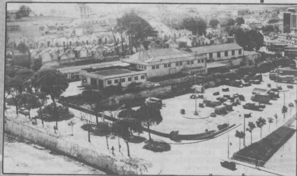
Uma vista sobre o mercado da fruta, situado junto ao Mercado Municipal. Há meses atrás, podia contar-se o número de vendedores e tudo parecia estar em ordem. Agora a situação mudou radicalmente.

— Vendedores efectivos sentem-se ameaçados