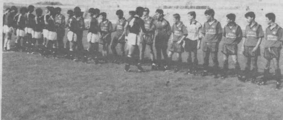
O Benfica apadrinhou a apresentação oficial dos juniores do Recreio de Águeda.