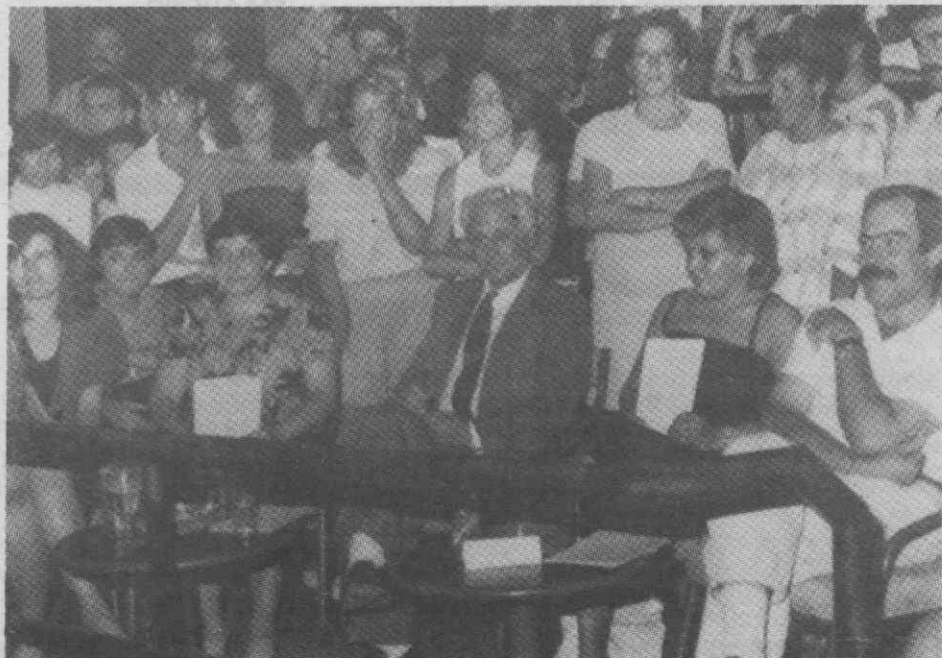
Os 5 membros do júri a quem coube a contestada decisão.