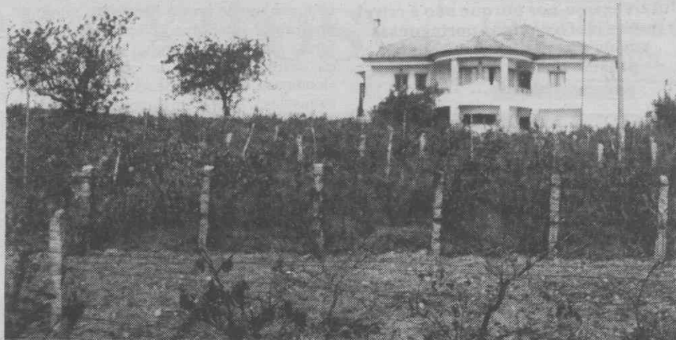
Um aspecto do Casal Lito.

Durante a cerimónia de inauguração das instalações, diversas entidades presentes