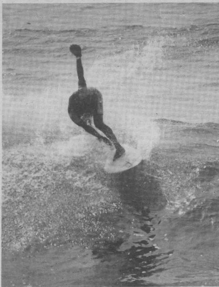
Eurosurf/89: nove dias de emoções...