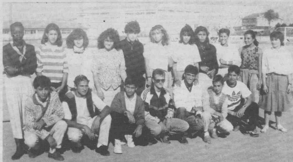
A jovem equipa da ARCO, que tão boa conta de si deu na época passada, promete mais e melhores proezas no futuro.

A Federação Internacional de Desporto Automóvel (FISA) anunciou ontem que a Ferrari foi autorizada a substituir Nigel Mansell pelo piloto de reserva para o Grande Prémio de Espanha, a disputar no Circuito de Jerez de La Frontera.