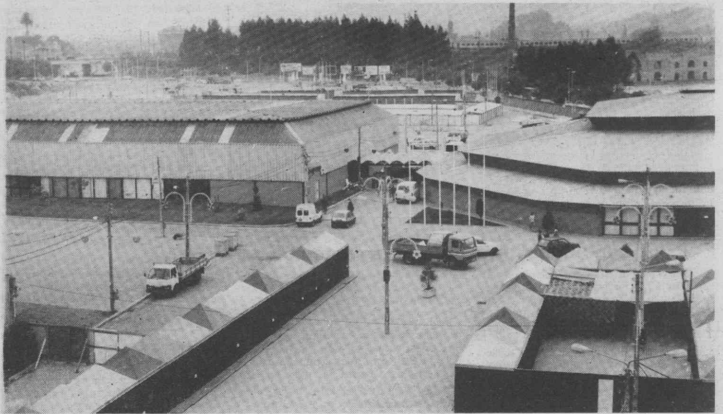
O recinto Municipal de Feiras e Exposições de Aveiro, um espaço cada vez mais requisitado e a necessitar de ser ampliado.

Para esse departamento, a autosuficiência económica como condição de sobrevivência e geradora de novos lucros - possível, segundo os especialistas - provocaria, por si, a necessidade do staff organizar e conduzir o seu trabalho em direcção a novos rumos, criando uma dinâmica de rentabilidade constante das