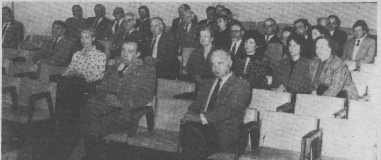
Um aspecto da assistência que participou na cerimónia de apresentação oficial do Gabinete de Apoio aos PALOP's.