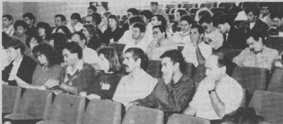
Os trabalhos decorrem no recém-inaugurado anfiteatro do Departamento do Ambiente da Universidade de Aveiro.

As comunicações são seguidas de debates.