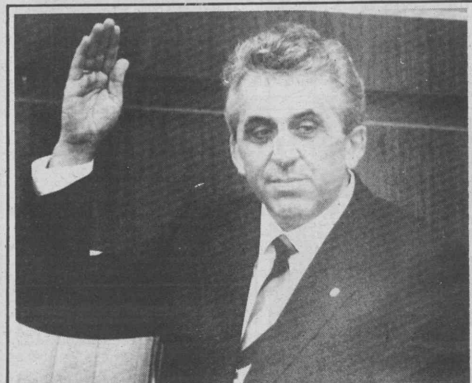
BERLIM — O novo líder da RDA, Egon Krenz, faz o juramento como Chefe de Estado da RDA.

Os habitantes da favela «Nova República», situada na zona residencial de Morumbi, em São Paulo, tinham denunciado e protestado contra a presença da lixeira ilegal que agora soterrou parte do bairro.