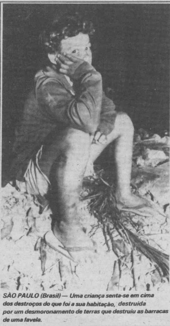
SÃO PAULO (Brasil) — Uma criança senta-se em cima dos destroços do que foi a sua habitação, destruída por um desmoronamento de terras que destruiu as barracas de uma favela.