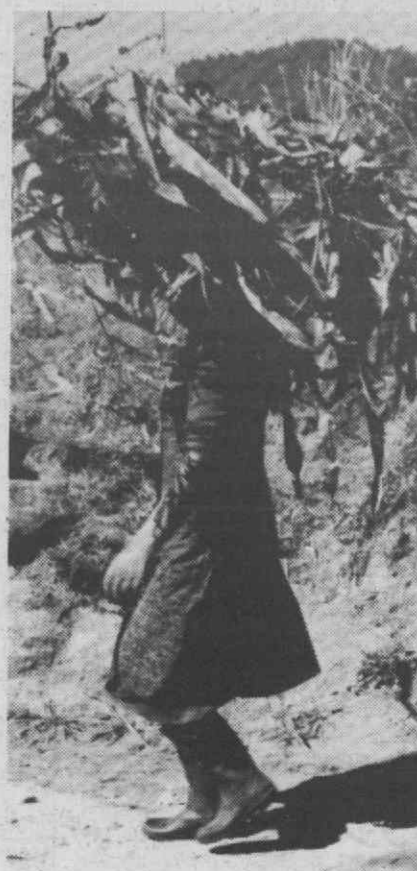
O 1.º prémio.

As imagens captadas durante o Raid estão patentes ao público no átrio do Centro Comercial «Koala».