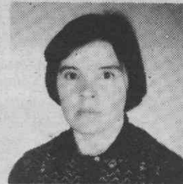
GAFANHA DA NAZARÉ