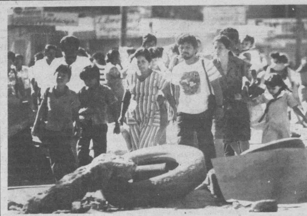
SAN SALVADOR — Milhares de civis regressam às suas casas, depois de violentos combates entre o Exército e guerrilha, na semana passada.