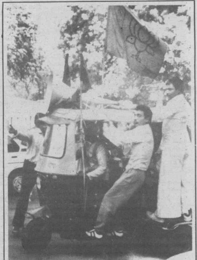
NOVA DELI — Apoiantes do partido de direita Janata percorrem as ruas da capital indiana, com os seus «slogans». De notar, que nesta campanha eleitoral, já morreram 17 pessoas.

Fonte do Ministério do Planeamento disse que em Dezembro deverá ser assinado outro contrato-programa entre a Administração Central e os Municípios de Oeiras e Amadora, «com vista à criação do Parque Suburbano de Carnaxide».