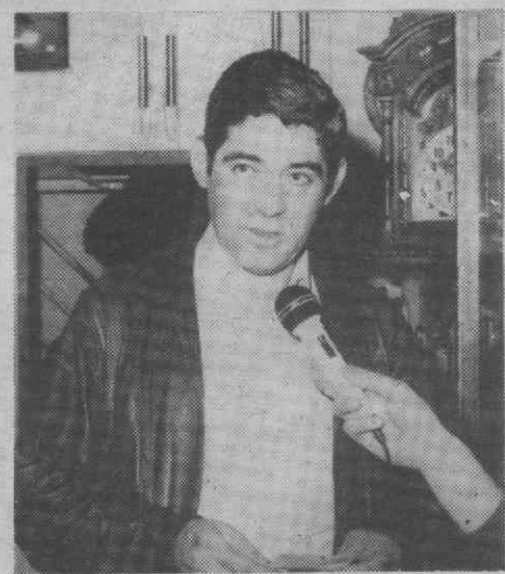
O gerente da Ourivesaria Macedo quando falava à Rádio Regional Diário de Aveiro.