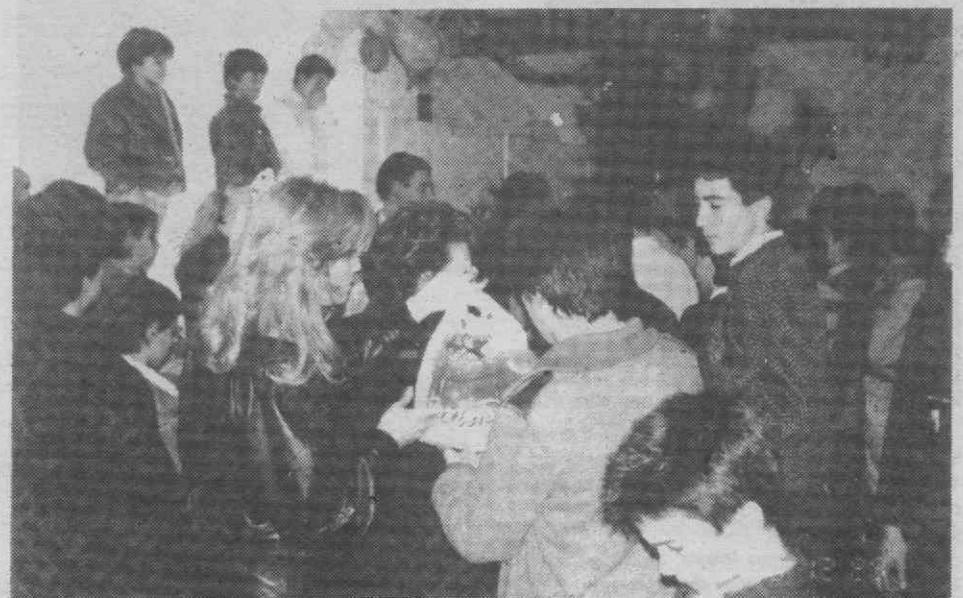
Senhoras do Lions Clube de Aveiro distribuem as prendas aos alunos do Colégio Distrital.

Colégio, em breves palavras, referiu as grandes dificuldades que aquela instituição atravessa, salientando que «a voz do Colégio Distrital continua a não ser ouvida em Lisboa». Aquele responsável acrescentou ainda que «para este Natal ser mais quente e mais humano teve de ser o Lions Clube de Aveiro o grande obreiro», tendo agradecido, em seu nome pessoal, dos trabalhadores do Colégio e dos «seus rapazes» toda a «grande e valiosa ajuda que o Lions tem dedicado, desde há meses, a esta casa, que bem precisa de ser mais acarinhada e apoiada».