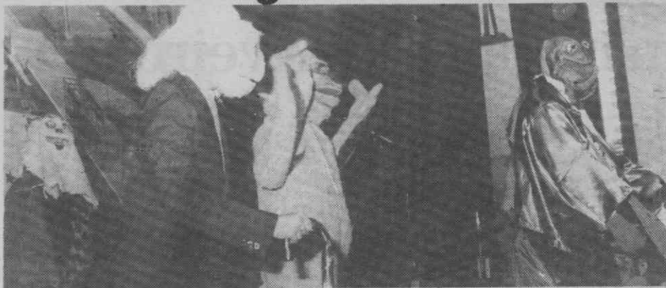
Bonecos animaram a Festa de Natal da PSP.

A Polícia de Segurança Pública de Aveiro efectuou a sua tradicional festa de Natal, na tarde da passada quarta-feira, no Teatro Aveirense.