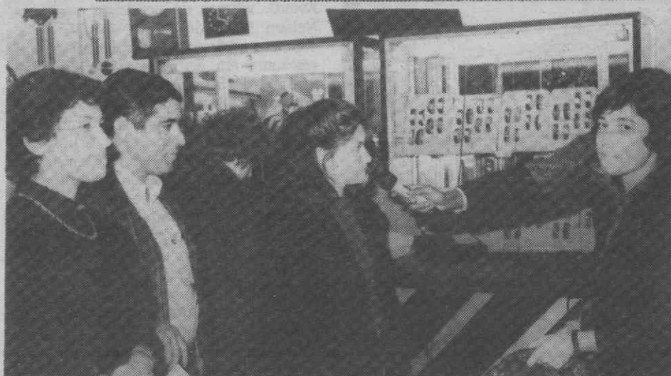
Uma cliente da Ourivesaria Macedo comentou à Rádio Regional de Aveiro a emoção de ter extraído o vencedor do prémio de 100 contos em jóias.

Feitas de ouro de lei ou de pedras preciosas, as jóias são obras de arte cuja beleza aumenta com o gosto de quem as dá e o prazer de quem as recebe. Comprando jóias na ourivesaria Macedo, de Aveiro, dá beleza ao seu dinheiro. Reconheço do direito do prémio a levantar no dia 30/12/89 após as 14 horas na Loja O Gosto das Jóias