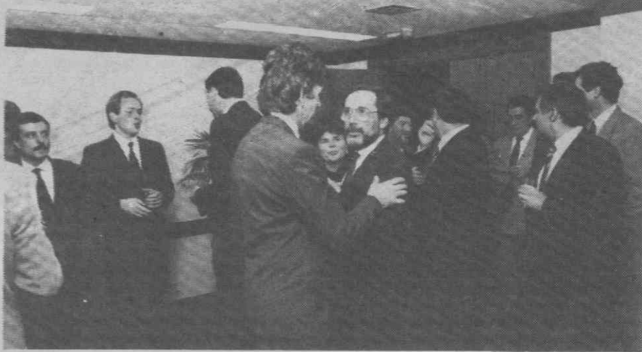
Um momento da inauguração da «Software Center» da Price Waterhouse, em Lisboa.

Com esta medida a CP pretende ajustar a sua oferta a este segmento de mercado, predominantemente constituído