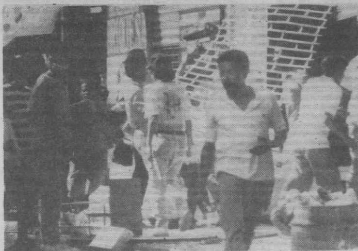
CIDDE DO PANAMA — Populares saqueiam lojas depois da intervenção militar norte-americana.

Vagos, Mira e Murtosa foram os concelhos em que os agricultores mais sentiram na «pele» os efeitos das chuvas, registando-se a destruição de estufas e culturas, com os consequentes prejuízos, estando os responsáveis pela agricultura na região e agricultores a procederem ao levantamento dos prejuízos para posterior anúncio e tomada de medidas tendentes a debelar a situação em que os agricultores ficaram, havendo alguns casos que se podem considerar quase críticos na medida em que viram todas as suas culturas e proventos destruídos. (Cont. na página 8)