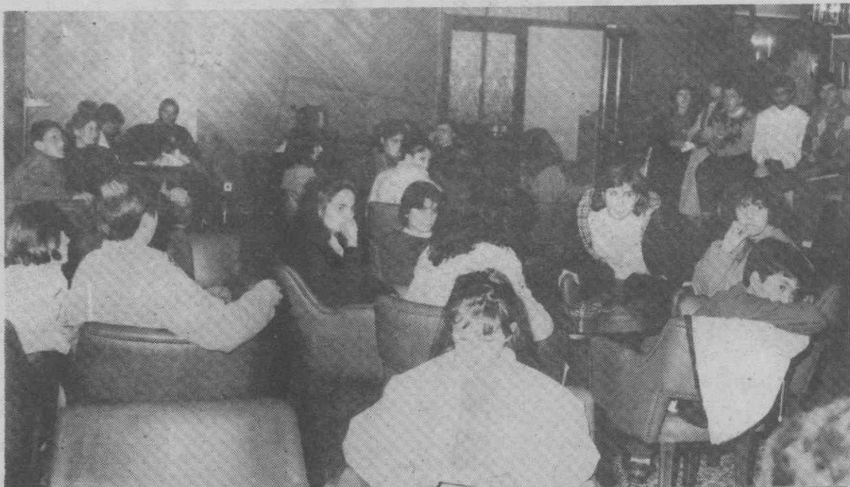
O grupo dos jovens premiados pelo Instituto da Juventude.