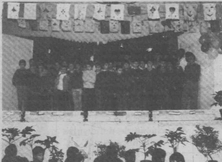
O coro dos alunos do Colégio Distrital na noite da sua Festa de Natal.