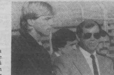
Sunesson na companhia do homem forte do futebol aveirense.

ponta de lança que joga bem de cabeça e que gosta de jogar em equipas que utilizem bastante os extremos. Está cá apenas há uma semana e, pelo que tem observado, parece-lhe que o Beira-Mar tem uma boa equipa para o meio da tabela, embora revele problemas para fazer golos! Quanto à cidade, tem-se adaptado bem pois cresceu numa relativamente pequena e nunca gostou muito de grandes metrópoles! Sente-se quase como em casa, apenas lhe faltando a sua companhia, pessoa com quem vive na Suécia, embora não seja casado. Este sueco de coração quente, revelou ainda que gosta bastante das pessoas latinas, uma vez que