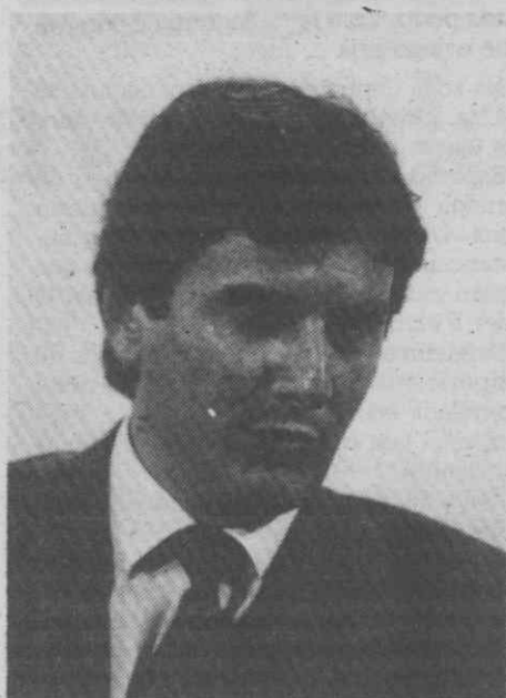
Collor de Mello

A diferença de quase 4 milhões de votos, no total, deu a Collor os argumentos de que ele precisava para negociar o seu programa no Congresso (senadores e deputados), ao