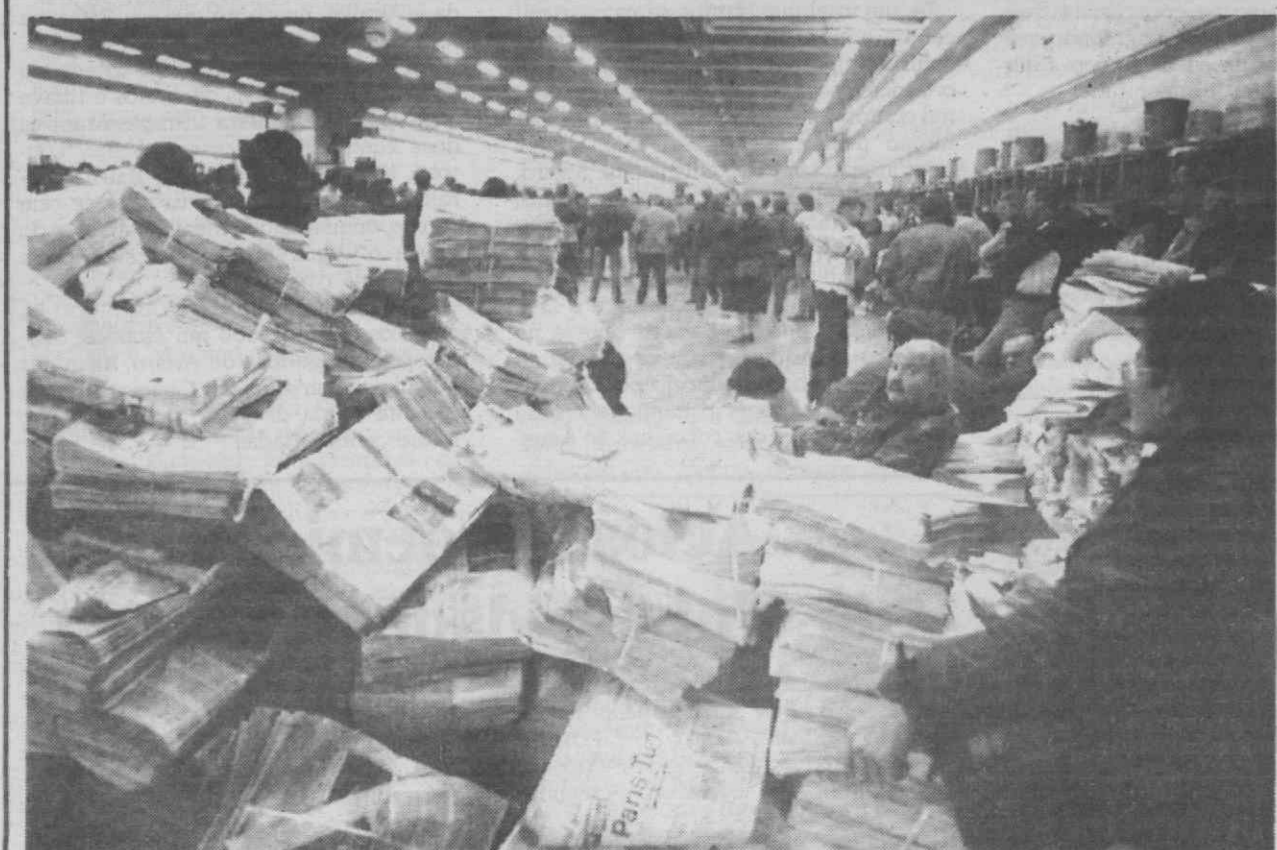
PARIS — Aspecto das pilhas de jornais que aguardam distribuição durante a greve da empresa NMPP.