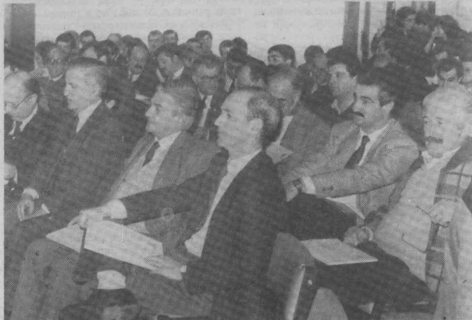
A sala de conferências do Hotel D. Luís estava completa. Os presentes queriam saber quais os projectos de investimentos que tinham sido aprovados para o litoral das Beiras.

A Comissão das Comunidades aprovou ontem, em Bruxelas, para a Beira litoral, um conjunto de projectos de investimento no sector da transformação e comercialização dos produtos agrícolas, foi ontem anunciado no Hotel D. Luís, em Coimbra. Somam cerca de 1 milhão e 700 mil contos e correspondem a 10 de um total de 54 projectos aprovados para todo o país.