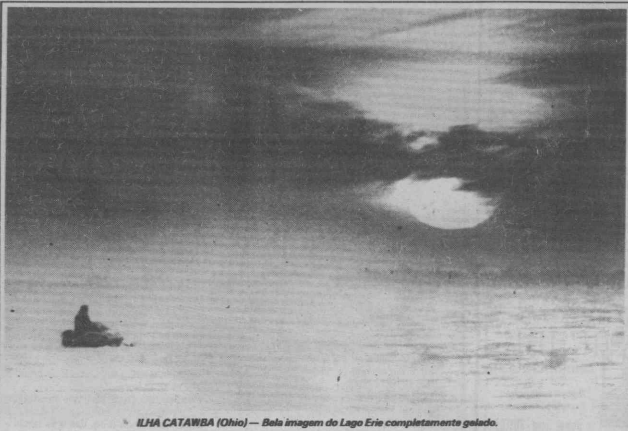
ILHA CATAWBA (Ohio) — Bela imagem do Lago Erie completamente gelado.