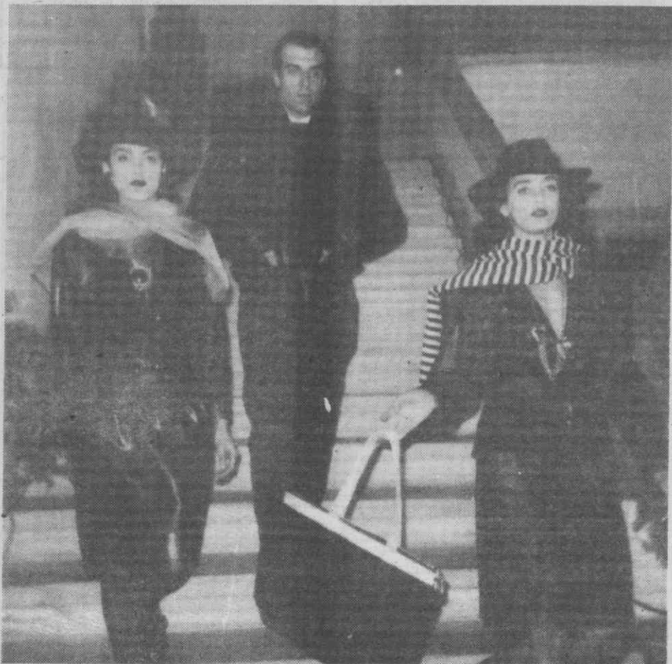
Aspecto da passagem de modelos, que atraiu a atenção geral.