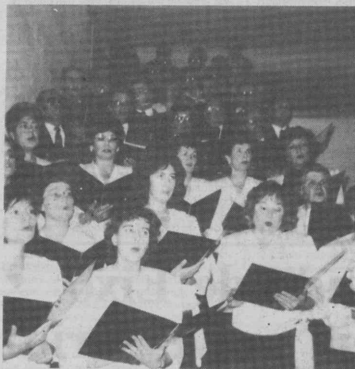
O Grupo Coral da Vera Cruz, uma das atracções do espectáculo.