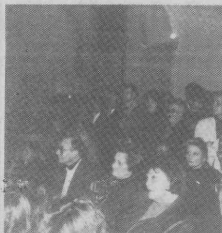
Aspecto da assistência.

Para o ano de 1990, está em agenda a realização do 4.º Festival de Cinema dos Países de Expressão Portuguesa, a conclusão das obras da Biblioteca, a construção do Monumento ao Marnoto e à Salineira, a inventariação das associações culturais e a continuação da edição de obras patrocinadas pela Câmara Municipal.