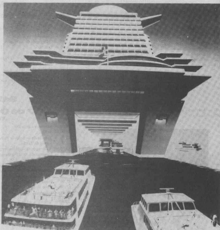
Projecto do «Phoenix World City», um navio-gigante que estaleiros alemães deverão construir para o armador norueguês Knut Kloster, caso esteja assegurado o financiamento. Um super-navio do futuro, uma cidade flutuante sobre as águas.

Desde 1975 que os estaleiros alemães tiveram de reduzir o número de seus trabalhadores por falta de encomendas, de 78.000 para 36.000. Enquanto há 13 anos passados eles ainda torneram 2,34 milhões de TPB, em 1987 foram apenas 446.000 TPB. As suas maiores dificuldades tem origem na mudança de bandeira de navios alemães para países de bandeira complacente da África Ocidental e América Latina. Com a bandeira, também encomendas de novas construções e