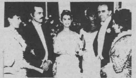
2.a Feira, 8

Rodolfo deixa Ricardo pensar que Dimas é o irmão do Quilombo. Dimas é levado para a esquadra, de onde só sairá se aparecer o seu dono. Enquanto isso, Rodolfo e Fontes pensam na melhor maneira de o tirar de lá.