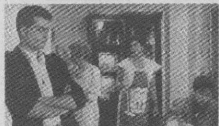
6.a Feira, 12

Com ciúmes de Pedro, Mauricio discute com Tamyris, exigindo que ela não receba ninguém em sua casa, ameaçando-a mesmo com a diminuição da pensão, caso insista em o fazer.