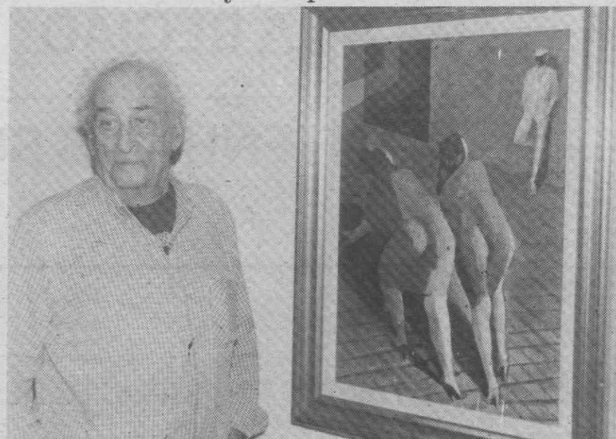
O «mais baiano dos baianos», Carybé, expõe no Estoril.

Descrito por Jorge Amado como «o mais baiano de todos os baianos», Carybé está presente na Galeria de Arte do Casino Estoril, em Lisboa, até ao próximo dia 12, entre as 15 e as 24 horas, com uma exposição de pintura, desenho, gravura e escultura. Tendo nascido na Argentina, filho de pai italiano e mãe brasileira, Carybé viveu alguns anos em Itália,