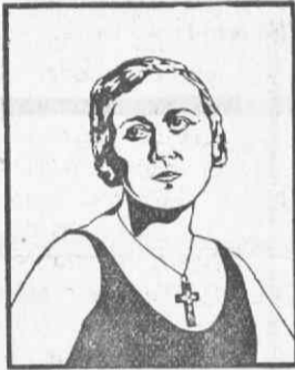
A distinta Actriz Portuguesa D. Amélia Rey Colaço faz parte do Júri.