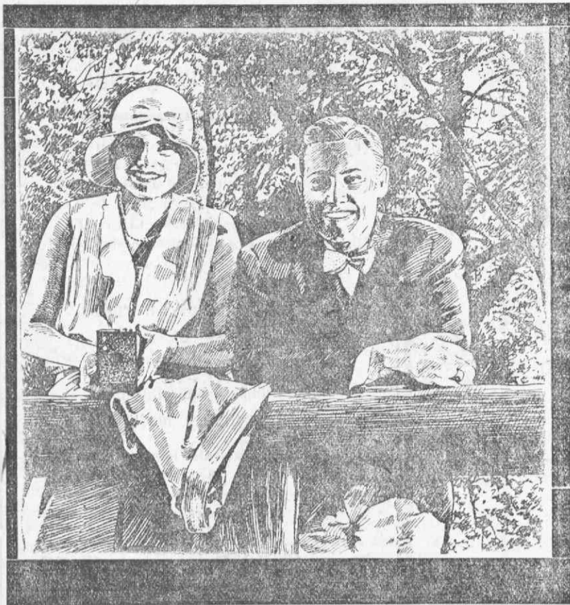
● Aproveite todas as ocasiões que se lhe apresentarem para fazer fotografias, basta uma para triunfar.