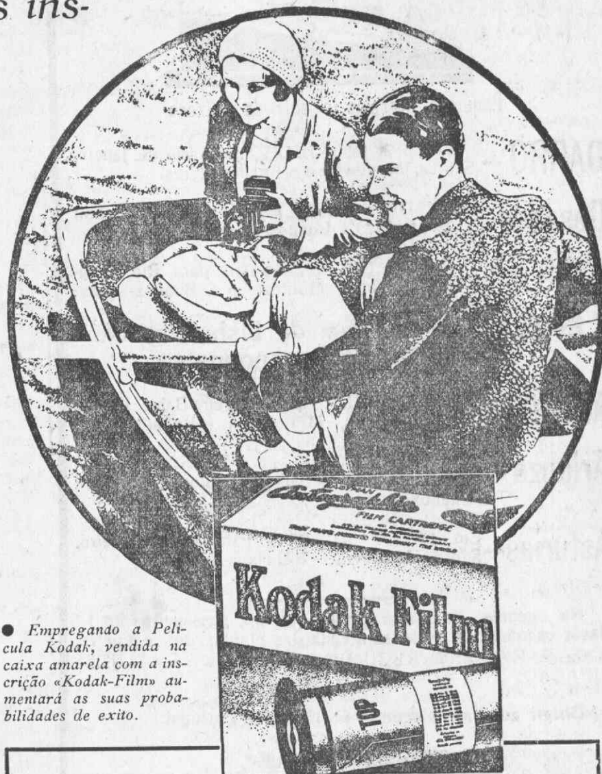
Empregando a Pelicula Kodak, vendida na caixa amarela com a inscrição «Kodak-Film» aumentará as suas probabilidades de exito.