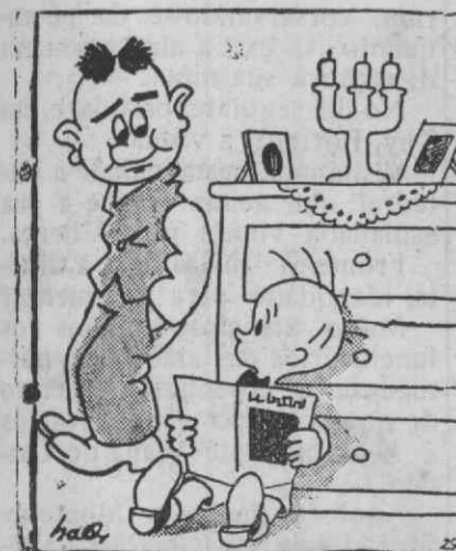
— Ó papá: os índios marcham sempre em fila indiana? — Perguntas bem. Eu já vi um índio, mas estava parado.

A Banda José Estêvão desejamos, que, na cidade do Mondego, colha nòvos louros.